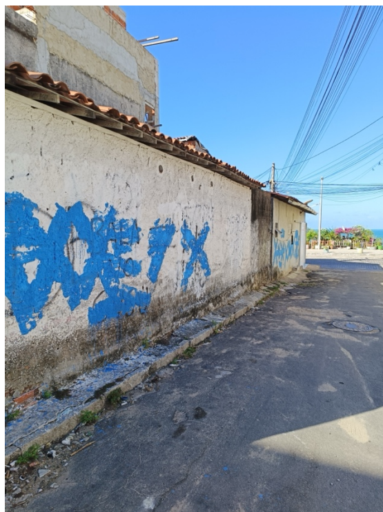
Figura 4. Tinta azul da polícia, tentando cobrir pichação com a frase “bala no CVCÚ”, em referência ao CV, num beco perto da orla na Vila do Mar. © Joke Langens [Pirambu, 06/12/2023]

Durante a maior parte do dia, a orla da praia é deserta. Mas ela ressuscita entre as 17h e as 20h horas da tarde, quando muitas pessoas voltam do trabalho e vão passear ou tomar uma caipirinha numa das barraquinhas que parecem ter emergida de maneira súbita. E tão repentinamente quanto surgiu, toda esta movimentação desaparece novamente. Provavelmente não será por acaso que o corpo de intervenção policial vem patrulhar na orla, a cavalo, todos os dias a esta hora. Em março de 2024, vários moradores, interlocutores com quem mantenho contato, mencionaram que a fronteira entre ambas as facções, durante tanto tempo tão estabelecida na Avenida Dr. Theberge, que acaba justamente na orla, começou a ser mais movediça. As pichações vão indicando as mudanças de poder – que nesta altura parecem ser diárias – nas ruas paralelas à Avenida Dr. Theberge.