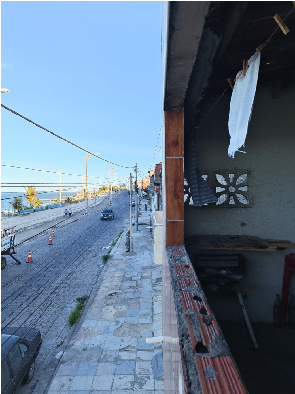
Figura 5. Vista para a orla na Vila do Mar, tirada da varanda de Jéssica.

arroz e farofa de dendê, penso como todas estas práticas aparentemente banais, num mundo cruelmente reinado pelas facções, se transformaram em nada menos que atos de resistência.