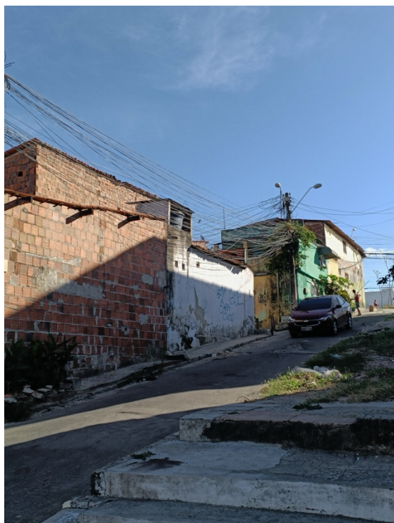
Figura 3. Pichação da GDE, com a frase “Bota na cara CVCÚ” em referência ao CV, num beco perto da orla na Vila do Mar.