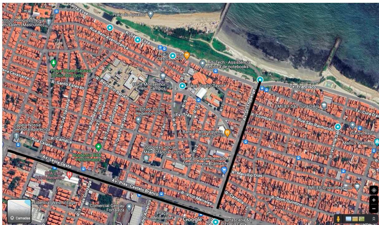
Figura 1. Mapa do Pirambu, com indicação de dois eixos importantes: as avenidas Leste-Oeste e Presidente Castelo Branco, que conectam o centro de Fortaleza (leste) com a cidade vizinha de Caucaia (oeste), e a Avenida Dr. Theberge. Esta avenida traça a fronteira entre o Cristo Redentor, parte do Pirambu a leste da avenida e dominada pelo CV, e a Vila do Mar, parte do Pirambu a oeste da avenida e dominada pela GDE.

Fonte: Google Maps (Data de acesso: 13/03/2024).