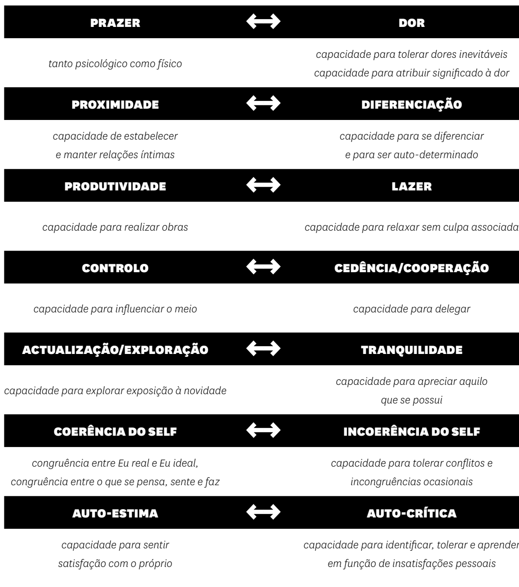
Figura 1. MCP – Modelo da Complementaridade Paradigmática: Visão dialética das necessidades

De acordo com o Modelo da Complementaridade Paradigmática, as necessidades psicológicas são dialéticas, porque o modelo defende uma perspetiva dialética, considerando que não é a satisfação da necessidade em si mesma, mas a capacidade para regular as diferentes necessidades (Sheldon & Niemiec, 2006) que leva ao Bem-Estar. Deste modo, o desenvolvimento de capacidades de um dos polos possibilita mais desenvolvimento no polo oposto (Blatt, 2008). Por definição, os pares Autoestima/Auto-