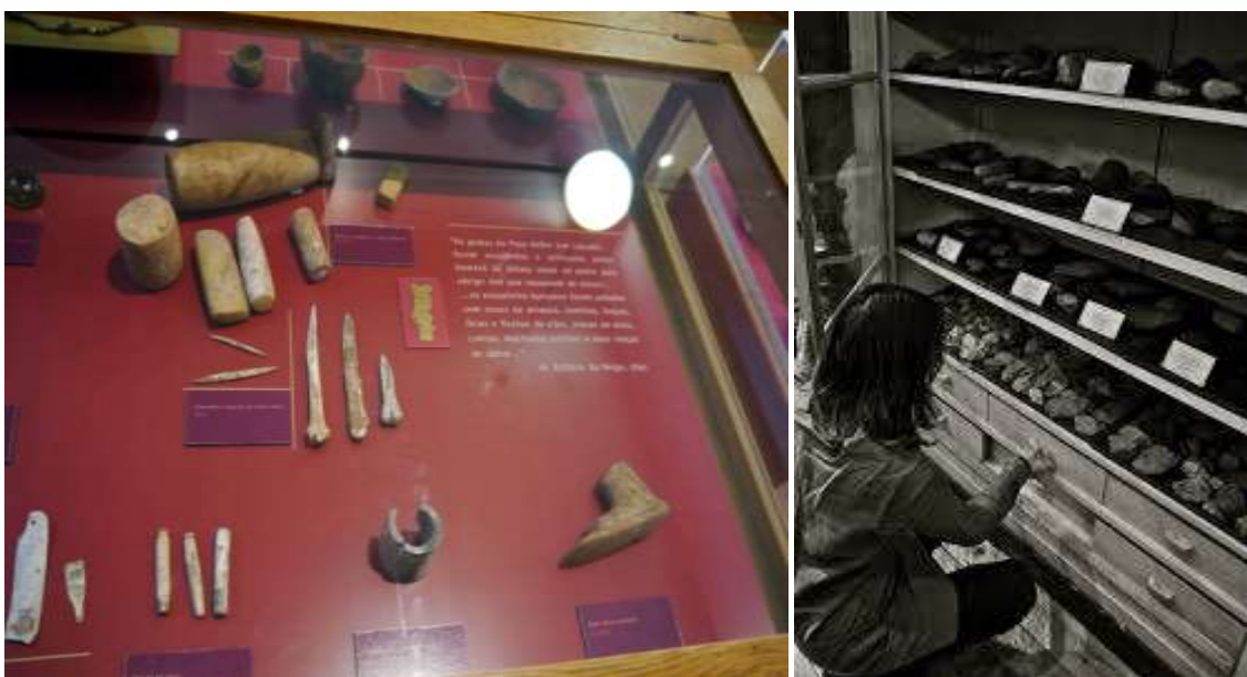
Fig. 27. Vista parcial de expositor com artefactos exumados em monumentos megalíticos.