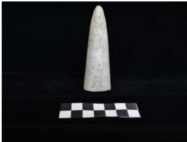
Fig. 15. Ídolo fálico (calcáreo)