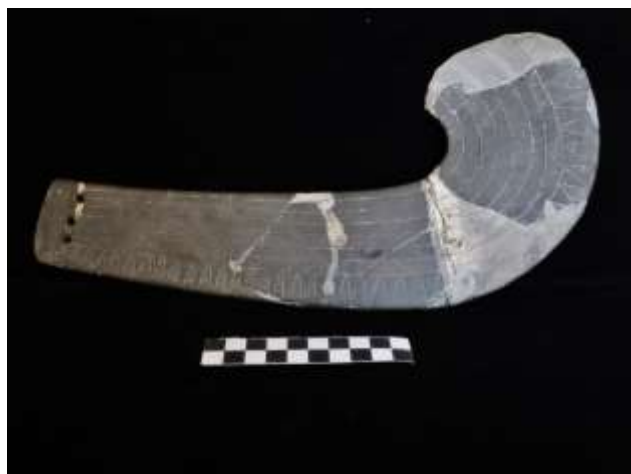
Fig. 9. Ídolo em forma de báculo. Provável estilização do machado encabado (xisto)