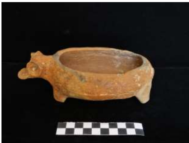
Fig. 8. Vasilha zoomórfica em forma de suíno (cerâmica)