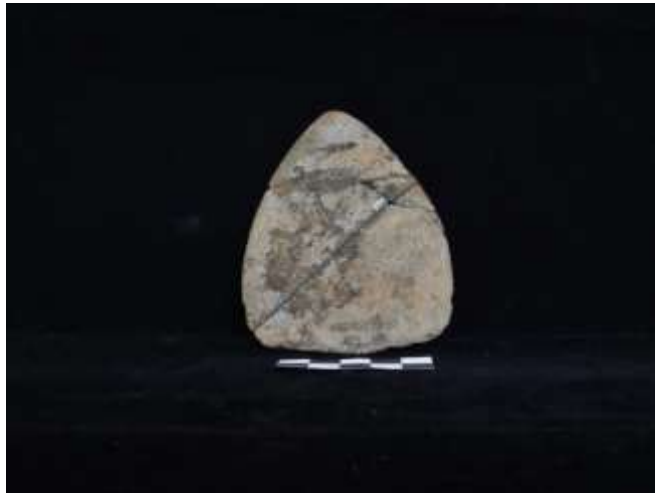
Fig. 18. Pequena alabarda votiva de pedra polida (microgranito)