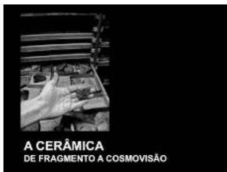
Fig.3. Actividade no Museu do LNEG