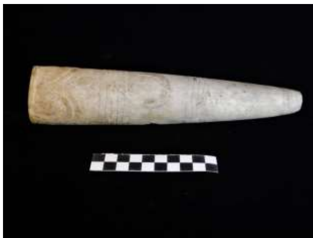
Fig. 12. Ídolo antropomórfico decorado, destacando-se, em relevo, uma lúnula. (Crê-se que nesta época, cerca de 2500 a.C., os povos adoravam o Sol e a Lua. Tradição que vem, seguramente, desde o início do Neolítico).