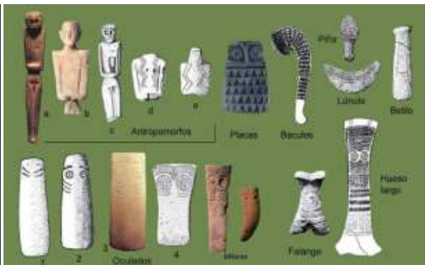
Fig. 34. O imaginário. Monumento megalítico, de uma série de desenhos, em blog sobre o tema.