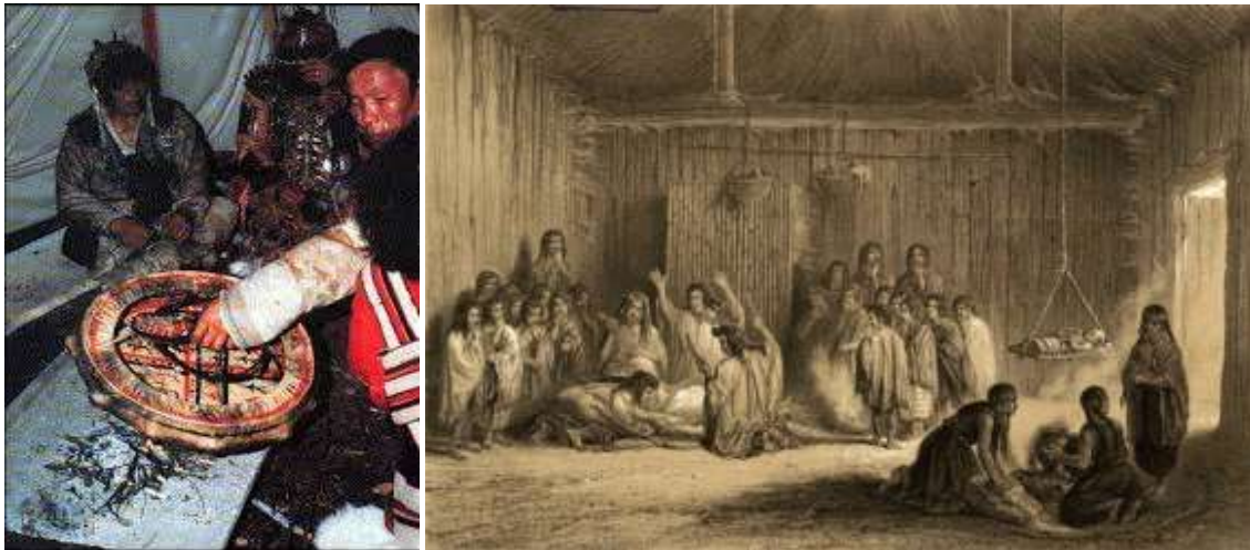
Fig. 23. Xamã siberiano actual num ritual do fogo, na presença de dois assistentes. Tambor decorado com símbolos cósmicos. (Fonte: Remete para Índice de Imagens)

que pretendem simbolizar os opostos aspectos do cosmos que equilibram o pequeno pedaço do Universo abarcável desde o Promontório da Lua e seu Tholos .