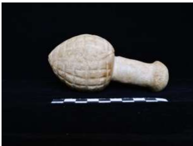
Fig. 11. Ídolo de pinha decorado com retículo de serpentes (calcário)