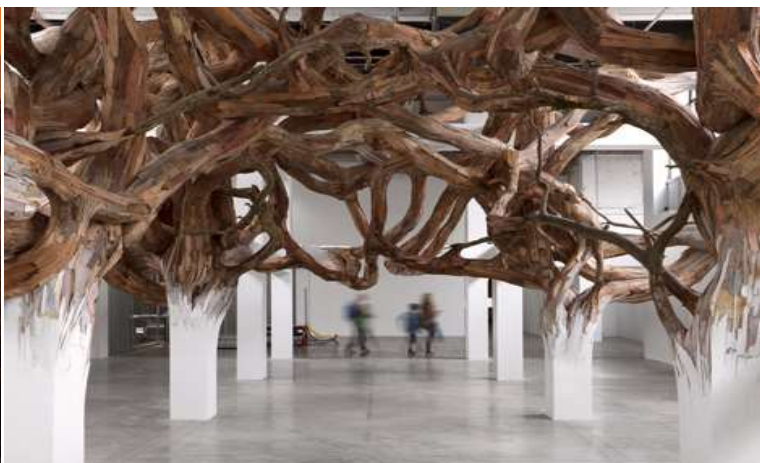
Fig. 32. Justa homenagem do Museu Quai Branly ao Etnólogo francês.