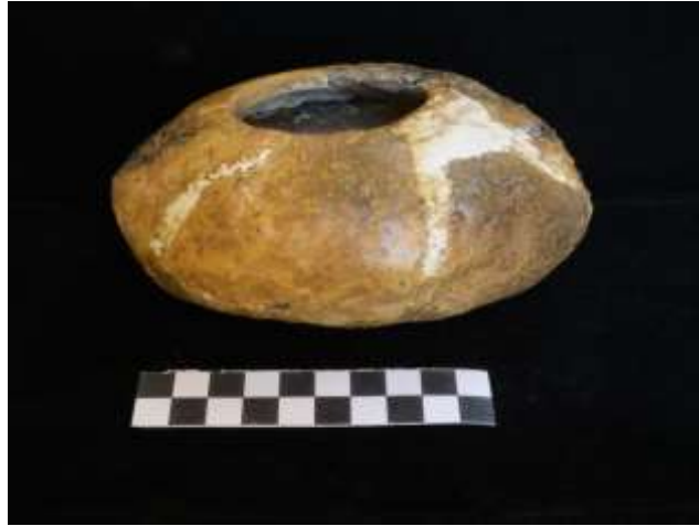
Fig.20.Lamparina de suspensão (cerâmica lisa)