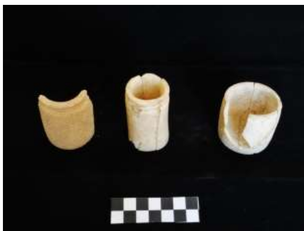
Fig. 7. Recipientes para unguentos e/ou votivos (calcário e osso)