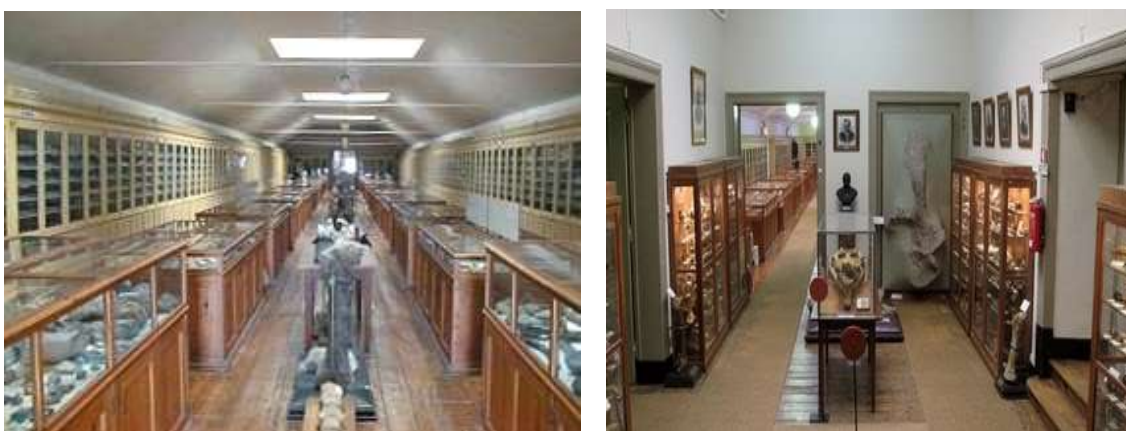
Figs. 25/26. Vistas parciais dos expositores da Sala de Arqueologia Pré-Histórica do Museu do LNEG.