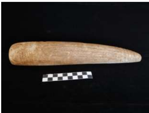
Fig. 13. Ídolo gravado antropomórfico (mármore)