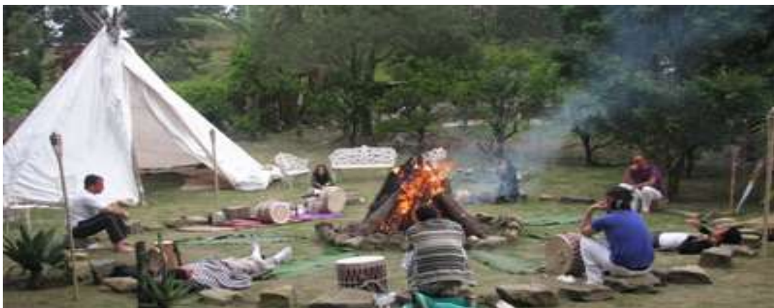
Fig. 41. O Xamanismo Nova Era , ou Neoxamanismo .