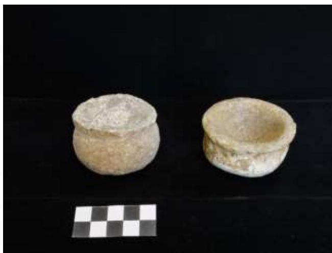
Fig. 16. Recipientes votivos «Gaal» (calcáreo)