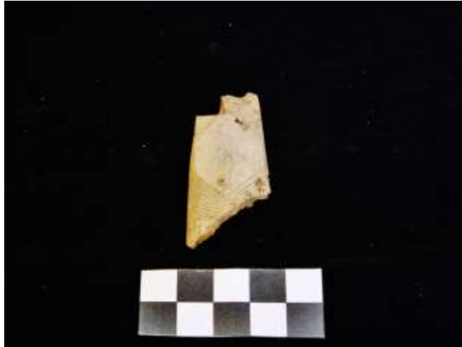
Fig. 17. Pente votivo decorado (osso)