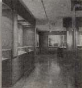
Fig. 31. Museu de Mação: um exemplo de sucesso da Nova Museologia (in: Diário dos Açores).