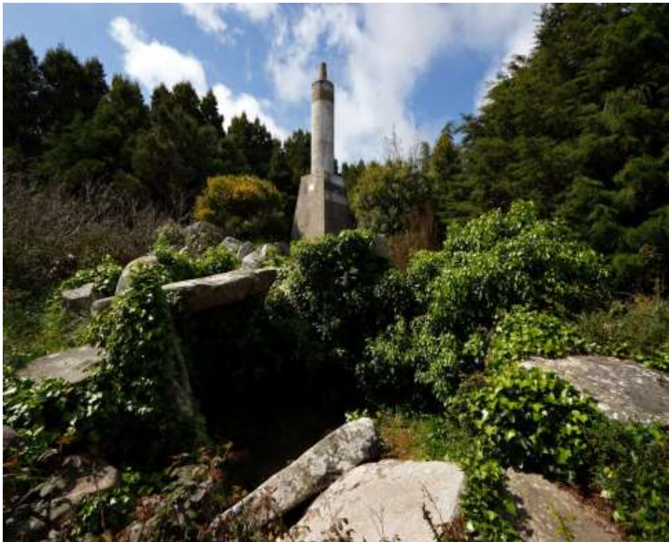
Fig. 43. Marco geodésico erguido (a 500m de altitude) sobre as ruínas do monumento Megalítico Tholos do Monge .