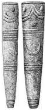
Fig. 22. Ídolos antropomórficos decorados, destacando-se a meio uma lúnula (Fonte: Remete para Índice de Imagens)