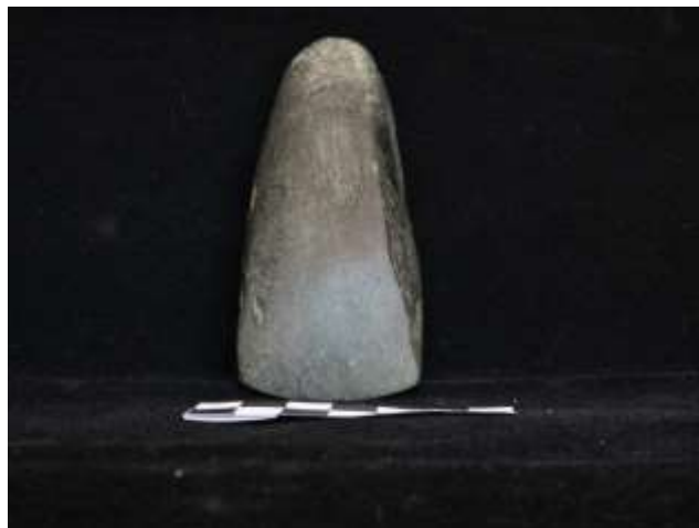
Fig. 19. Machado votivo (xisto anfibrólito)