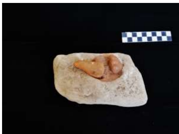
Fig. 5. Base para preparação de ocre (calcário)