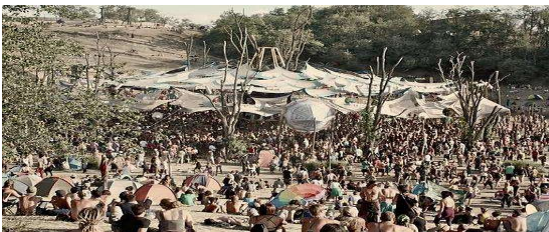
Fig. 42. Festas rave de inspiração xamânica.