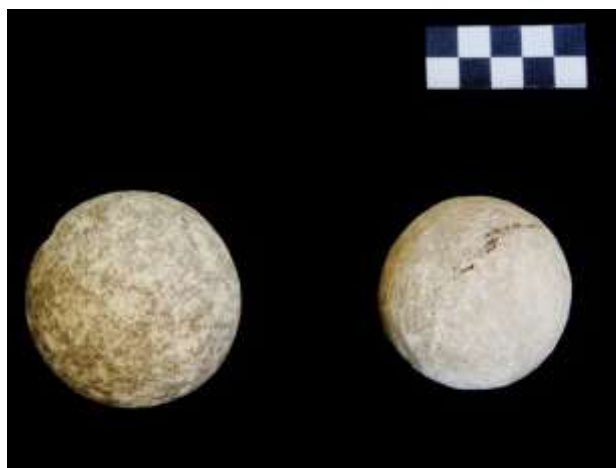
Fig. 4. Esferas de uso desconhecido (calcário marmóreo)