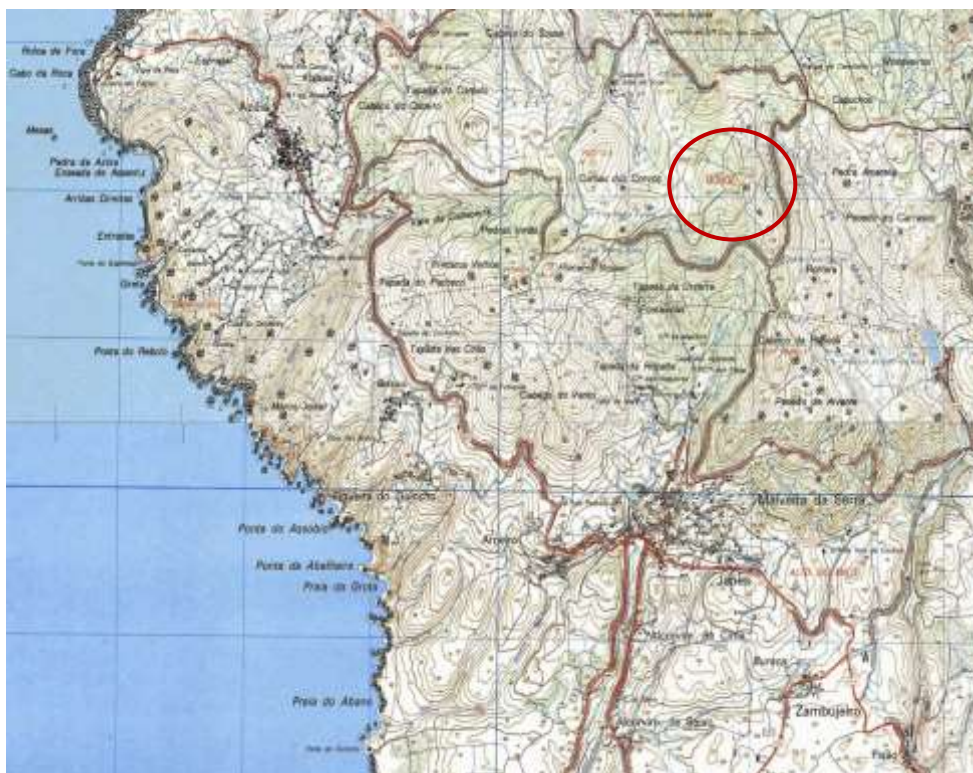
Fig. 44. Região do Parque Natural Sintra-Cascais assinalando do pico do ‘MONGE’ a que deve o nome a estrutura megalítica.