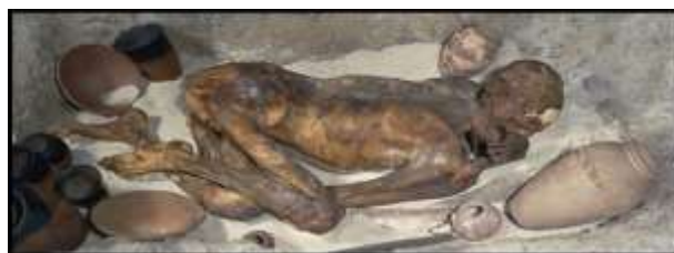
Fig. 1. Reconstituição de enterramento de neandertal.

É desta básica inquietação humana, do que resta destes rituais, o que podemos encontrar na Sala de Arqueologia Pré-Histórica do Museu do Laboratório Nacional de Energia e Geologia. É o que proponho narrar sob o foco atemporal do Sagrado. Creio ser esta a abordagem correcta – ou, pelo menos, a cientificamente mais interessante – para a leitura eminentemente antropológica (semiótica-simbólica) que pretende enquadrar artefactos arqueológicos na perspectiva geral desta dimensão do Ser Humano.