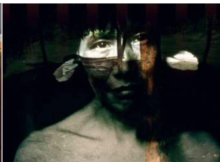
Fig. 38. Rara reconstituição de um xamã em exposição permanente. Xamã da Manchúria, de 1928 Trabalho de Bin Garten. Museu Ubersee, Bremen, Alemanha.