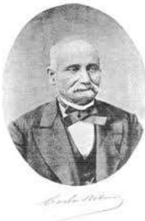
Fig. 29. Carlos Ribeiro (1818-1882). Pioneiro da Arqueologia por trabalhos nas Comissões Geológicas e Mineiras do Reino. Principal impulsionador da Colecção de Arqueologia do Museu Geológico.