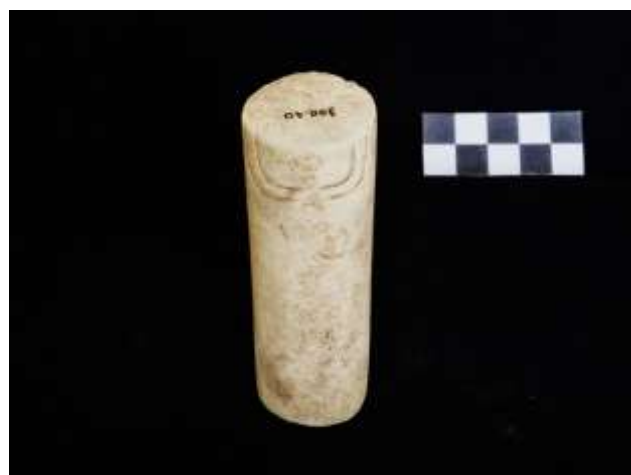
Fig. 10. Ídolo cilíndrico com decoração antropomórfica (calcário)