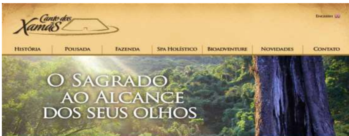
Fig. 40. O Xamanismo 'take-away' .