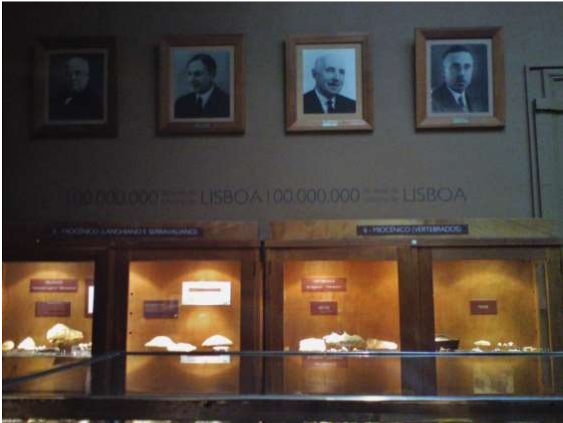
Fig. 2. Aspecto parcial de uma das Salas de Paleontologia do Museu do LNEG, destacando-se o mobiliário original e as fotografias dos cientistas pioneiros das Comissões Geológicas do Reino , principais responsáveis pela recolha, estudo e classificação do espólio do Museu.