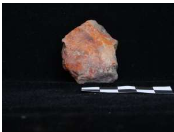
Fig. 6. Nódulo de ocre