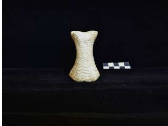
Fig. 14. Ídolo oculado (falange de equídeo)