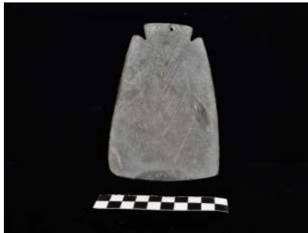
Fig. 21. Ídolo de placa decorado antropomórfico (xisto)