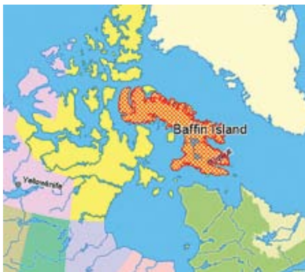
Fig. 4: Ilha de Baffin

Christopher Hatton, Philip Sidney, Francis Walsingham, ou Lord Burghley, visando, como o nome bem explicita, a definição do império britânico através de uma panóplia de argumentos, históricos e legais, para assegurar o direito de propriedade sobre ele.