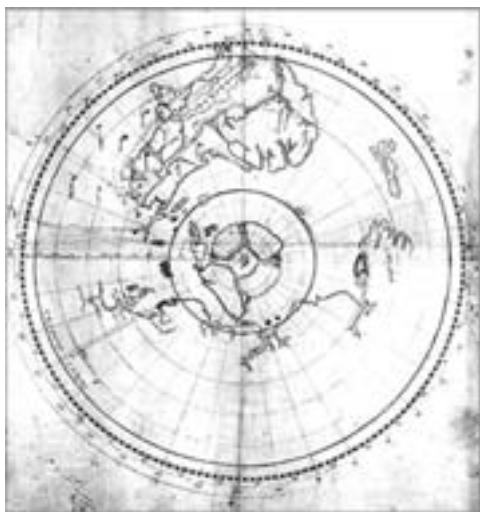
Fig. 5: Carta Polar de John Dee

Dee afirmava, igualmente, que Atlantis , grosso modo a América do Norte, era menos larga, em termos de latitude, do que geralmente se cria, pelo que seria mais fácil e mais rápido traçar uma rota passando pelo noroeste. É com tais pressupostos que, uma vez obtido o alvará da rainha, Humphrey Gilbert se lançará numa viagem, em 1582, em busca da passagem a noroeste com o propósito de se estabelecer naquela zona de Drogio e dedicar-se à prospecção do ouro, ouro que, desafortunadamente, nunca viria a ser encontrado.