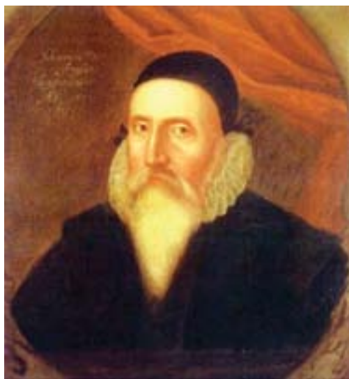
Fig. 1: John Dee (1527 – 1608)

O Império Britânico é, desde há muito, matéria de estudo e pesquisa para investigadores das mais diversas áreas, seja no âmbito da história ou da geografia, seja focalizando-se em análises económicas ou sociais, seja no realce da produção estética que lhe está associada, ou ainda nas reflexões teóricas que fundamentam e/ou emolduram essas abordagens. Enfim, a lista pecará sempre por defectiva. Todavia, existe um ponto de convergência discernível em quase todas elas: a cronologia dos estudos sobre o Império Britânico privilegia o século XIX como época da sua afirmação ou auge, recuando, em alguns casos, até ao século XVIII como momento definidor do referido império, embora ainda mais marcado pela praxis do que pela arquitectura de uma ideologia própria.