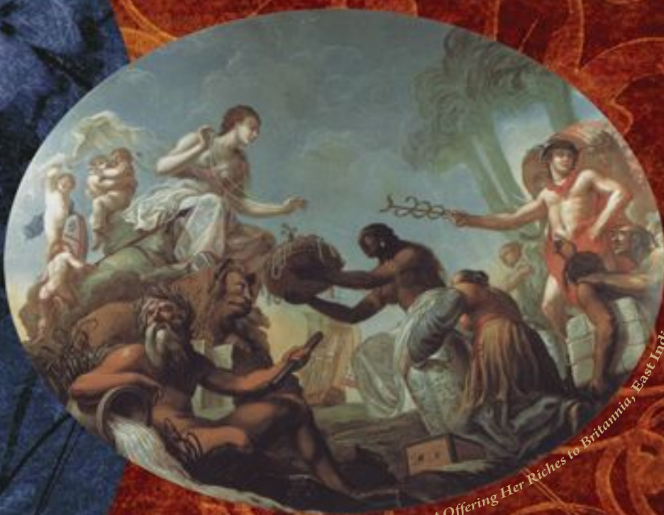
The East Offering Her Riches to Britannia, East India House

O Império Britânico. Ideologias, Perspectivas, Percepções