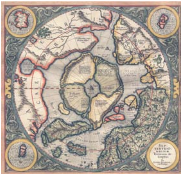
Fig. 3: Estotilândia

Location for the Island of Estotilant and the Province of Drogio”, e “Concerning this Example of Geographical Reform”, respectivamente, são, com toda a probabilidade, datados de 1577, altura em que Martin Frobisher e Humphrey Gilbert procuravam o apoio real para um projecto de estabelecimento de colónias nas regiões descritas nos textos de John Dee. 6 Quanto ao terceiro documento, “Unto your Majesties title Royall to these forene Regions, & Ilands”, datado de 1578, é complementado pelo quarto, surgido pouco depois com o título que passará a designar o conjunto, “Brytanici Imperii Limites”. A obra, no seu todo, não se destinava a publicação, mas para uso pessoal da rainha e dos seus conselheiros mais próximos, como por exemplo, Edward Dyer,