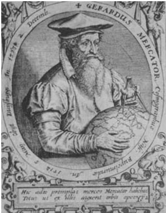
Fig. 2: Gerardus Mercator

Gemma Phrysius, 4 mestres conceituados de cartografia e cosmografia. Numa visita a Bruxelas seria apresentado ao matemático português Pedro Nunes, com quem viria a estabelecer relações de amizade, bem como a Abraham Ortelius, autor de Theatrum Orbis Terrarum , o trabalho mais avançado no âmbito da geografia, de acordo com a recepção da época. Paris, por seu turno, alargava os horizontes no tocante à astronomia e à astrologia (Trattner 18-19).