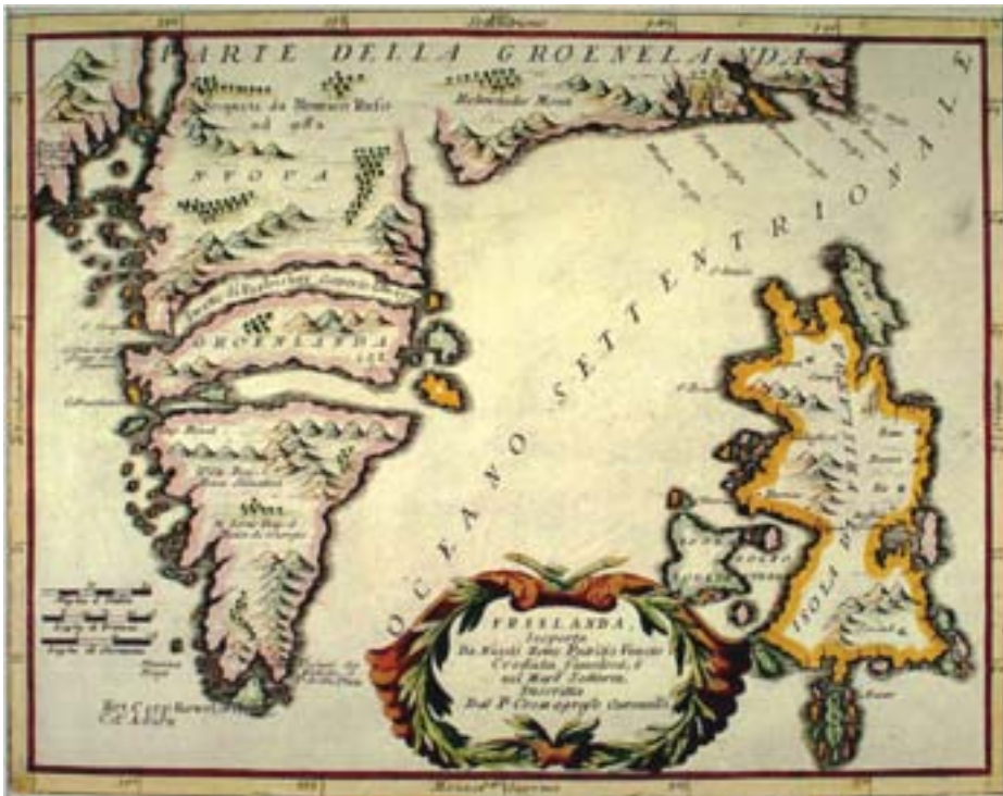
Fig. 6: Frislândia

goinge northerly, and then to all the most northern ilandes great and small, and so compassinge about Groenland , eastwards untill the territoris opposite vnto the farthest easterlie and northern boundes of the duke of Moscovia his dominions.” (Dee 43)