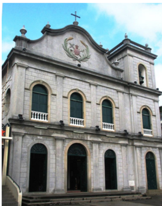
Igreja de São Lázaro, em Macau, erguida a partir do ano da ocupação do território, 1557

A China sempre foi um espaço interdito aos estrangeiros, os chineses consideravam-se o centro do mundo ( o país do meio ) e desprezavam os forasteiros, essas criaturas estranhas com hábitos de vestuário e de alimentação bárbaros e grotescos. No tempo dos imperadores Yongle e Xuande da dinastia Ming (1403-1435) eles empreenderam sete grandes expedições marítimas comandadas pelo almirante Zhen He, um eunuco muçulmano, pelos oceanos Pacífico e Índico, parece que uma delas levava trinta mil homens em sessenta e dois navios, mas não tiveram continuidade. Há quem defenda que teriam alcançado o sul do continente americano, mas a China continuou fechada sobre ela mesma, no centro do mundo, perseguindo e punindo severamente os intrusos. Até ao século XIX, mesmo os chineses instruídos ignoravam o nome dos principais países ocidentais, pelos quais não tinham apreço nem ponta de curiosidade. Com a criação da República Popular da China em 1949 e a revolução cultural