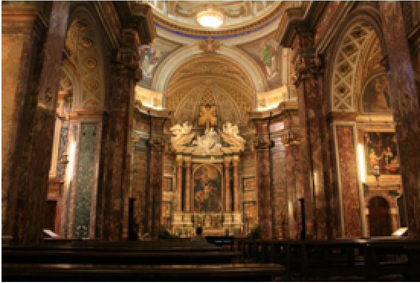
Interior da igreja de Santo António dos Portugueses

convencionais, para defender as suas ideias. Já citara o último capítulo do livro dos Provérbios, que descreve a mulher forte e virtuosa, logo no início do sermão. Pois a Rainha Santa teve a força e a virtude de conservar o cabedal de rainha para granjear ser melhor santa (VII, 399).