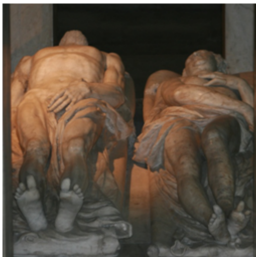
Túmulo de Henrique II e Catarina de Médicis

em Paris um grande número de adeptos da reforma calvinista e na noite de São Bartolomeu (25 de Agosto) começou uma matança que dizimou à volta de vinte mil protestantes por toda a França. Os realizadores do espectáculo das torres gémeas de Nova Iorque, armados com meios pirotécnicos sofisticados, apenas conseguiram uma sexta parte da façanha, apesar de terem ganhado em espectadores, com a cumplicidade dos meios modernos de comunicação. Daqui por mais quatrocentos anos, não é certo que o espectáculo do 11 de Setembro ainda seja citado nos manuais das proezas. Já lá vão quatrocentos e quarenta e cinco anos e o massacre de São Bartolomeu é verbete assente em todas as enciclopédias. O que não faz uma rainha para garantir o seu lugar na história!