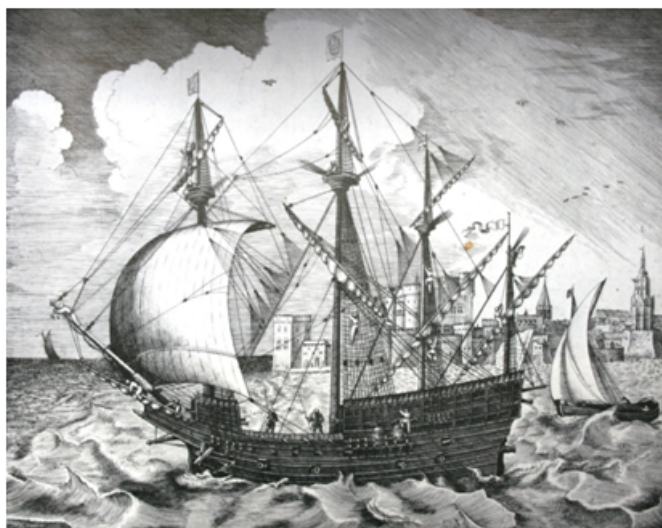
Nau portuguesa do séc. XVI em Antuérpia, gravura flamenga da época, de F. H. Bruegel. No mastro de proa ostenta estandarte da cruz de Borgonha, no principal içã a bandeira portuguesa com a esfera armilar e no mastro de mezena a bandeira da cidade do Porto.

Nilo, permitindo o acesso ao coração do mundo islâmico, um território considerado então como parte da Índia ; por esses rios infestados de criaturas monstruosas ( Esmeraldo , livro I, cap. 27, par. 115 e 116) penetraria a nova cruzada dos cristãos latinos, ao encontro do reino do Preste João , situado algures pelas Etiópias . Toda a África abaixo do Sahara e parte da Ásia de então, incluindo a Pérsia e a Índia, entravam na denominação genérica de Etiópias e acreditava-se que por tão vasto espaço se encontrariam, isoladas, antiquíssimas comunidades cristãs. A primeira igreja cristã dos trópicos pela rota portuguesa da África atlântica, foi uma ermida perto do mar e dedicada a Nossa Senhora da Conceição, erguida em 1470 na Ribeira Grande, ilha de Santiago, arquipélago de Cabo Verde, visitado por Cadamosto e colonizado pelos portugueses a partir de 1460, reinava D. Afonso V. A expansão portuguesa progredia lenta mas seguramente.