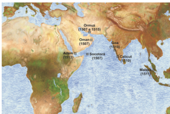
Espaço da atuação militar de Afonso de Albuquerque durante a segunda estadia no oriente

um filho de cristãos novos já famoso no reino, chamado Garcia da Orta, que se instalou como médico em Goa, onde conviveu com Luís de Camões e onde viria a falecer em 1568. Devemos-lhe uma grande obra científica publicada em Goa em 1563, Colóquio dos simples e drogas e coisas medicinais da Índia – o primeiro olhar crítico de um médico ocidental sobre as tradições curativas do oriente.