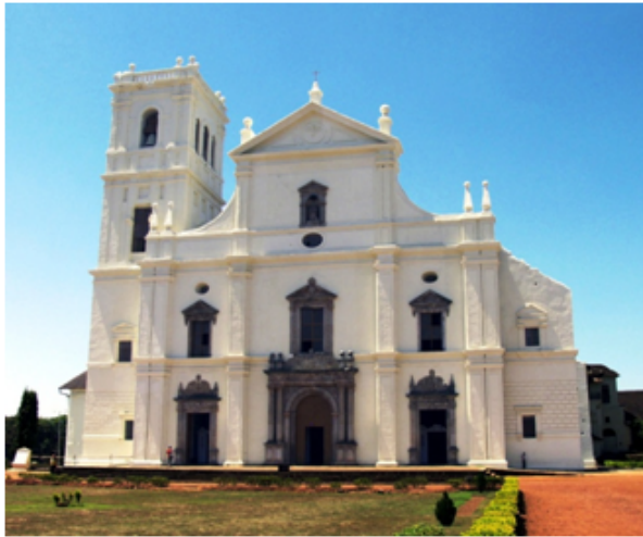
Sé Catedral de Goa, edificada no mesmo local da primeira ermida dedicada a Santa Catarina e mandada construir por Afonso de Albuquerque após a conquista da praça, em 25 de Novembro de 1510

projetos de descoberta, deixando tais iniciativas aos armadores particulares, mas em 1664 o poderoso e inovador ministro do rei francês Louis XIV, Jean-Baptiste Colbert, decidiu imitar os holandeses e os ingleses criando também uma Companhia das Índias Orientais, para tomar conta, com relativo sucesso, das poucas fatias apetitosas da soberania portuguesa que ainda sobravam.