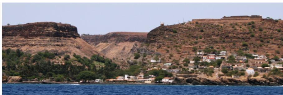
Ribeira Grande, Cabo Verde, onde se ergueu a primeira igreja cristã dos trópicos

concedia aos soberanos o direito de criar instituições religiosas, nomear os bispos e administrar os bens da igreja pelos territórios descobertos e conquistados. O Padroado (em Espanha Patronato Real ) é anterior aos primeiros esboços do tratado de Tordesilhas, anterior mesmo ao tratado de paz de Alcáçovas (assinado em 1497 no Paço dos Henriques, em Viana do Alentejo) quando os soberanos ibéricos, convencidos enfim da impossibilidade de controlar o comércio das Índias por via terrestre, se entenderam e fixaram os limites das respetivas áreas de intervenção atlântica; a primeira versão do Padroado português data de 1456, quando o papa Calisto III (o espanhol Afonso Borja), pela bula Etsi Cuncti , ratificou as decisões dos seus predecessores Nicolau V (bula Romanus Pontifex de 1455) e Eugénio IV (bula Rex Regum de 1436) que regulamentavam a atividade comercial e religiosa pela costa africana. O Padroado data pois do tempo do infante D. Henrique quando os seus navegantes, dobrado o Bojador e alcançado o Cabo Verde, chegavam com novas, maiores e melhores embarcações, as caravelas, à Serra Leoa e ao golfo da Guiné, trocando cavalos por escravos. A tecnologia da navegação deu um salto de gigante.