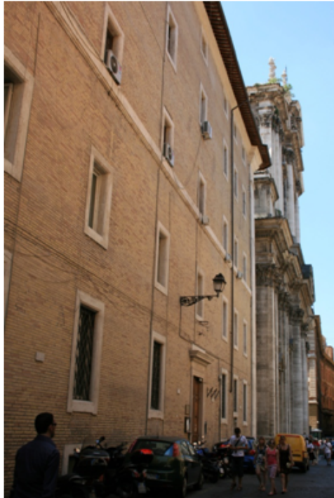
Colégio dos jesuítas em Roma, onde habitou Vieira durante quase seis anos

Daire, Isaac Aboab da Fonseca, apaixonado como Vieira pela história do futuro e pelos textos dos profetas, desde os tempos em que ambos viviam no Brasil, um em Pernambuco e o outro no Maranhão.