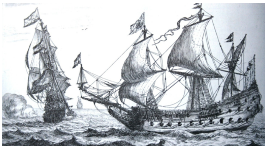
Fragatas holandesas do século XVII. Gravura holandesa da época

língua aconteceram ao mesmo tempo que ela se disseminava pelos novos espaços onde os portugueses assentavam arraiais no século de ouro da expansão marítima, comercial e cultural. Permeável às influências linguísticas e fonéticas dos povos agregados, a língua assimilou quantidade impressionante de fonemas que a enriqueceram e globalizaram, enquanto fornecia às outras línguas novas sonoridades, num intercâmbio de exotismo sustentado e duradouro, numa diluição dinâmica e interativa. Hoje, a língua portuguesa serve de pátria emotiva a centenas de milhões de cidadãos espalhados por quatro continentes. Teve mais de trinta idiomas crioulos do português (muitos extintos) por espaços continentais e arquipélagos da América, África, Índia, Malásia e China. Com a língua viajaram, nos rumos de ida e de torna-viagem, mitos e virtudes de civilizações diferenciadas, valores e desejos globais, ideias e tecnologias inovadoras partilhadas pelos povos do planeta e talvez seja essa universalidade que anuncia hoje a alvorada de um sonhado e profetizado V o Império, cujos testemunhos de pedra e cal, os que ainda estão de pé e os que resistem ao implacável desgaste do tempo e das águas, da Etiópia ao Japão, continuam a marcar o tempo e o modo da presença efêmera dos portugueses. São mensagens proféticas para quem sabe ler a história do