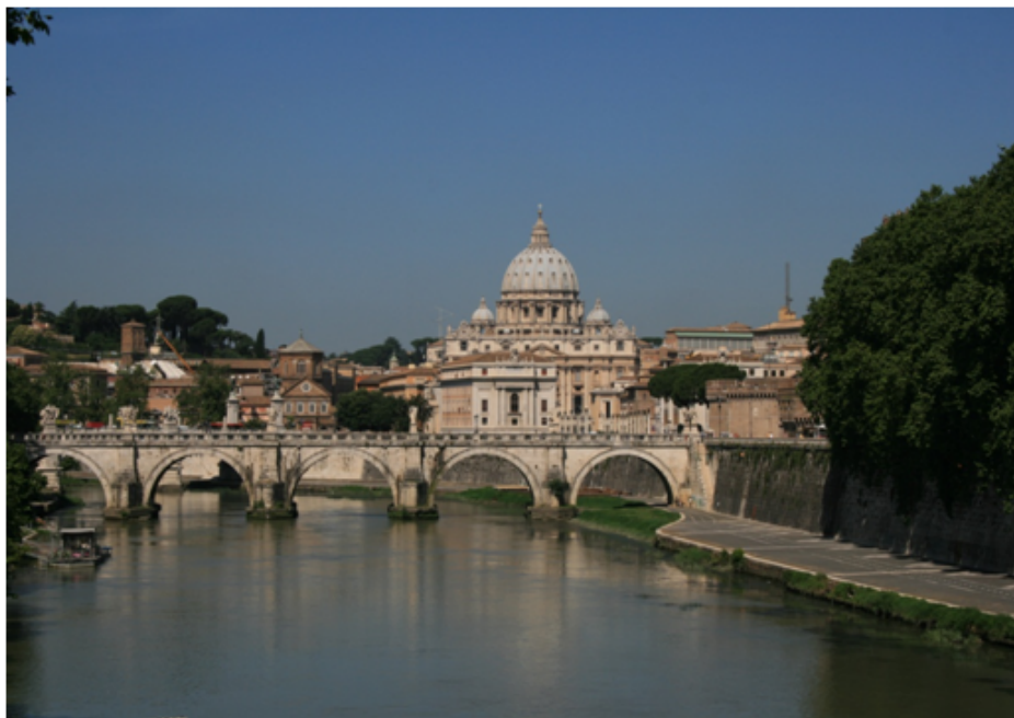
Roma, o palco dos maiores sucessos de Vieira

No mundo do seu tempo, o primeiro de todos os poderes, sobre o qual assentam todos os outros, é o do rei, o poder da coroa. Vieira insiste e o seu discurso visa a pessoa do regente D. Pedro. Mesmo que não use a coroa nem o título de rei, o regente tem o poder para permitir o retorno da gente de nação e tem agora o que seu pai nunca conseguiu, o apoio do papa para controlar o poder da Inquisição. Era intenção de D. João IV fazer justiça, mas faltaram-lhe os meios, pois os papas não o reconheciam como rei. Chegou o momento propício para modificar a imagem do país aos olhos dos outros e salvar o reino da pobreza. E dá-lhe como exemplo a coragem de Isabel, de uma mulher, como aquela outra que é exemplo de coragem em Roma, Cristina, a rainha da Suécia, uma das maiores coroas da Europa, renunciada com tanto valor e deixada com tanta glória, só por seguir a fé do Evangelho (VII, 396). Ele sempre teve muitas reservas em relação à personalidade da rainha da Suécia, a Semíramis do Norte , de quem era pregador, mas precisava de todos os argumentos, mesmo os mais