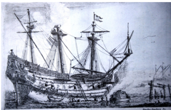
Holandeses e ingleses tornaram-se, no início do século XVII os grandes senhores dos oceanos

da igreja de Roma. A sempre virgem rainha herege sobreviveu cinco anos ao seu inimigo de estimação e faleceu em 1603. O almirante de todas as vitórias navais que causaram o pesadelo do soberano espanhol, sir Francis Drake, deixara o palco em 1596. Nunca mais os poderes ibéricos voltariam a se exibir como dantes. Na Holanda construía-se fragatas de guerra com um poder de fogo de quarenta canhões.