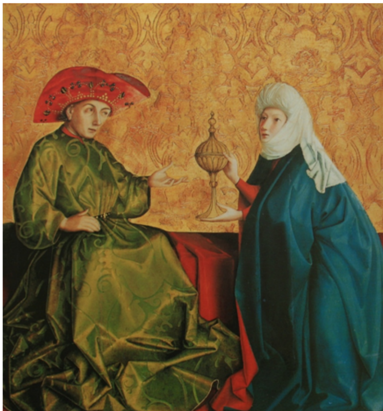
Salomão e a rainha de Sabá, Witz Konrad, século XV

do reino. O rei ofereceu-lhe os melhores dos seus cavalos e muitos outros presentes com que a rainha Balkis esteve a caravana antes de regressar ao seu trono e ao seu povo, que a aguardava nas terras do lémen. Ninguém sabe quanto tempo viveu nem quantos anos reinou, mas não importa, pois o que interessa é a grandeza dos momentos vividos e a imortalidade das paixões enquanto duram. Privilégios das rainhas!