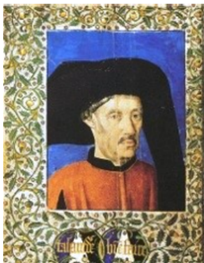
A divisa do infante D. Henrique, Talent de Bien Faire , figurava, na Crónica da Guiné, sobre um fundo de duas pirâmides brancas e um contorno de folhas e bolotas de carrasqueira

O projeto estratégico do infante D. Henrique, assumido por toda a dinastia de Avis, consistia em combater o Islão e restaurar a soberania cristã e latina sobre a Terra Santa. D. Afonso V mandou cunhar moeda, o cruzado de ouro fino , valendo 325 réis, para pagar a cruzada contra os Turcos lançada pelo papa Pio II ( Esmeraldo , livro II, prólogo, cap. 147). O inconstante D. Manuel e o visionário Albuquerque foram as personagens que mais claramente insistiram em retomar esta cruzada e torná-la uma realidade. O mundo islâmico era demasiado grande e poderoso para ser desafiado pelos portugueses, mas uma estratégia inteligente e ambiciosa poderia enfraquecer uma parte desse mundo para derrubar a hegemonia do sultão mameluco do Cairo, já afetada pelos emergentes rivais turco e persa, e permitir recuperar os lugares sagrados. Albuquerque enviou embaixadores ao jovem e promissor Xá Ismail I da Pérsia, um soberano xiita, propondo alianças contra sultões sunitas, enfraquecendo o poder islâmico da região. Como nos tempos de Ourique, algum milagre deveria recompensar a ousadia temerária dos portugueses que se propunham realizar os desígnios do próprio Cristo. Do mesmo modo que por detrás