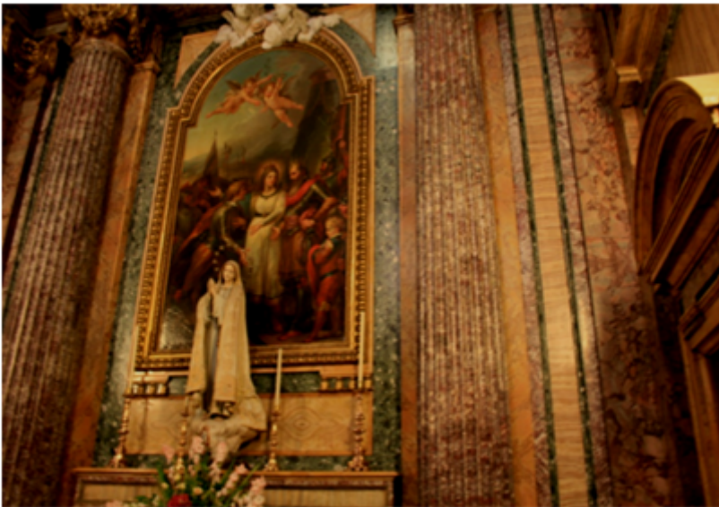
Por detrás da imagem da Senhora de Fátima, o painel da rainha intervindo entre o marido e o filho

Se excluirmos os sermões dedicados a Nossa Senhora, os do Rosário e os de outras invocações, Vieira dedicou apenas sete sermões a exemplos femininos da santidade: dois a Santa Catarina (um em Lisboa e outro em Coimbra), dois a Santa Teresa (um em Lisboa e outro no colégio de Ponta Delgada), um a Santa Isabel (em Roma), a Santa Iria (em Santarém) e a Santa Bárbara (em Salvador). Os exemplos masculinos inspiraram mais o pregador que lhes dedicou pelo menos vinte e cinco sermões. Parece que (Isabel) não havia de ser mulher, porque o negociar é ofício de homem (...) Mas não é isto o que responde Salomão: diz que a mulher forte, a mulher varonil, a mulher mais que mulher, era uma mulher negociante (VII, 391).