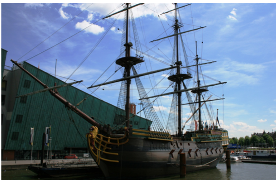
Réplica de uma fragata holandesa do século XVII