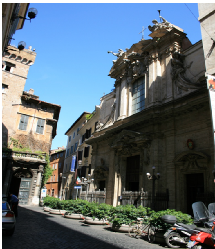
Fachada da igreja de Santo António dos Portugueses em Roma

O templo atual foi reconstruído por fases entre 1638 e 1695. Quando Vieira pregou, já aquela capela do transepto, no lado direito, estava dedicada à Rainha Santa, mas o painel que ilustrava o fundo do altar não era o que lá se encontra hoje; tinha outro, que representava o milagre das rosas. O painel atual representa a rainha como mediadora de paz entre o rei seu marido e o filho D. Afonso e foi pintado em 1801. Na segunda metade do século passado acrescentaram à iconografia do altar uma imagem de Nossa Senhora de Fátima em primeiro plano, mais adequada à nova devoção popular portuguesa e símbolo da maior exportação cultural do país. No tecto da igreja encontra-se um grande painel re-