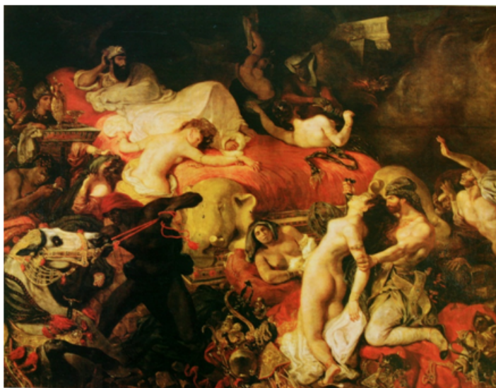
A Morte de Sardanápalo, por Eugène Delacroix

numa semi-penumbra, saboreia os últimos momentos das suas mulheres, dos seus cavalos, da sua vida. Pela janela do fundo já se vêem claramente os invasores que devastam a cidade. Privilégio real, o de lidar com a morte como se desfruta o mais secreto dos prazeres. A cidade marroquina de Agmat tem o túmulo de um rei que há quase mil anos é local de romaria. Nasceu em Beja, governou Silves e sucedeu ao pai como rei de Sevilha; Al-Mutamid foi um dos maiores poetas da língua árabe. Um dia ele passeava com um outro poeta pela margem do rio Guadalquivir e lançou um mote para que o amigo replicasse ao versejar, como fazem os repentistas. O amigo hesitou, atrapalhou-se, mas pela outra margem do rio passava a escrava cristã de um moleiro, guiando as mulas, que respondeu ao desafio. Encantado, o rei comprou-a e fez dela a esposa preferida, com a qual viveu um dos mais bonitos romances de amor da gesta antiga das nossas gentes. Os reis ganham batalhas e sofrem revezes; Al-Mutamid, mais dado à poesia do que à guerra, foi derrotado por inimigos de religião vindos de África, que o levaram cativo. A esposa e duas filhas viveram ao lado dele, tecendo e fiando, para aliviar as penas do cativo, até ao último dos seus dias. Partilham para sempre o mesmo chão. O que não faz uma mulher para partilhar o destino de um rei!