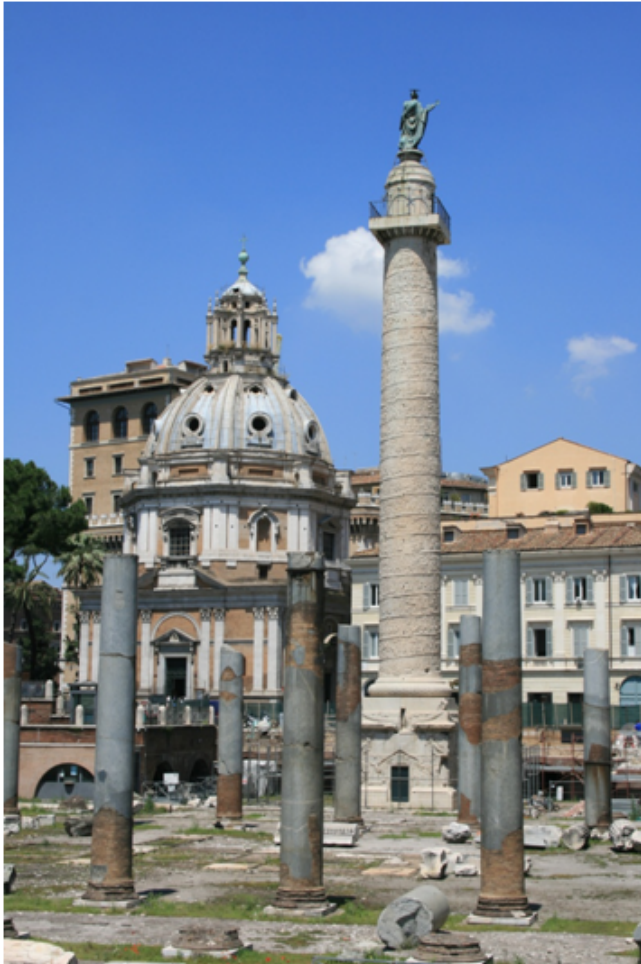
No coração de Roma, a coluna de Trajano, imperador originário da Hispânia

No reino, a pobreza e a má administração provocavam perturbações que fragilizavam ainda mais o poder real. No ano de 1673 uma conspiração tentou devolver o trono a D. Afonso VI, que estava preso em Angra, nos Açores. A tentativa falhou e o rei foi transferido para Sintra em Outubro do ano seguinte (D. Pedro só assumiria o título de rei depois da morte do irmão, em 1683); não deixa de lembrar aos correspondentes a profecia dos trinta e dois anos e meio do Bandarra que se podiam aplicar