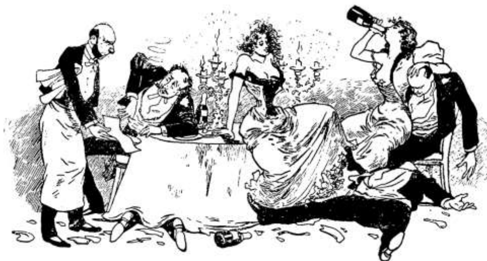
“Havia obra para todo o preço.”

Os preços constituem outra variável de estratificação a considerar. As variedades distinguiam-se pelo custo e, como dizia F. Schwalbach, havia «obra para todo o preço» 225 : desde o antigo amor de seis vinténs ou de lepes das vielas de Alfama e Mouraria, até ao de coroa dos primeiros andares da Travessa da Palha. Naturalmente, nas covas escuras das vielas da Mouraria os preços tabelados eram paliativos e o freguês – saloio ou provinciano – na ânsia de ser atendido, arriscava-se a sair sem dinheiro ou carteira. Elas próprias, beneméritas, ajudavam-no a despír o casaco que dependuravam num cabide junto de uma porta que dava para outra casa. Essa porta tinha um pequeno postigo que ficava à altura das algibeiras do casaco e que era aberta depois de um sinal convencionado de forma a que o cúmplice pudesse tranquilamente surripiar a carteira e esquadrinhar à vontade o que nela houvesse 226 .