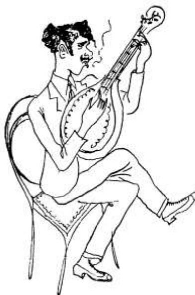
A banza*, a pouco a pouco, subia na escala social lisbonense.

Do marialvismo fadistola passamos à aristocratização do fado, à medida que avançamos para finais do século XIX. O fado aristocratiza-se, aperalta-se, deixando de ser apenas cantado nas baiucas, vielas e hospedarias – o que, segundo Tinop 106 , aconteceu a partir de 1868 ou 1869, precisamente uma data charneira na história do liberalismo português. Pinto de Carvalho (Tinop) distingue duas fases na evolução do fado: numa primeira, a fase «popular e espontânea», o fado era executado nas baiucas onde os fadistas derramavam o «vinagre das suas vozes», nas vielas e nas casas de «hospedaria fácil», «onde os viajeros e os fervorosos das Vénus fraldiqueiras [achavam], aqueles, um abrigo, e, estes, um altar» 107 . Numa segunda fase, «aristocrática e literária», o fado era executado nas «salas e praias da moda» 108 . Pinto de Carvalho fixa o fim da primeira fase e o princípio da segunda entre 1868 e 1869, num período em que, como afirma o Manuel Villarverde Cabral, se esboça «a separação social dos operários relativamente ao “povo” que se mobiliza durante os motins fiscais de 1868, e a separação política do proletariado relativamente à esquerda tradicional, inclusive sob a sua nova face republicana» 109 .