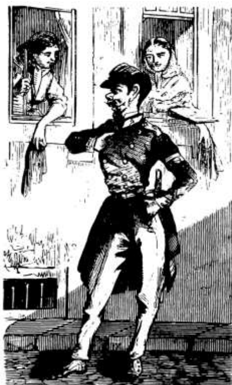
Os soldados da guarda municipal eram verdadeiros conquistadores, avassalavam e reduziam a escravos “milhares de corações” de todas as amas, criadas

é o que ninguém poderá devidamente explicar; mas, criada que uma vez lhe fala fica a quebrar a loiça por mais d'um semestre 192 .» Sousa Basto, mais resignado, limitava-se a constatar: «Como mulheres, as amas-de-leite e as criadas de servir têm sempre dado a vida pela farda. Foram os municipais os seus primeiros amores. Se iam passear os filhos da casa, levavam sempre guarda de honra . Se saíam sós, imediatamente lhes surgia um municipal para as acompanhar [...]. Se a patroa [...] desconfiava de que a sopeira metera alguém em casa, ia passar revista ao armário da cozinha ou debaixo da cama, e lá encontrava infalivelmente um municipal 193 .» Com efeito, «o primeiro cuidado dos soldados da guarda municipal era arranjar namoro de vizinha, que lhes proporcionasse colóquio nocturno e lhes fizesse passar agradavelmente os quartos da sentinela da noite. As belas mostravam-se grandemente sensíveis a essas atenções» 194 , ainda que mudassem de namorado «à proporção que a sentinela era rendida» 195 .