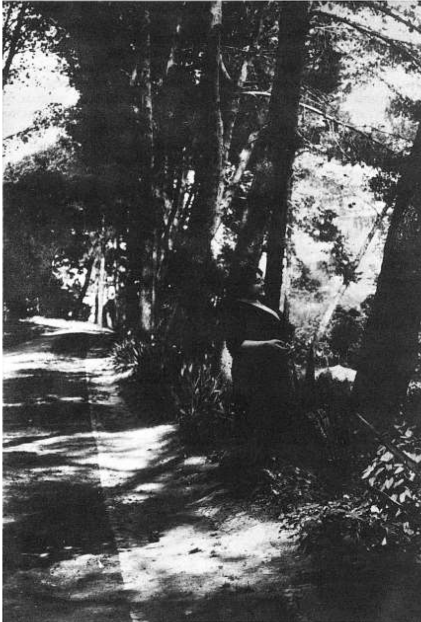
Com o aumento de tráfico e das vias de comunicação as “nómadas” tornam-se as passageiras certas e pontuais dos camionistas.