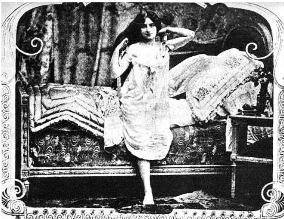
Em inícios do século XX desenvolve-se uma nova procura sexual e a proliferação de protegidas*, geralmente bem pagas e com casa posta.

Como sustenta Alain Corbin 273 , o pequeno burguês idealiza a relação com a prostituta segundo o modelo conjugal: se é casado sonha com uma união «paralela»; se é solteiro, com uma união «substitutiva». Esta situação explica a proliferação de protegidas* , geralmente bem pagas e com casa posta. Desenvolve-se, assim, uma nova procura em matéria de prostituição – modificação de natureza mais qualitativa do que quantitativa.