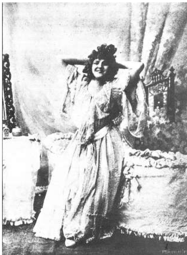
As casas chics eram frequentadas, preferencialmente, pelas cocottes *.

Estas casas chics eram frequentadas, preferencialmente, pelas cocottes *. A cocotte assumia-se, em finais do século XIX, como a garantia de meia moral pública e algumas tinham «casa posta» . Eça de Queirós conta, na sua Relíquia , como Eleutério Serra, da firma Serra Brito & C. a , com loja de fazendas e modas à Conceição Velha, conseguiu alugar para Adélia, sua protegida *, uma casa na rua da Madalena, junto ao largo do Caldas. Cocottes como Adélia garantiam a discrição que calhava a um comerciante com crédito seguro na praça de Lisboa. Por ali não havia correrias da Municipal nem da Polícia e os aqui-del-rei só se faziam ouvir para além do Poço do Borratém.