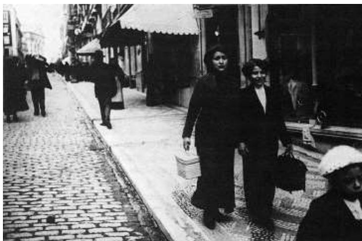
Costureiras: centros de Marias, Adelaides e Sãozinhas trocavam a agulha de costura pelo ócio melancólico do bordel.

Por estas e outras é que um bem-intencionado moralista de finais do século XIX suplicava enternecidamente junto dos governos civis e comissariados da polícia: «Por amor de Deus e do próximo, ensinem aos que se dedicam a essa vida, quais são os seus direitos e deveres 166 .» Segundo este moralizador de costumes sopeirais, a criada de servir deixaria de ser um «factor importante para a prostituição» a partir do momento em que se fixassem bem «quais as relações sociais que criadas e patrões [deveriam ter] uns para com os outros» 167 . Pelos vistos, esse tipo ideal de relacionamento estava tão mal assimilado – aos olhos do senso comum, mais por culpa das criadas do que dos patrões – que os poderes públicos determinaram que a Associação dos Asilos se encarregasse da educação de costureiras e criadas de servir.