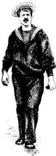
Os marinheiros frecheiros, valentões blasonadores, participavam activamente na boémia lisboeta.

de um para outro lado da rua, depois de lhes perguntarem solícitos: «Quer passar?» 53