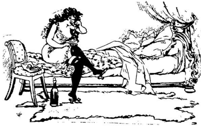
Nas camadas mais baixas da prostituição era frequente o abuso de bebidas alcoólicas.

Encontram-se ainda outros aspectos comportamentais que são o espelho do seu modo de vida. Por exemplo, a adopção frequente de nomes de guerra que adoptam e mudam para se distinguirem de outras meretrizes do mesmo nome ou para fugir a investigações de família, poder judicial, etc. Vejamos uma interessante e atenta descrição fisionómica feita por Alfredo Gallis, em 1909: «A Gorda Esperança, de cara abolachada e vermelha, baixa e de seios tremendos [...] verdadeiro tipo de provinciana rude; a Rita bonita muito cheia de cordões de ouro [...] a algarvia de rosto suíno, mas [...] de umas pernas magníficas [...]; a Adelaide veterana , irónica [...] e dando lições de filosofia às mais novas; a Maria d'Almeida e a Elvira Zuca , altas, petulantes, batidas por uma longa prática do fado triste[...]; a Laura de Setúbal [... com o] eterno casaco encarnado; a Zefa [...] zaragateira [...]; a pálida e filosófica Aurélia [...]; a Sarah grande , cega do olho direito [...]; a Alice , muito magra [e] desdentada [...]; a Amélia de Coimbra [...já reformada e pedindo] esmola aos antigos fregueses que a conheceram cheia de vida [...]; a celebrizada Lúcia, a heroína da localidade, que de quando em vez alarmava o bairro quando o amante, um sargento da armada, roído de ciúmes, lhe arrombava a porta [...]; a Augusta alta [...], desdentada como a Alice [...]; a Albertina, já de idade madura mas ainda formosa [...]; e, sempre de lenço e xale a Antónia, pedindo um vintém ou um cigarro 207 .»