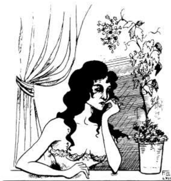
A partir do momento em que a mulher virtuosa conquista o direito de estar á janela e passear-se pela rua desencadeia-se uma caça à prostituta.

De facto, a partir do momento em que a mulher «virtuosa» deixa de estar fechada, em casa, de preferência com a «perna quebrada», e conquista o direito de estar à janela e passear-se pela rua desencadeia-se uma caça à prostituta com o evidente objectivo de a deslocar da vida pública . Neste campo, as disposições legislativas perseguiram um duplo objectivo: isolar as prostitutas e, nesse isolamento, tolerá-las. É que para o mundo burguês as prostitutas acabavam por garantir a castidade e o «bom porte» das restantes. Por conseguinte, do ponto de vista dos poderes instituídos, a prostituição tinha de ser assumida e adequadamente integrada nas estruturas vigentes. Isso não significava, de modo algum, plena liberdade de expressão para as prostitutas. Os estragos físicos e morais causados pela prostituição tornavam necessário o controlo desse fenómeno no duplo sentido do seu desenvolvimento numérico e da sua distribuição físico-social.