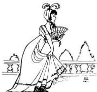
Uma elegante pavoneando-se no Passeio Público.

Em vão as classes dominantes reclamavam o direito à honra e à reputação, já que o prazer às ocultas era em parte possível e fomentado por efeito dos tabus culturais, da moralidade pública, das leis e costumes religiosos, dos usos e «virtudes» da sociedade de então. No século XIX, as possibilidades de diversão e de alcançar o prazer por vias extraconjugais eram tão excitantes que de pouco valia a propaganda feita no sentido de encomiar as delícias do estado matrimonial. Daí a proliferação da prostituição clandestina «coberta com o manto da honestidade do segredo». Acresce que a vida pública lisboeta tinha, ainda no século XIX, uma ascendência sobre a vida privada. As avenidas eram adaptadas com o propósito específico de favorecerem os passeios como forma de relaxamento. O século XIX foi uma época em que os cafés e as tabernas se transformaram em centros de convivência social. Nos círculos mais boémios, moços de fretes, marinheiros, carrejões* e malteses de cacete* , burgueses atrevidos e marialvas, todos procuravam as dolências de uma guitarra à boca de uma taberna e a companhia amiga da prostituta e da fadistagem do sítio. Nesses lugares suspeitos e pungentes, onde as cantigas dos bandurilhas* com as suas trepidações brejeiras faziam esfervilhar as saias engomadas das moçoilas e os fadistas velhacazes se requebravam nas gaifonas do fado batido, a moral dos viandantes pacíficos arriscava converter-se a essa revoada de escrupulosos estroinas* .