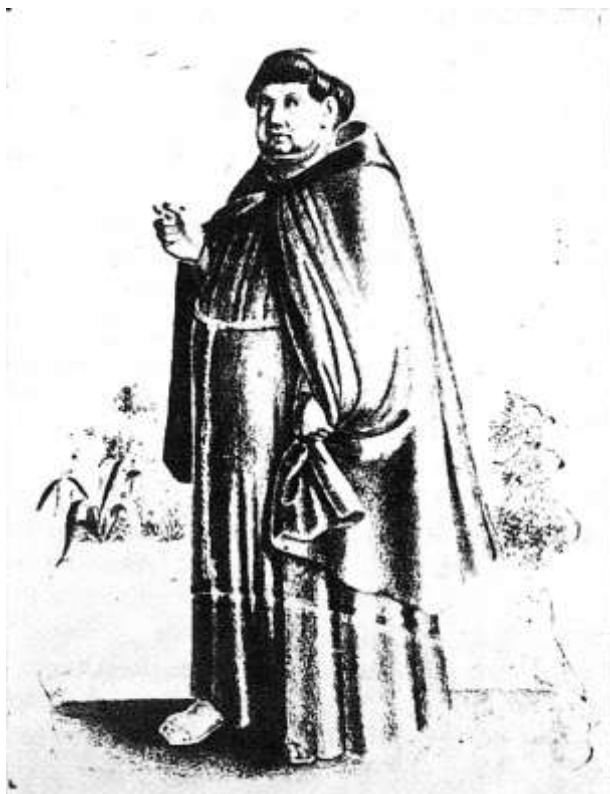
Alguns acusavam os “abutres de sotaina e coroa” do roubo das “grinaldas de virgem”.

virgens e prostituidor de mulheres casadas no confessionário da Igreja de Sacramento de Lisboa 177 .