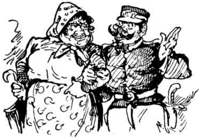
Os amores de sopeira por fartos e cuidados bigodes.

lodo e da miséria 186 .» Método radical, sem dúvida, mas de aplicação duvidosa para quem, como no Congresso Abolicionista de 1926, se batia por «abrigar nas almas a ideia de que a virgindade masculina possui valor biológico e social igual ou superior à virgindade feminina» 187 . Em 1926, lia-se num relatório do Governo português enviado à Sociedade das Nações: «Se nos cingirmos à letra do art. 406.º do Código Penal, haveria lugar para perseguir as próprias autoridades 188 .» Em plena Ditadura Militar (1929), o comandante da polícia, Ferreira do Amaral, concluía: «A prostituição não é um crime é uma desgraça 189 .»