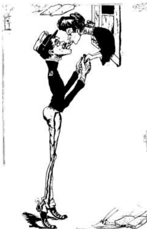
Municipais e civis punham de lado a ordem pública para só pensarem na conquista das sopeiras.

«Namorar as sopeirinhas, Finfar partes carregadas, São da polícia civil As prendas mais afamadas 196 .»