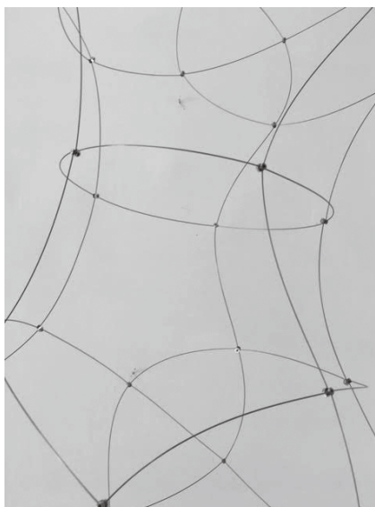
Figura 6 · Gorafe: Atrapavientos , 2016. Colección del artista.