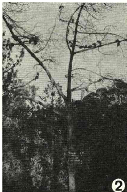
Fots. 1 e 2 — Aspectos de pinheiros mortos no Estoril