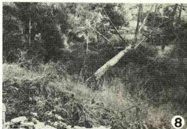
Fot. 8 — Pinheiro morto deixado no terreno