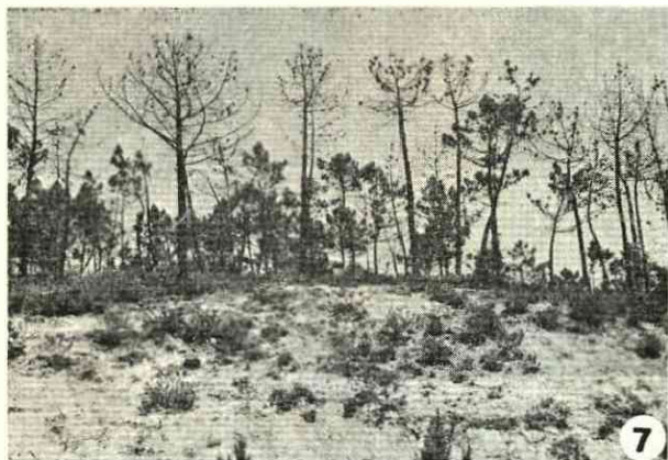
Fot. 7 — Aspecto dos estragos causados pelo fogo num pinhal do Estoril