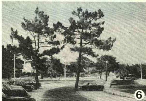
Fots. 5 e 6 — Aspectos de pinheiros num parque de estacionamento asfaltado onde não foram deixadas caldeiras para as árvores. Nota-se o asfalto aderente à casca dos pinheiros