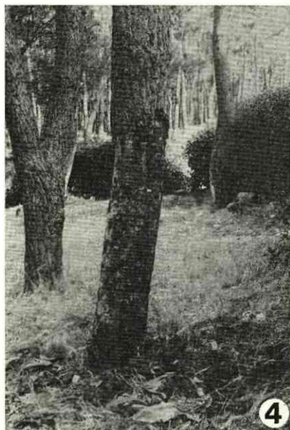
Fots. 3 e 4 — Pinheiros mortos mostrando sinais de ataque de «hilésina»: nódulos de resina (3) e galerias subcorticais (4)