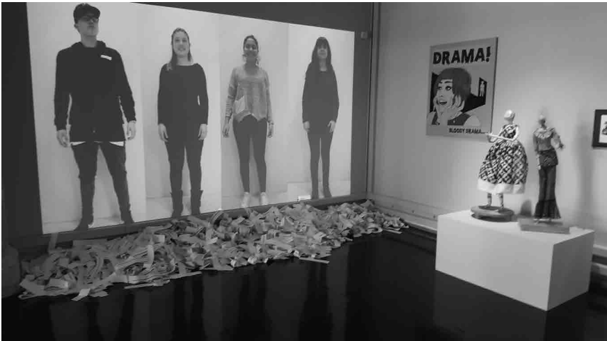
Figura 5 · Imagen de la representación teatral y performance artístico musical que preparó el alumnado del Institut Josep de Ribera de Xàtiva (Valencia, España) durante la celebración del proyecto Second Round .