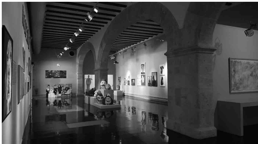
Figura 7 - Panorámica de la exposición del proyecto Second Round en el Centre Cultural La Nau de la Universitat de València.