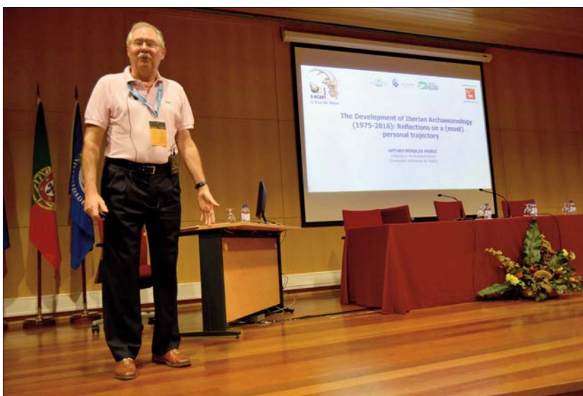
FIG. 4 – Apresentação inaugural do 5RCAPI por Arturo Morales Muñoz.

A 5RCAPI começou no dia 28 de abril, na continuação do Ezi2017. A conferência de Arturo Morales Muñoz estabeleceu a ligação entre os dois eventos, funcionando como encerramento do Ezi2017 e abertura da 5RCAPI. Com o título “The development of iberian archaeology (1975-2016): reflections of a personal experience”, apresentou uma conferência sobre a perspetiva histórica (e pessoal) do desenvolvimento da Zooarqueologia na Península Ibérica.