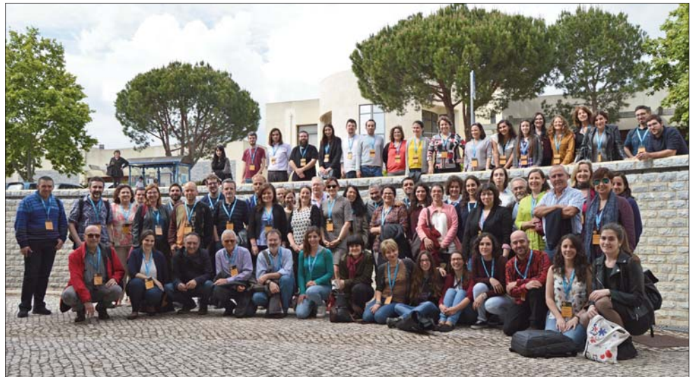
FIG. 3 – Fotografia de grupo no final do Ezi2017, 28 de Abril de 2017.

Espanha, nomeadamente do País Basco, Cantábria e Aragão. Incluiu uma interessante referência aos motivos de animais nas pinturas de Altamira (Cantábria) e a sua comparação com dados zooarqueológicos, feita por P. Castaños e colegas.