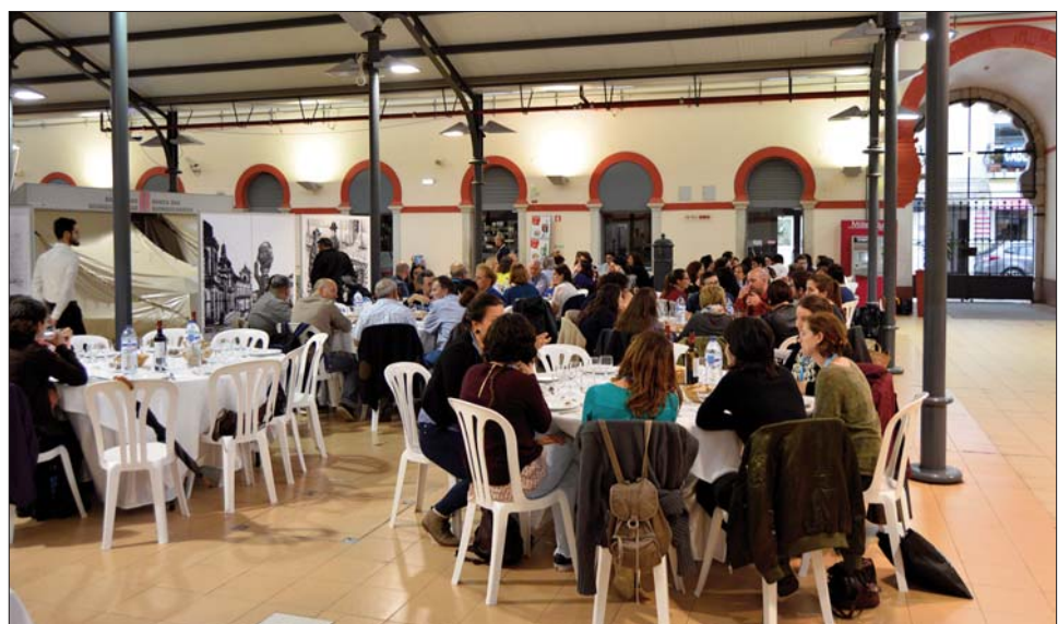
FIG. 6 – Vista geral do jantar oficial do EZI2017 e da 5RCAPI, no dia 28 de Abril, no Mercado Municipal de Loulé.

O livro de resumos está disponível em https://www.academia.edu/32415085/Book_of_Abstracts_EZI2017_and_5RCAPI . 📖