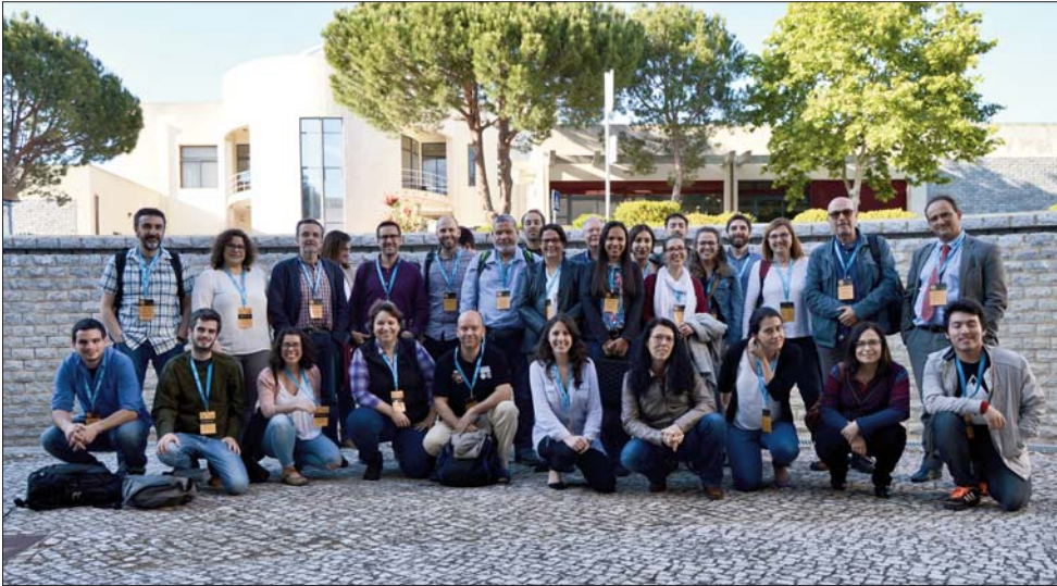
FIG. 5 – Fotografia de grupo da 5RCAPI, 29 de Abril de 2017.

A primeira sessão de comunicações inscritas na 5RCAPI dedicou-se, exclusivamente, ao estudo de restos arqueofaunísticos de várias espécies de mexilhões. A individualização deste tema demonstra bem a importância que estes animais têm na dieta ao longo da história humana, mas também como funcionam como indicadores de alterações paleoambientais.