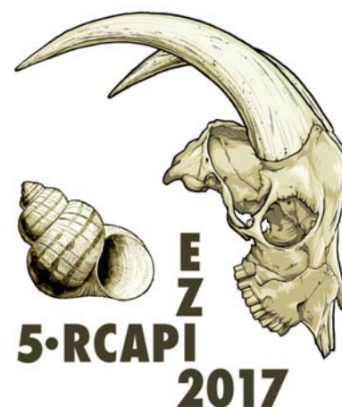
FIG. 1 – Logótipo conjunto do Ezi2017 e da 5RCAPI.

O Ezi2017 resultou do crescente desenvolvimento da Zooarqueologia nas instituições espanholas e portuguesas, o que se traduziu numa grande participação de jovens investigadores de várias nacionalidades. Tal revelou, por um lado, a vivacidade da investigação nesta disciplina nas academias ibéricas e, por outro, a capacidade de captação de investigadores de outras regiões exteriores à Península Ibérica. Os investigadores pre-