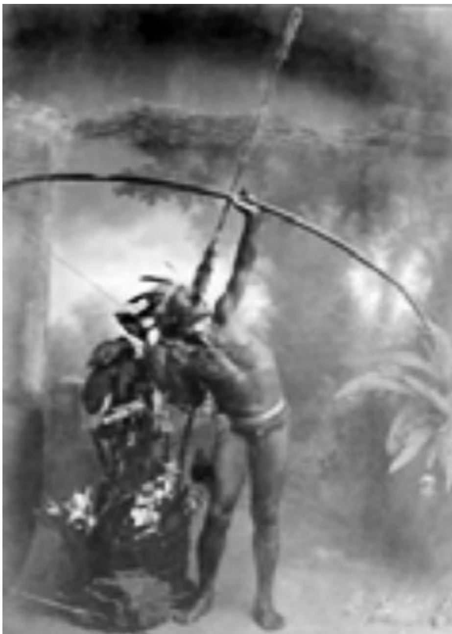
Anexo 8. Arqueiro Xokleng utilizando um arco longo.