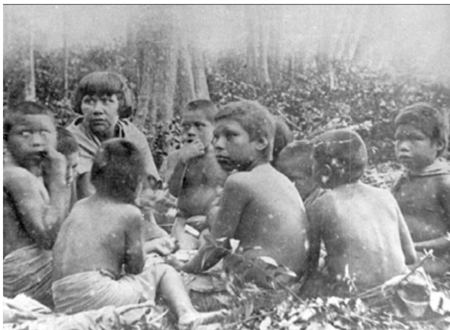
Anexo 5. Vítimas de bugreiros.