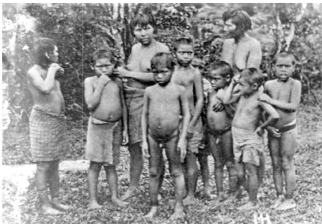
Anexo 6. Vítimas de bugreiros II. Fonte. Coelho dos Santos, 1997, pp. 36 e 37.