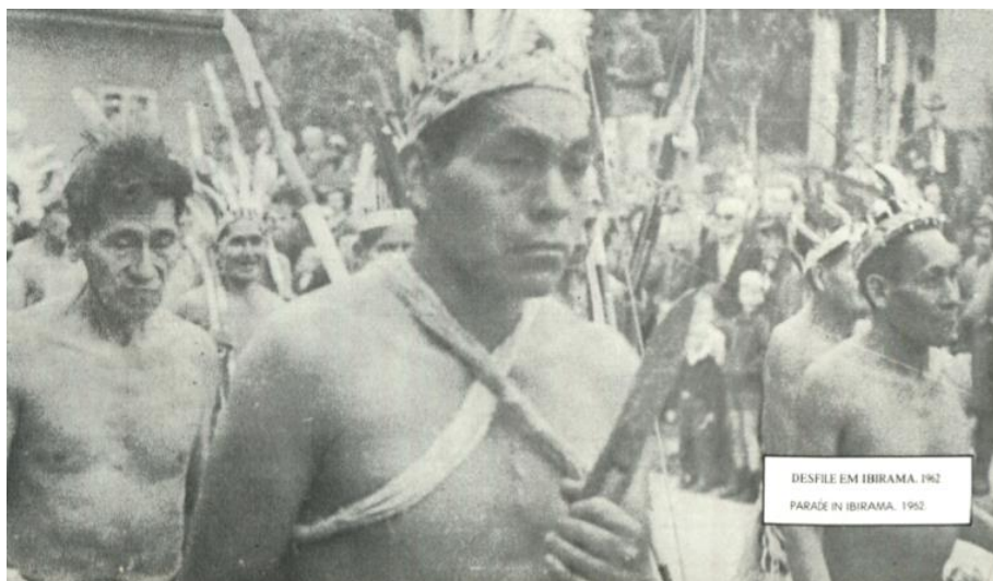
Anexo 2. Desfile em Ibirama, 1962.