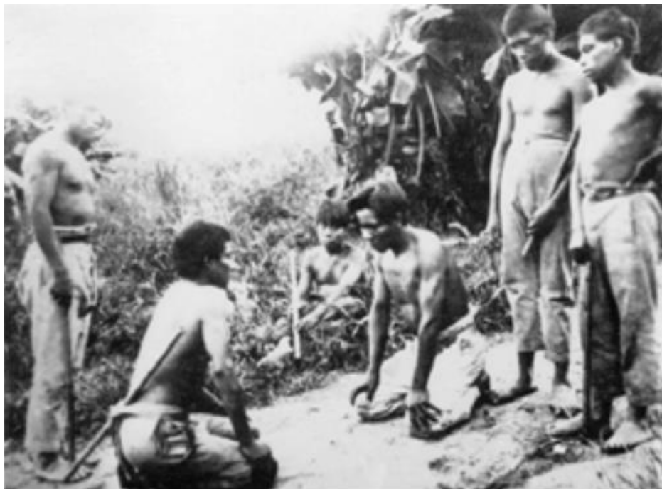
Anexo 4. Índios fazem disputa simulada.