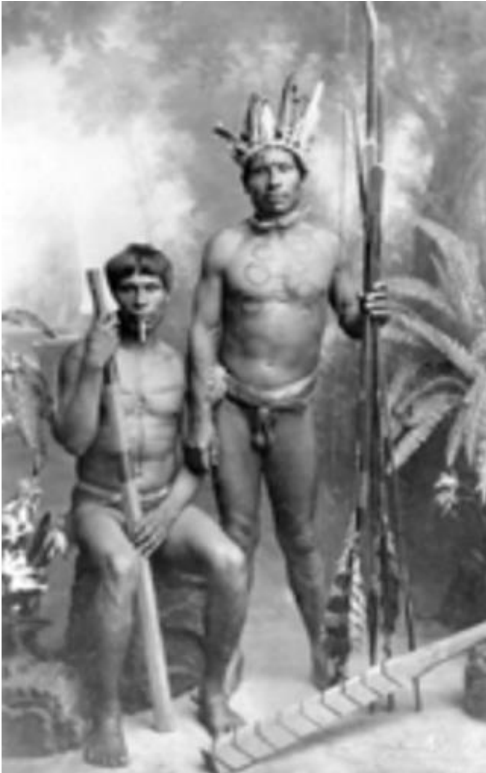
Anexo 7. Guerreiros Xokleng e suas armas. Foto de José Rohland.

Fonte. Arquivo Histórico José Ferreira da Silva, da Fundação Cultural de Blumenau.