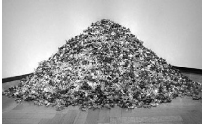
Figura 6 Felix González Torres, Lover Boys , 1991

montaña de caramelos que son la suma de los pesos de dos cuerpos, el cuerpo del artista y el cuerpo de su amante (Spector, 2008). De esta manera, Felix Gonzalez-Torres, optaba por hablar de la muerte de manera dulce una opción que en ningún caso tenía algo que ver con el veneno.