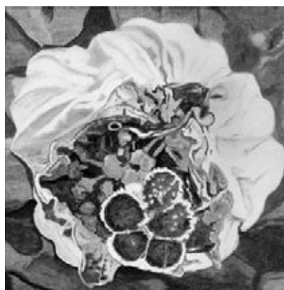
Figura 1 Acónit Blau o Tora Blava , coloquialmente conocida como "la matallops" (la matalobos).