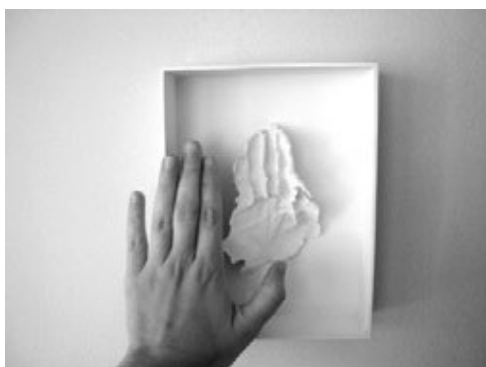
Figuras 1 e 2 Em cima: Leve-me. Alginato sobre caixa branca, 20 × 15cm. Carolina Rochefort, 2009/2010. Em baixo: Leve-me. Alginato sobre caixa branca, 20 × 15cm Carolina Rochefort, 2009/2010.

Desse modo não existe um objeto final como resultado de uma prática é a prática como um todo que aponta para o sentido latente de transformação. O cenário de apresentação do trabalho se modifica ao pensarmos que é o registro da existência dele em meio a casa, a habitação que o faz existir e ter sentido. O espaço da galeria dá lugar às habitações, aos relatos de sua existência.