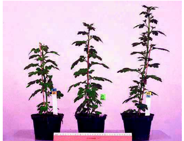
Figura 1 - Efeito da amplitude térmica diária [temperatura diurna (TD) – temperatura noturna (TN)] no comprimento dos entrenós (A) e no comprimento do caule (B) em crisântemo de corte. Os símbolos representam 16 combinações de temperaturas diurnas e noturnas, com uma temperatura diurna de: ○ 16°C; □ 20°C; ● 24°C; ■ 28°C. Fig. 1 B (da esquerda para a direita): 16°C TD/ 24°C TN (-8 DIF); 20°C TD/ 20°C TN (0 DIF); e 24°C TD/ 16°C TN (+8 DIF). Adaptado de: Carvalho et al. (2002).