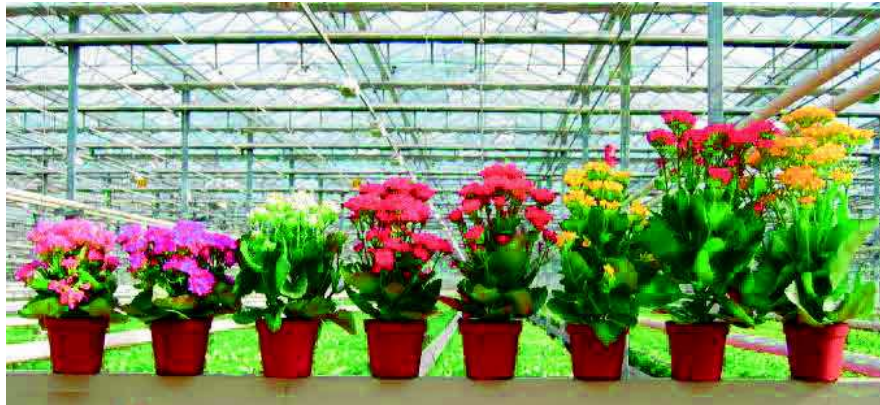
Figura 2 - Elevada variação genotípica na altura das plantas em oito cultivares de Kalanchoe blossfeldiana produzidas nas mesmas condições de crescimento, em vasos de 10,5 cm e sem aplicação de reguladores de crescimento (da esquerda para a direita: ‘Delia’, ‘Pandora’, ‘Mie’, ‘Debbie’, ‘Anatole’, ‘Alejandra’, ‘Tenorio’ e ‘Toleda’). Altura da planta variou de 10,2 cm ‘Delia’ até 25,6 cm ‘Toleda’.