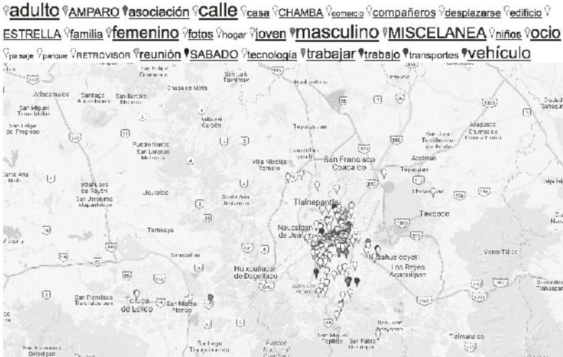
Figura 3 · Antoni Abat, megafone.net: sitio*TAXI – México DF (2004). Imagen de los taxistas de DF participantes en el proyecto sitio*TAXI.