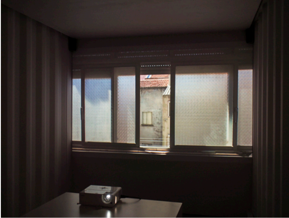
Figura 3 Imagem da instalação na Galeria das Belas-Artes (vídeo Janelas)