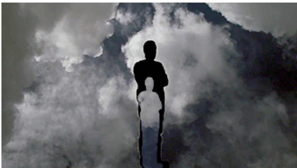
Figura 1 exemplo de relação público-projeção no vídeo do céu

São projetados em duas paredes frente a frente. O vídeo do céu tem uma área de projeção ligeiramente superior à da parede de projeção, ocupando um pouco do teto, chão, e paredes perpendiculares. Os vídeos da janela têm uma área mínima de 1,20m por 1,80m. O espaço entre os vídeos não deverá ter menos de 6m.