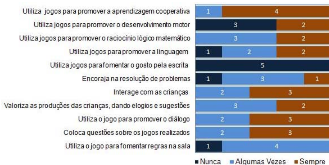
Figura 1: Estratégias utilizadas pela educadora da MT

Na Figura 1 estão assinalados os registos observados nos itens seleccionados para verificar a frequência com que a educadora recorre às diferentes estratégias, nas actividades dinamizadas, no âmbito do jogo.