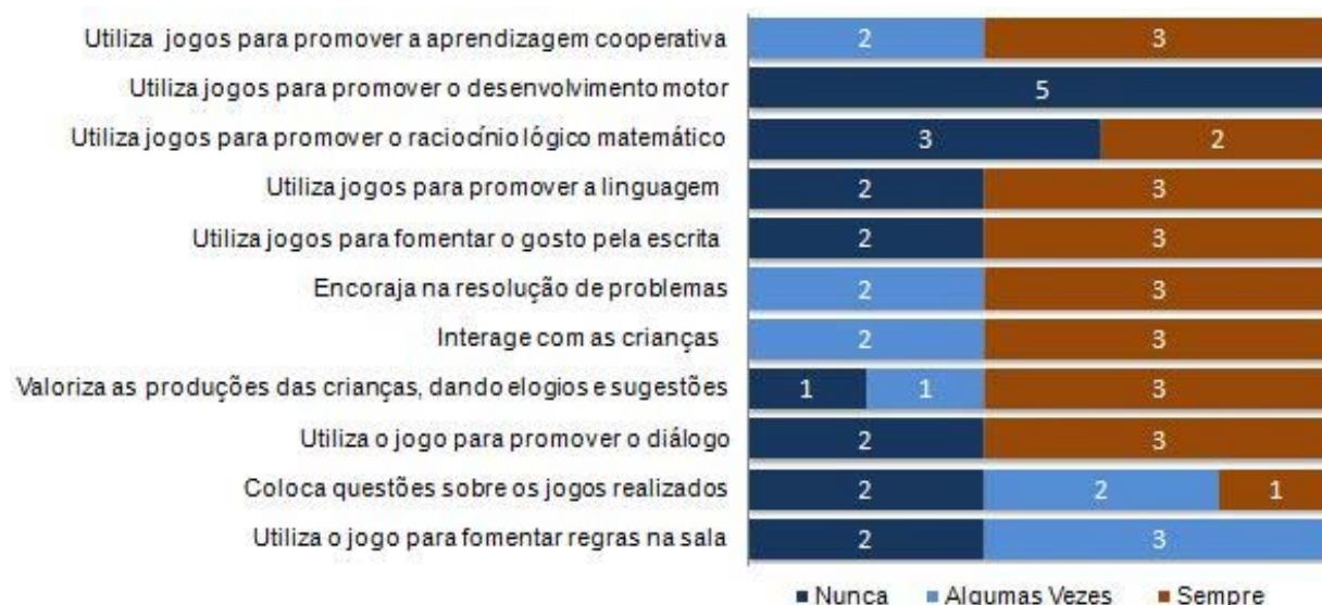
Figura 2: Estratégias utilizadas pela educadora do MEM

Na Figura 2 estão assinalados os registos observados nos itens seleccionados para verificar a frequência com que a educadora recorre às diferentes estratégias, nas actividades dinamizadas, no âmbito do jogo.