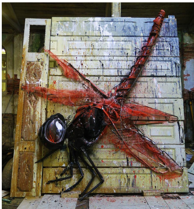
Figura 39 “Libelinha”, peça exposta no armazém de trabalho de Bordalo II, com 3 metros de altura e 3 metros de comprimento