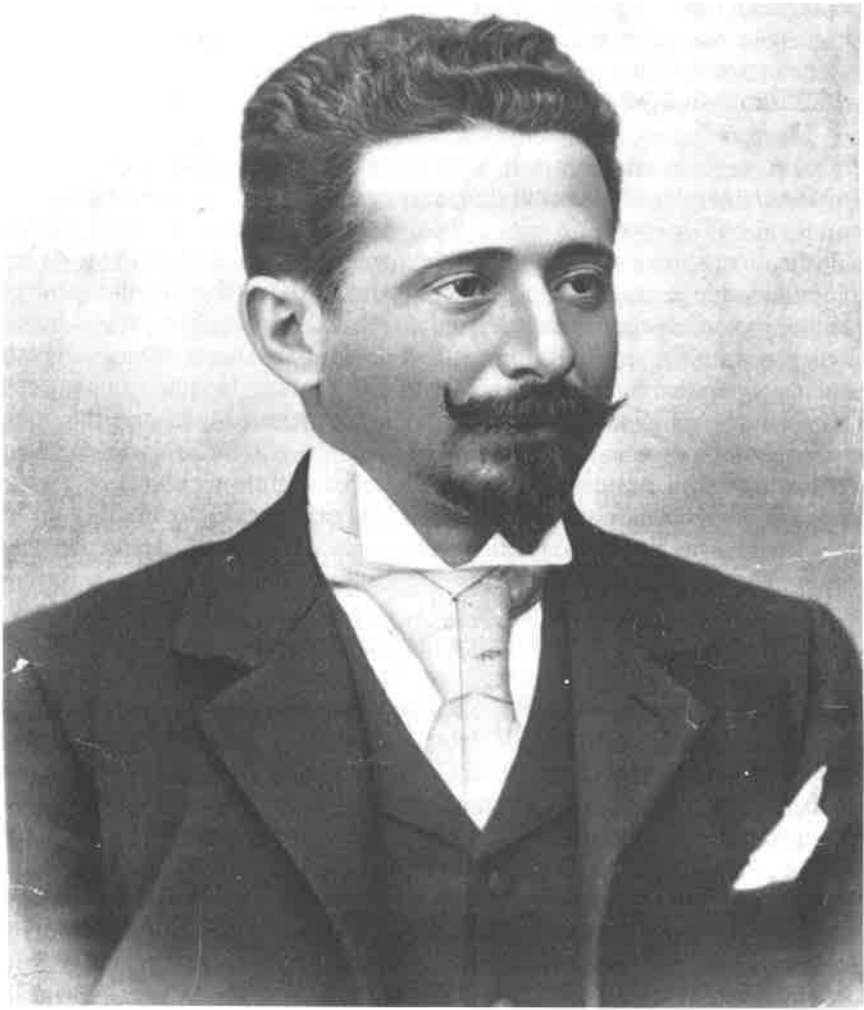
Dr. Afonso Costa, ministro da justiça. Fotografia publicada na capa da Ilustração Portuguesa de 21-X-1910.

do novo regime, a começar pelo primeiro, o do Governo provisório, de Outubro de 1910 a Setembro do ano seguinte, sendo ali o homem basilar nas reformas, sobretudo na invenção da implacável máquina de guerra montada contra a Igreja, sendo seu escopo confesso o de acabar com o Catolicismo em duas gerações, como triunfalmente o anunciou, em vésperas de proclamar "a Basilar" – assim era designada a lei de separação de 20 de Abril de 1911 –, numa reunião maçónica (e já agora note-se que o seu nome maçónico era de "irmão Platão", o que dá bem a sua imodéstia ou a sua falta de sentido das