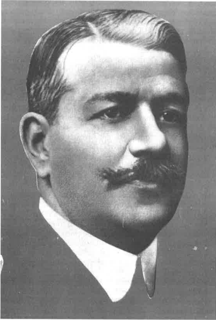
João Chagas – Presidente do Conselho de Ministros da República Portuguesa ", fotografia publicada na capa da Ilustração Portuguesa de 11-IX-1911.