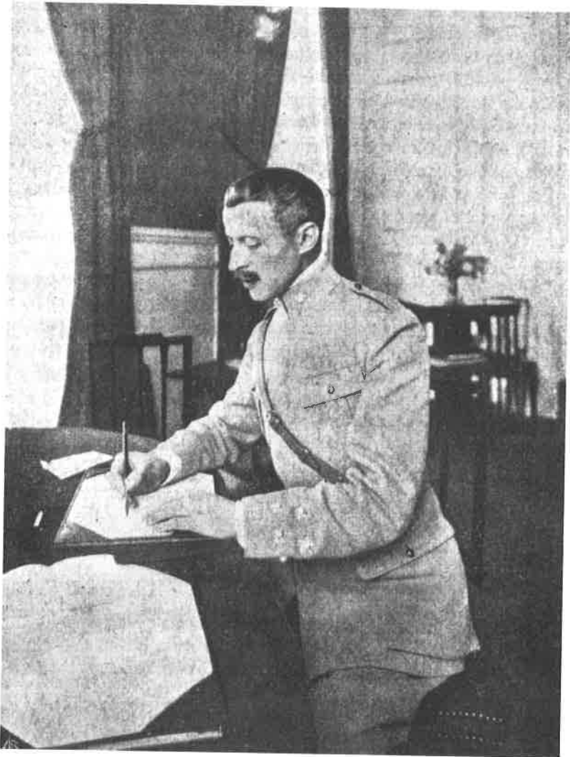
"Dr. Sidónio Paes – Illustre Presidente da Republica, libertador da Patria Portuguesa". Legenda de um postal da época (1918?). Dimensões reais: 14x9,5cm.

altura, que ele tornaria "feito qualquer outro". É cómodo, nesta perspectiva histórica, ver em Sidónio (e no Sidonismo) um óbvio precursor de Salazar (e do Estado Novo, que de algum modo, até numa forma republicana, prolongava o nacionalismo republicano conservador da "República Nova"). Mas semelhante constatação exigiria, para não lhe ficar por uma evidência banal, que sublinhássemos, por exemplo, a especificidade do tipo ditatorial encarnado pelo major e ditador minhoto, tão diferente em tudo e até no estilo