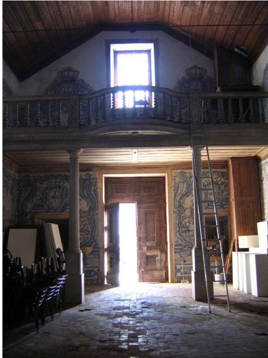
Fig. 252 - Vista para o coro alto

O caso da igreja de Alhos Vedros é o único em que os painéis com obras de misericórdia apenas surgem no coro alto, ao qual se acede através das escadas que se situam já no edifício do hospital que lhe é contíguo, mas que comunicam com a nave pela porta lateral do lado do Evangelho. A primeira obra encontra-se na parede da nave do lado da Epístola, distribuindo-se as restantes na fachada do templo, contornando o janelão, e a última, do lado oposto. Segue a ordem que se observa nas fontes escritas, comuns a outras igrejas, embora a junção entre o Curar os enfermos e o Visitar os presos deva ser entendida com alguma reserva: no Memorial dos Pecados , de Garcia de Resende, com data de 1521; obra de um anónimo franciscano intitulada Manual de Confessores e Penitentes , de 1549; na obra do jesuíta Marcos Jorge, de 1561, Doutrina christam ordenada a maneira de dialogo, pera ensinar os mininos, pello P. Marcos Jorge ; no Baculo Pastoral de Flores e Exemplos, colhidos de varia & authentica historia espiritual sobre a Doutrina Christã , da autoria de Francisco Saraiva de Souza, em 1624 e na Alma instuída na doutrina e vida christã do Padre Manoel Fernandes, escrita em 1688-1699. Por esta lógica, a primeira obra está do lado da Epístola, o que dever ser compreendido pelo facto da porta se situar do lado oposto sendo esta a que se observa em primeiro lugar.