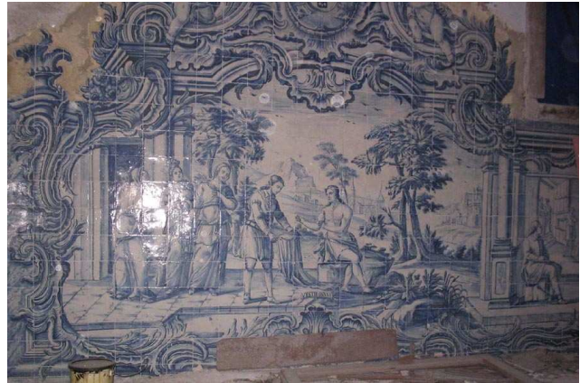
Fig. 254 - Vestir os nus

À esquerda, um homem sentado ofereceu água a outro, em pé, que ainda segura o cálice. Logo a seguir, a cena complexifica-se e uma balaustrada, que termina num vaso, separa o espaço onde uma figura masculina está sentada à mesa (servido por um outro de pé e uma criança), do jardim, com uma fonte, para onde se dirige um outro homem. Ao fundo, a paisagem é preenchida por montanhas.