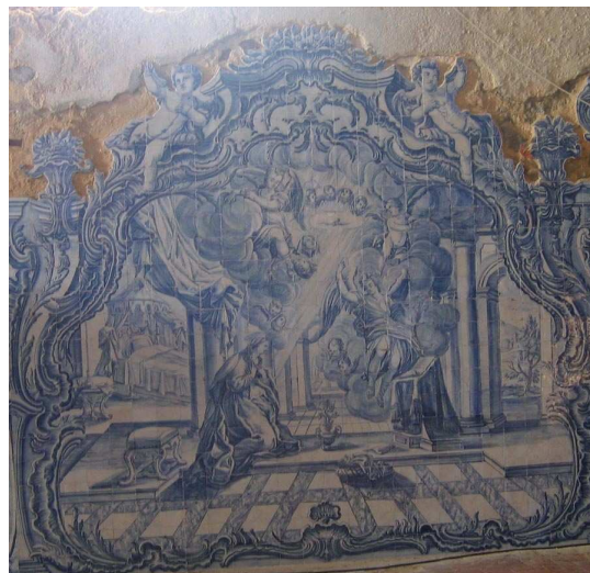
Fig. 258 - Anunciação

Entre as molduras, de enrolamentos e folhagens, ergue-se uma espécie de pilastra, que se divide, terminando num vaso. As cenas são, pois, muito separadas entre si, embora comunguem do mesmo artifício teatral: a zona