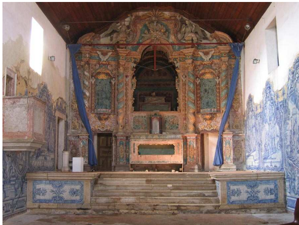
Fig. 251 - Perspectiva geral do interior da igreja