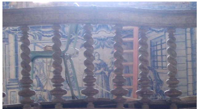
Fig. 255 - Visitar os presos / curar os doentes(?)

Em primeiro plano, um homem estende uma peça de roupa a outro, com o torso nu. Da porta da casa, à esquerda, várias mulheres observam e dirigem-se para junto dos homens.