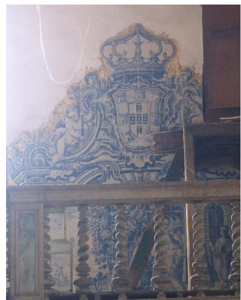
Fig. 256 - Dar pousada aos peregrinos

Em primeiro plano, dois homens depositam o morto numa vala antecedida por um caveira. Do lado