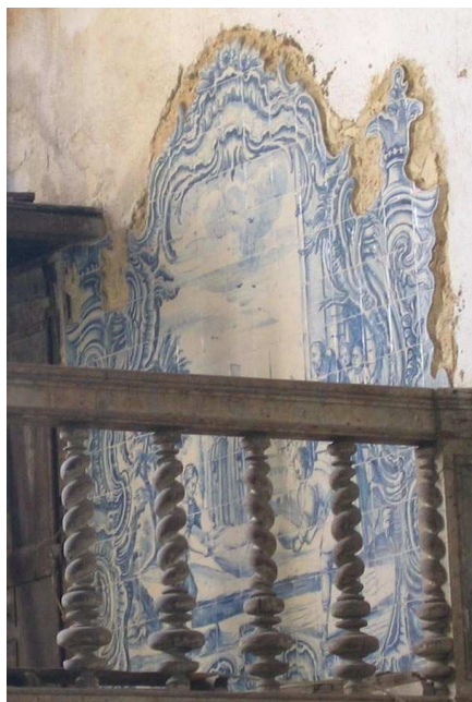
Fig. 257 - Enterrar os finados

direito, o padre abençoa o cadáver e alguns acólitos encontram-se junto à porta de um edifício. À frente, dois padres assistem ao enterro. Ao fundo, uma montanha.