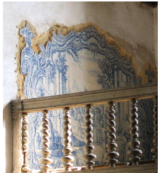
Fig. 253 - Dar de comer aos famintos / Dar de beber aos que têm sede

O caso da igreja de Alhos Vedros é o único em que os painéis com obras de misericórdia apenas surgem no coro alto, ao qual se acede através das escadas que se situam já no edifício do hospital que lhe é contíguo, mas que comunicam com a nave pela porta lateral do lado do Evangelho. A primeira obra encontra-se na parede da nave do lado da Epístola, distribuindo-se as restantes na fachada do templo, contornando o janelão, e a última, do lado oposto. Segue a ordem que se observa nas fontes escritas, comuns a outras igrejas, embora a junção entre o Curar os enfermos e o Visitar os presos deva ser entendida com alguma reserva: no Memorial