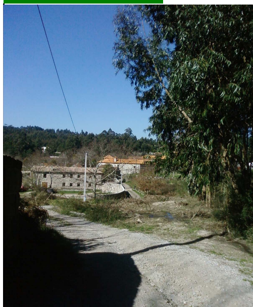
Foto 1 - Vista para poente, onde é perceptível a elevação de terreno onde se localiza o Castro do Monte Padrão.