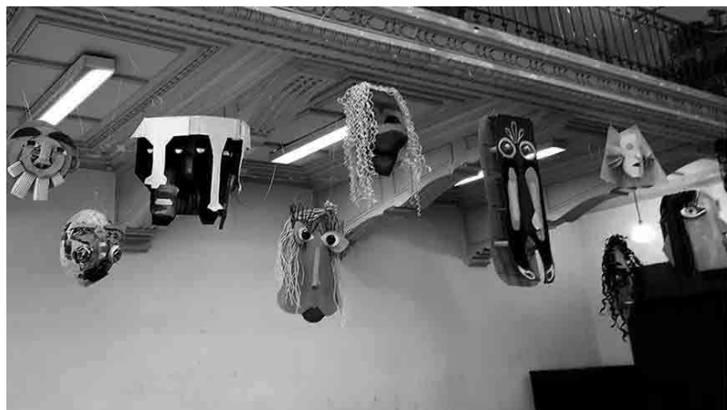
Figura 5 - Construção da máscara a partir da caricatura.