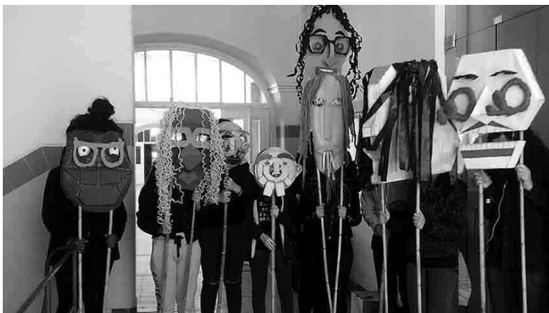
Figura 7 · Exposição dos trabalhos dos alunos (máscaras, desenhos do autorretrato, caricatura a grafite e caricatura a partir da linha a tinta da china).