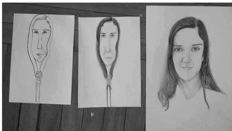
Figura 3 · Exemplos de evolução do exercício de Desenho: autorretrato a grafite, Caricatura a grafite e caricatura a partir da linha a tinta da china.