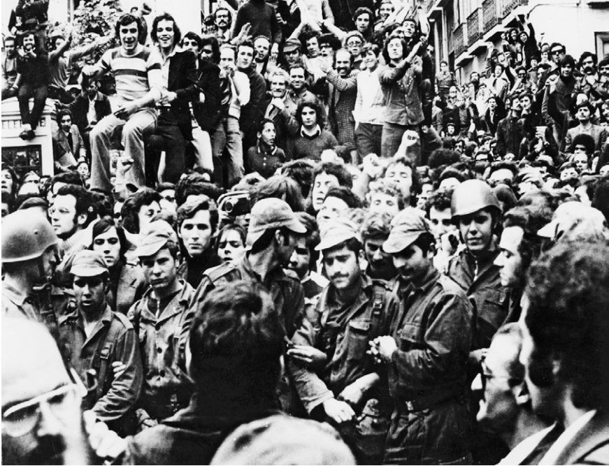
Abb. 1 Menschenmenge am Largo do Carmo in Lissabon am Nachmittag des 25. April 1974, dem Höhepunkt des Putsches gegen die längste Rechtsdiktatur Europas.

von den Massen in Lissabon willkommen geheißen und marschierten am 1. Mai auf der größten Kundgebung, die Portugal je gesehen hatte. Im ganzen Land jagten demokratische Aktivisten die Beamten der Diktatur aus den Rathäusern, Gewerkschaften und anderen Institutionen. Dies alles geschah mit einem enormen Gemeinsinn und ohne Gewalt. Die Welt schaute voller Sympathie nach Lissabon, und die Stadt füllte sich mit ausländischen Journalisten, die ihr Vertrauen in die Fähigkeit der Portugiesen, eine Demokratie zu schaffen, zum Ausdruck brachten. 9 Nur einige wenige abweichende Stimmen durchbrachen den Optimismus. In einem unheilverheißenden Ton weissagte etwa der Korrespondent der Frankfurter Allgemeinen Zeitung , Walter Haubrich, in seinem Bericht zum 1. Mai aus Lissabon, dass dieser großartigen Party bald das Chaos, wenn nicht gar ein Bürgerkrieg folgen würde. 10 Die Ereignisse der nächsten Monate konnte das