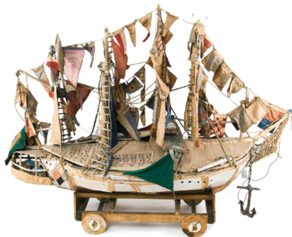
Figura 7: Grande Veleiro - Acervo do Museu Bispo do Rosário Fotografia: Rodrigo Lopes]

- marcas que foram constantemente obliteradas pelo seu entorno, pela atmosfera da sociedade na qual se constituiu enquanto sujeito. Representando o mundo segundo seu próprio feitio, Bispo inventa uma forma de reescrevê-lo, de (re)construção da realidade. A despeito de suas assumidas intenções ou não, Bispo parecia em certa medida consciente da potência narrativa como uma estratégia de resistência aos efeitos da morte social . Como ele mesmo afirmou em entrevistas, “um dia simplesmente apareci”. Através dessa mitologia própria, dessa auto-ficção, construída e, no entanto, vital, Bispo se ancora no mundo, suas obras são a tentativa concreta de reescrever sua própria biografia e de abrir um espaço de possíveis. Suas obras tecem sua própria história, contrariam a obliteração forçada da memória e da ancestralidade imposta a sujeitos negros em sociedades racistas.