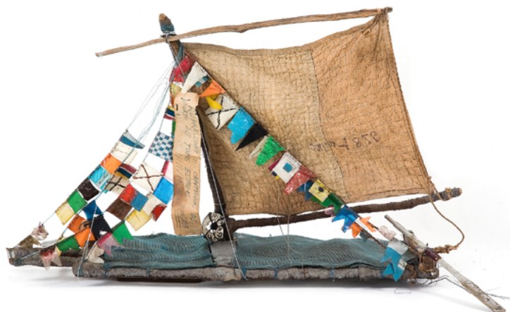
Figura 6: Jangada - Acervo do Museu Bispo do Rosario Fotografia: Rodrigo Lopes

constantemente argumentações em torno de metáforas marítimas, pondo em relação as imagens do oceano e de embarcações com uma análise do que significa ser negro no mundo de hoje. O próprio título evoca com wake a ideia de "rastros deixados na água por um barco". E é justamente a partir de rastros que Sharpe busca compreender a atmosfera em que vivemos e que ela irá conceitualizar de maneira pessimista enquanto "a totalidade do nosso meio", enquanto "a máquina na qual vivemos", em um meio-máquina, uma atmosfera total que é "antinegitude": a "escravidão se tornou a atmosfera absoluta". 39