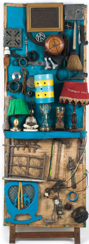
Figura 3: Abajour - Acervo do Museu Bispo do Rosario

Além das classificações de Moraes e Correa, Bispo criou uma diversidade de outros tipos de objetos: mantos, bastões, mapas, pequenas instalações, miniaturas de objetos (carrosséis, pipas, carros de boi...), faixas inspiradas de concursos de “Miss World” - que participam do que o curador e crítico Paulo Herkenhoff chama de uma “geografia pop”. 20 O trabalho com tecido feito por Bispo é com frequência de um bordado preciso, de grande complexidade, muito detalhado e repetitivo. Dentre os mantos, encontram-se os chamados Capa de Exu e o mais famoso Manto da apresentação .