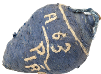
Figura 4: Pião – Acervo do Museu Bispo do Rosario Fotografia: Rodrigo Lopes

A tripla questão do inventário, da catalogação – “catalogador do universo” responsável por uma “poética do inventário”, diz Aquino 24 – e da representação tem sido enfatizada por diversos teóricos e críticos da obra de Bispo. Ela segue