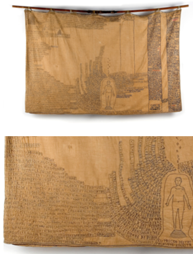
Figura 2: (abaixo, detalhe) Eu Preciso Destas Palavras . Escrita - Acervo do Museu Bispo do Rosario Fotografia: Rodrigo Lopes

senão obedecê-las - Bispo afirma ser “escravo” delas ou ainda “escravo do Senhor”. 9