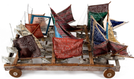
Figura 8: Vinte e Um Veleiros - Acervo do Museu Bispo do Rosario

espécie de narrativa de reparação final ou como uma síntese reconciliatória. Até o fim, Bispo permanece se apresentando não como artista, nem como cidadão ou louco, mas como ao mesmo tempo "escravo" - essa marca indelével, presente em um dos poucos registros que temos de seu próprio discurso - e "redentor". É nessa tensão insolúvel e contraditória que se inscreve a sua obra. E se nomeia o "universo", recria uma totalidade, o faz tão-somente para se contrapor ao dismantelamento social e psíquico que seu corpo experimenta.