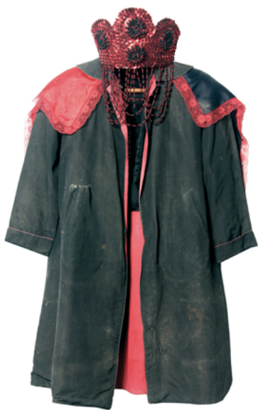
Figura 5: Capa de Exu – Acervo do Museu Bispo do Rosario Fotografia: Rodrigo Lopes

positiva da desordem. Para o fundador da psicanálise, o delírio ( Wahnbildung ) é entendido como uma forma de produção de subjetividade, uma forma de “cura ou tentativa de reconstrução”. 32 Rivera ecoa também a posição de Moraes que enxergara nos delírios de Bispo uma tentativa de “ordenação das ideias, elaboração de conceitos”. 33 De certa forma, a produção de Bispo é a sua forma de (re)construção do mundo, de (re)organização do que a ordem psiquiátrica considerou a sua “desordem” – “esquizofrênico paranoico”, “delírio ou ilusão de grandeza”, etc. segundo os diversos diagnósticos recebidos ao longo da vida.