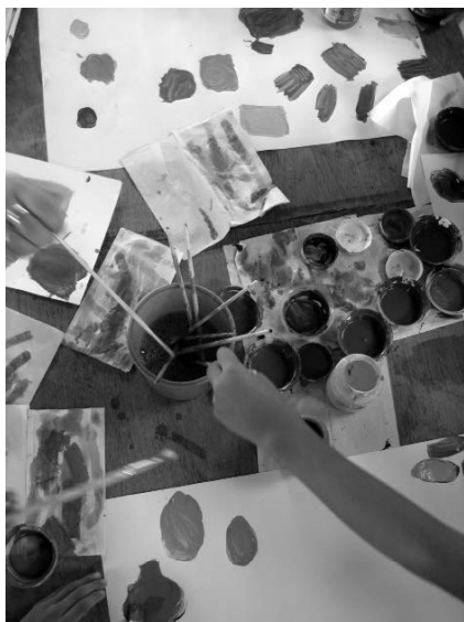
Figura 3. Trabalhando mistura de cores.