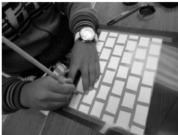
Figura 2. Produção de stencil. Fonte: própria. Este processo artístico/pedagógico possibilitou alguns desdobramentos reflexivos para o artigo.