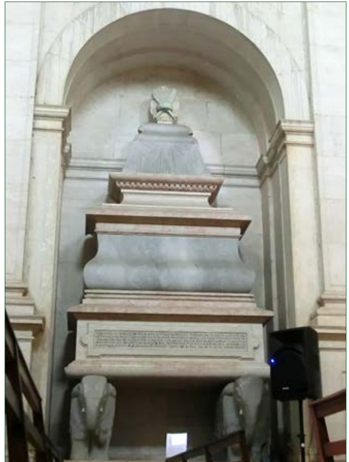
Figura 5 - Capela de Corpus Christi ou dos Castros, no convento de S. Domingos de Benfica, Lisboa – monumento fúnebre de D. João de Castro.