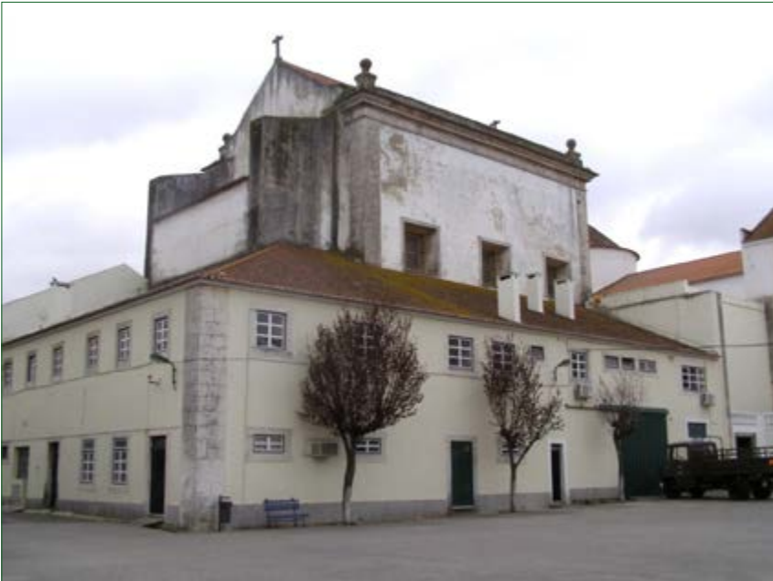
Figura 3 - Capela de Corpus Christi ou dos Castros, no convento de S. Domingos de Benfica, Lisboa – vista geral exterior.