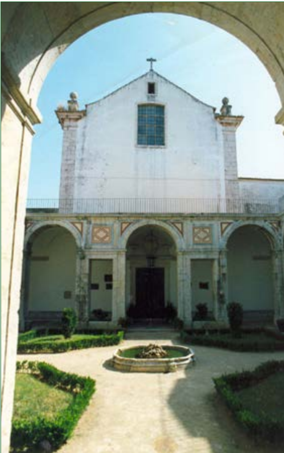
Figura 4 - Capela de Corpus Christi ou dos Castros, no convento de S. Domingos de Benfica, Lisboa – fachada principal.