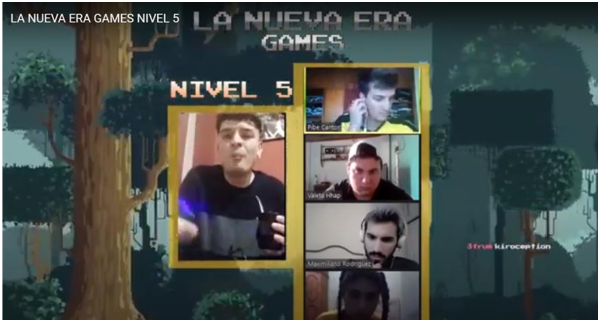
Captura fotográfica: Transmisión LNA GAMES, Abril de 2020

opiniones sobre las presentaciones y se otorga un puntaje, que determinará al final de la competencia. El público, por su parte, interactúa también a través de un chat donde puede escribir comentarios.