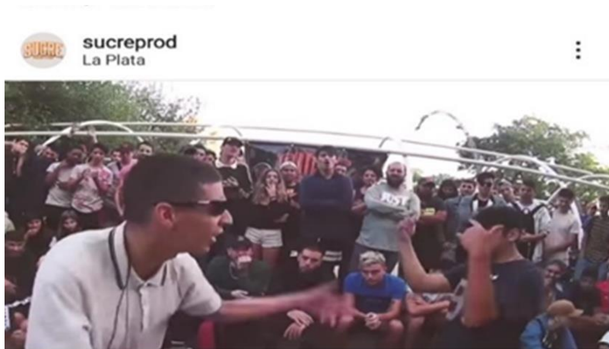
Captura fotográfica: Publicación de Sucre “minutazo”, Mayo de 2020

En los registros de archivos audiovisuales de batallas publicados por Sucre en su página de Instagram, denominados Minutazos, se puede apreciar cómo los competidores se mueven al compás de una base musical que marca el ritmo donde se apoyan las barras que dan sustento a una performance rapera. Desde el cuerpo se juega con las distancias entre los participantes: quien rapea moviliza el cuerpo hacia adelante, mueve sus brazos acompañando lo que se está diciendo, buscando el encuentro cara a cara con su contrincante, provocándolo. Generalmente quien espera su turno deambula por el pequeño espacio que se construye como escenario, delimitado por otros cuerpos (del público y del jurado). Zigzaguea los embates corporales de su contrincante mientras escucha con atención y organiza mentalmente una posible respuesta a lo que el rapero le está proponiendo. Cuando reconoce una buena rima, agita sus brazos, levanta la vista a quien está rapeando, sonrío, aplaude o acompaña la aclamación de los presentes.