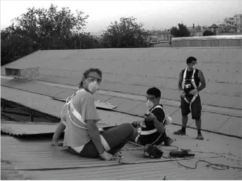
Figura 1 · Edificio Aulabierta , proceso de de-construcción y contrucción con materiales reciclados, en la Facultad de Bellas Artes de Granada, (2006).