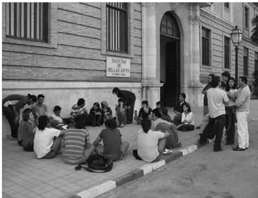
Figura 2 - Seminario Aulabierta , Facultad de Bellas Artes de Granada, (2006).