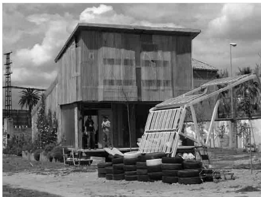
Figura 4 - Inauguración del edificio Aulabierta , autogestionado y autoconstruido con materiales reciclados en la Facultad de Bellas Artes de Granada, (2006).