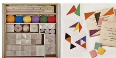
Figura 5 – Materiais de Fröebel originais e produzidos recentemente.

Montessori elaborou diversos materiais tendo em vista desenvolver a exploração sen-