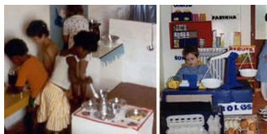
Figura 2 – Espaço Lúdico da Horta Nova, Área da cozinha e Ludoteca da Damaia, Área da mercearia

espaços, por via da criação da Área da Mercearia e de um Canto da Casa, foram disponibilizados materiais relacionados com a escrita: canetas, lápis, papel, blocos, telefone, listas de telefone, revistas, catálogos, envelopes, calendários, livros, etc. E foram fomentadas, situações lúdicas, com jogos dramáticos, onde se representavam cenas da vida real, como por exemplo: dar de comer, vestir, deitar e ler contos às bonecas; preparando idas a supermercados com a realização de listas de compras, fazer cozinhados para as refeições, ler livros de receitas, etc. (Pessanha, 2001).