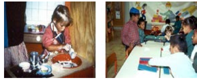
Figura 1 – Foto da Esquerda: Ludoteca do IAC do I Curso de Formação de Monitores no Centro Artístico Infantil da Fundação Gulbenkian. Direita: Ludoteca itinerante na Junta da Damaia

Neste contexto, as Ludotecas criaram em todo o país uma corrente com uma expressão dinâmica forte e original. Neste tipo de espaços têm surgido experiências que, pela sua riqueza, devem ser objeto de reflexão. Foram muito utilizados por crianças carenciadas e/ou inadaptadas, tornando possível efetuar a observação do seu comportamento lúdico. Estas crianças, que na escola revelavam enormes dificuldades de adaptação e integração, evidenciavam aqui níveis muito ricos de persistência, concentração e organização. Estes comportamentos surpreenderam muitos educadores que observaram, em muitas destas crianças, capacidades latentes que estão omissas e não são evidenciadas no contexto escolar.