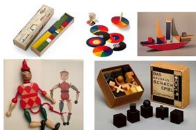
Figura 7– Jogos da Escola Bauhaus de Ludwig Hirschfeld-Mack, Josef Hartwing e Alma Siedhoff-Buscher 1923.

Remontam também a essa altura as primeiras tentativas de legislar sobre estas matérias. Por exemplo, em Copenhague o “Building Act of 1930” determinou que em blocos de casas para