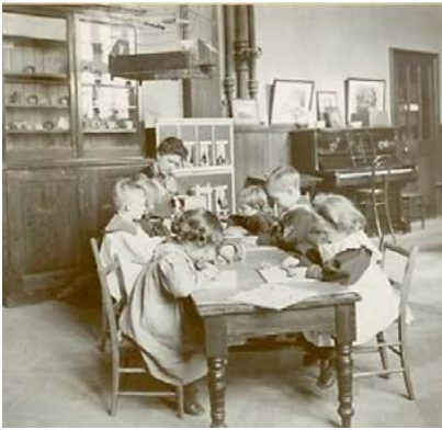
Figura 3 – O jardim-de-infância e as caixas de materiais de Fröebel.