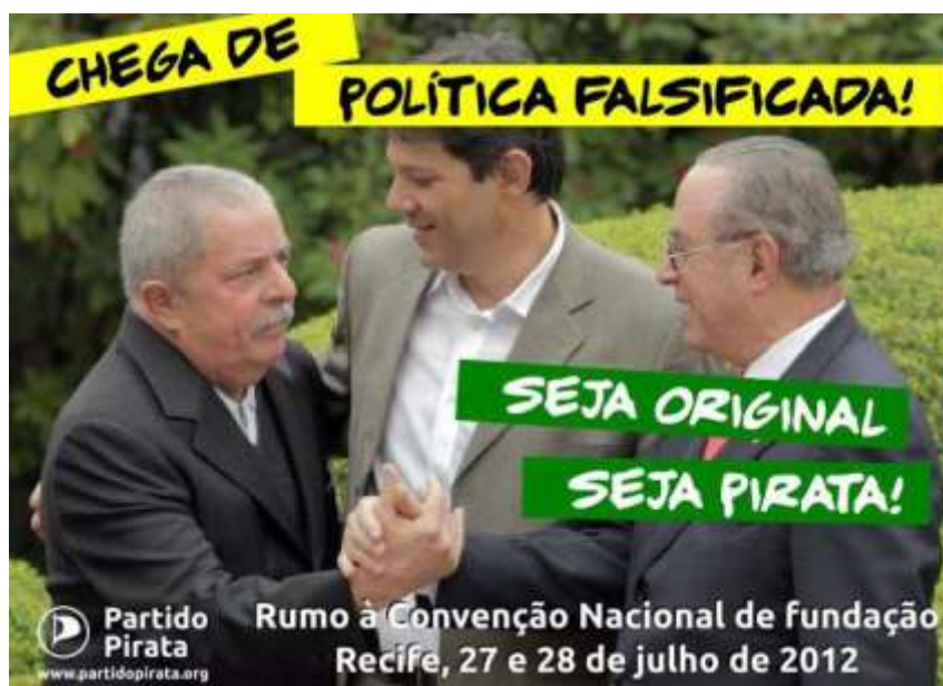
Imagen 6. Flyer digital del Partido Pirata de Brasil / Divulgación (Partido Pirata del Brasil, 2012).

grandes marcas, se vierte al campo de la política tornándose instrumento implícito de negaciones y oposiciones. Una estrategia performática, por veces excesiva, que abusa de lo caricatural con el objetivo de “singularizar, a través de una apuesta en una estética que marca su presencia en lo mundo y que, en los sus excesos neo-barrocos, se traduce en un manifiesto de la existencia de sus protagonistas” (Ferreira, 2011:121).