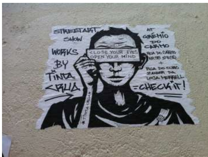
Imagen 2: sin identificación/autoría de Tinta Crua

En 2012, estuve, rápidamente, en Lisboa. Ya iniciaba en Brasil la investigación acerca de las conexiones entre arte urbano, grafiti y pichações . Caminando por Chiado, sin aun saber de quien se trataba, fotografié un « collage » de Tinta Crua.