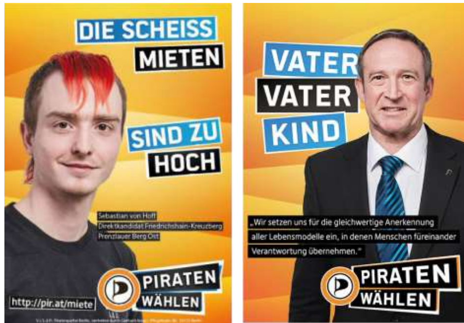
Imagen 3. Carteles de la campaña política del Piratenpartei .

fusión de la política, la tecnología, el amor e la diversidad sexual. La lucha por libertad de consumo de marihuana es divulgada en paquetes de papel de liar tabaco 111 .