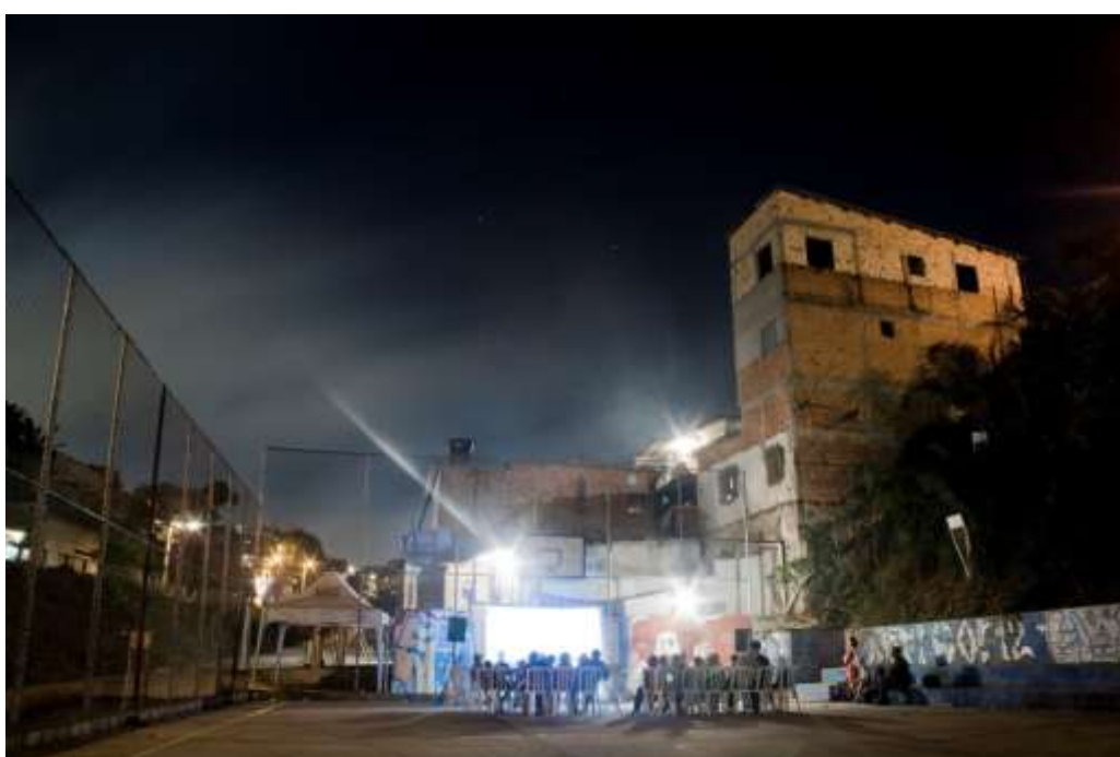
Fig. 7 y 8: Festival de Cine de Várzea

A parte, desde 2007 el grupo promueve el proyecto Videoteca Popular que es un espacio dedicado a la disseminación de contenidos videográficos educativos, independientes y del cine