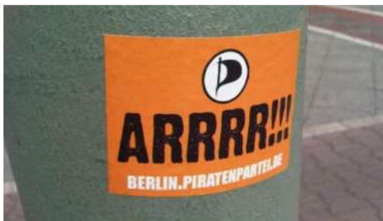
Imagen 1. Publicidad – Piratas de Berlin/Divulgación (Torrent Freak, 2011)

del símbolo gráfico colabora con la integración cómoda del MPP al invocar un conjunto de ideas y sentimientos intercambiables por la unidad ideológica de sus principales propuestas. Como defendió Domenach (1963), las fórmulas claras y la reducción del tono rebuscado y abstracto de las propagandas partidarias, solamente tiende a favorecer buenos resultados en el proceso elemental de fijación de una ideología. La identificación casi automática de los piratas con el negro y el blanco persistió a lo largo del tiempo. Son construcciones connotativas que transgreden artificialmente la norma (Durand, 1974). Como dice Machado (2013: 37), este modo de actuar “intriga por su inevitable asociación con la dualidad de varios sistemas de creencias que, a su manera, intentan descomponer o deconstruir la realidad en sus niveles más básicos”.