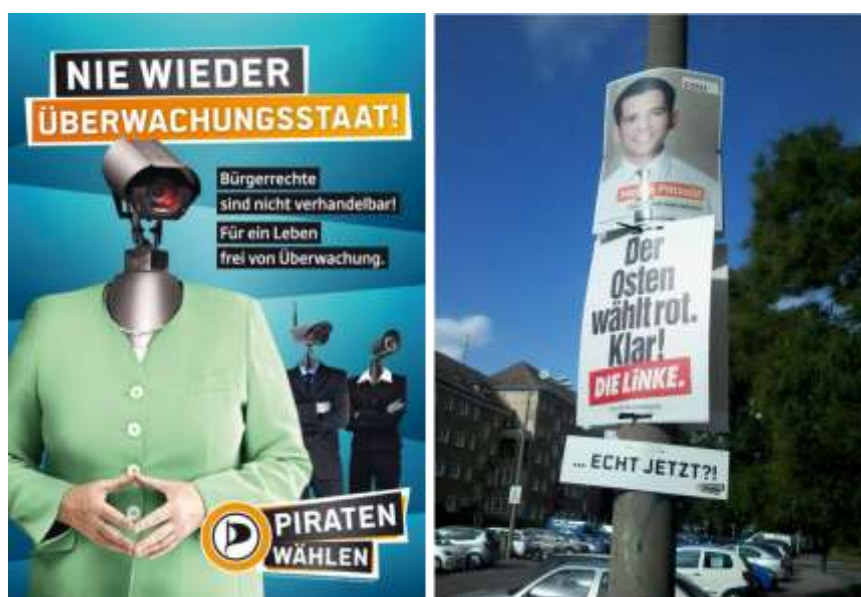
Imagen 5. Directo: Cartel de la campaña pirata en Berlín. Izquierda: Letrero/Archivo personal (imagen Rodrigo Saturnino, 2013).

1990) que busca en el conocimiento cultural del interlocutor las referencias predecesores que contribuyen para liberar el poder de su mensaje. En este sentido, gran parte de la acción mediática del MPP se basa en los mapas culturales establecidos anteriormente acerca de la imagen del pirata, su función y las prácticas que de él se originan en la forma de romper, por vías antagónicas, los sentidos dogmáticos. Acá, el lenguaje es un recurso seminal que sobrepasa, un poco más, el carácter sencillo de la retórica del podio para transformarse en proyección perturbadora de la estructura del orden.