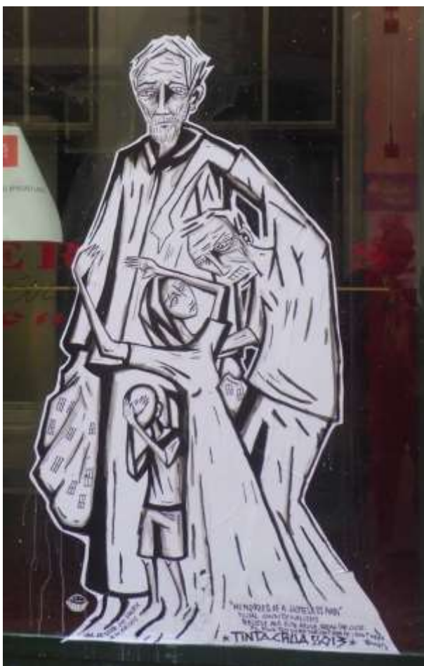
Imagen 7: sin identificación/autoría de Tinta Crua (Fotografía de la autora, Junio 2013)

condición off del mercado del arte, Tinta Crua, hace emerger, en las paredes prohibidas, imágenes de un país que sufre, cotidianamente, crisis y las más variadas vivencias de exclusión: desempleo, ampliación creciente del número de personas en situación de calle, cierre de establecimientos de comercio, huelgas y tantos otros impases y conflictos / En el arte de Eduardo, las tintas son derramadas en colores vivaces, en formas desnudas y crudas. Como, por ejemplo, el homeless que él dejó registrado en la Rua do Carmo, ya habiendo sido de allí arrancado. (Diógenes, 2013a: s.p.)