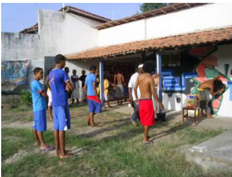
Imagen 2: Los integrantes de la posse ' Cidade Olímpica em Legítima Defesa ' haciendo grafiti en la sede de la organización.

No estamos afirmando que el Hip Hop se inspiró en Paulo Freire para la constitución de las ' posses ', sino apenas delineando un paralelo que nos ayuda a comprender los objetivos y la forma de organización de varios grupos de Hip Hop en Brasil, además de situar la importancia pedagógica que ejercen las ' posses ' en el mismo sentido de los ' Círculos de Cultura ', como constatamos a partir de sus actividades.