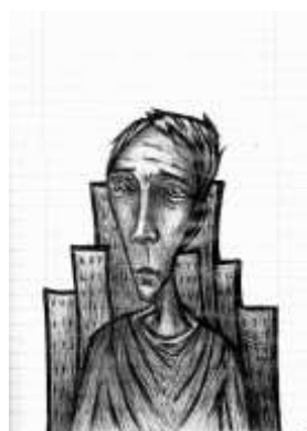
Imagen 1: sin identificación (imagen cortesía del artista de la obra, Tinta Crua, 2013)