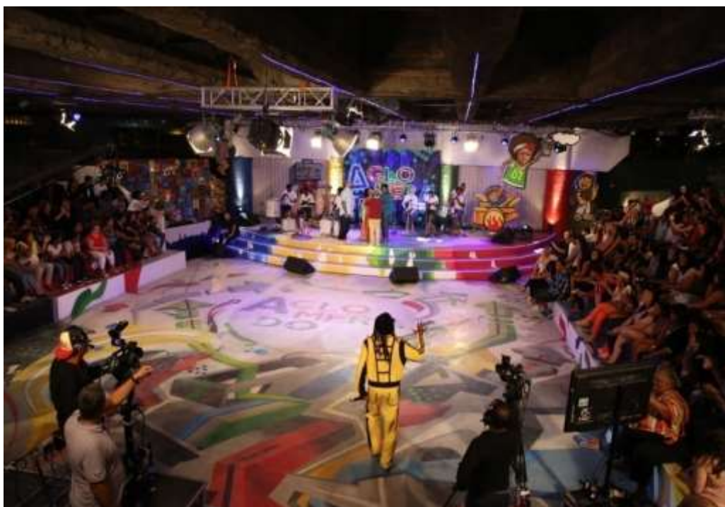
Fig. 4: Programa Aglomerado