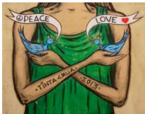
Imagen 6: sin identificación (imagen cortesía del artista de la obra, Tinta Crua, 2013)

Acompañé los «pasos» de Tinta Crua no sólo cara a cara, pasé a visitarlo, casi diariamente, en su página de Facebook. 237 Como veremos en el próximo tópico, el cerco en Lisboa, va cada vez más cerrándose para el arte considerado «ilegal», sin el permiso de la Cámara Municipal. El día 09 de septiembre de 2013, Tinta Crua publica una imagen en su página y ella hace eclosionar un debate sobre el tema en boga: