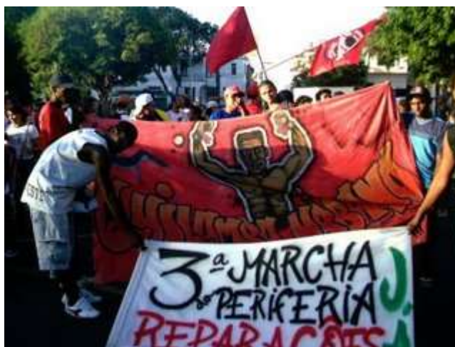
Imagen1:Bandera del Movimiento Hip Hop Quilombo Urbano en la Marcha da Periferia , realizada en São Luís de Maranhão (Archivo Personal de Rosenverck E. Santos)

‘Quilombo Urbano’ ha utilizado la cultura Hip Hop ( break , grafiti y rap ) y su acción directa junto a las comunidades pobres para discutir y minimizar los problemas advenidos de las desigualdades sociales y étnico-raciales existentes en el medio urbano. Es en esta dirección que los precursores del Hip Hop buscaron las plazas de São Luís. El Hip Hop en São Luís, en este sentido, considerando el contexto social y urbano, se configura como una opción de resistencia político-cultural a la juventud negra y pobre, ya que los partidos políticos y otras organizaciones se distanciaron de los anhelos de cambio y de la creatividad de esa juventud.