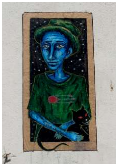
Imagen 8: sin identificación/autoría de Tinta Crua (Fotografía de Tinta Crua, 2013)

Provocar miradas, «causar» alguna cosa en quien pasa y ve, parece ser exactamente este el intento de la Cámara al escoger temas y «liberar» paredes para intervenciones de arte; seleccionar lo que los habitantes de Lisboa «deben» ver y que tipo de impactos deben recibir. El día 23 de agosto, Tinta Crua, publica una foto en Facebook, surgida de unos ‘trazos’ hechos por él durante una clase, y así moviliza un dialogo acerca de la nueva regulación: