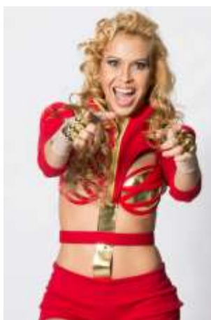
Fig. 2: La cantante Joelma, de la Banda Calypso, fue hace 14 años el mayor caso de éxito del tecnobrega de Pará, inspirando a veteranos y principiantes.

Aunque la música brega ( kitsch ) ha desempeñado un papel destacado en el contexto de la expansión del mercado musical brasileño, aumentando los números de la industria discográfica durante la década de 1970 y produciendo un crecimiento vertical del mercado interno de bienes simbólicos, las distinciones auténtico/copia, o buen/mal gusto, siguió funcionando como lógica la segmentación creada por la propia industria de la música y alimentada por los llamados ‘líderes de opinión’. Es esclarecedora la contextualización que hacen Freire Filho y Herschmann (2007) sobre las dificultades y obstáculos que enfrentan las expresiones musicales brasileñas no canónicas, debido a la expansión de una cultura popular de origen, desarrollada de manera diferente a la de los modelos idealizados por la moderna vanguardia artística e intelectual. Los autores señalan que, en aquel momento, la crítica contraponía la pureza de la intención de los géneros ‘de raíz’ o a la expresión desinteresada o políticamente comprometida de los artistas "auténticos", al impulso mercenario de los sellos fonográficos, los creadores y sus ‘creaciones - injusticias’.