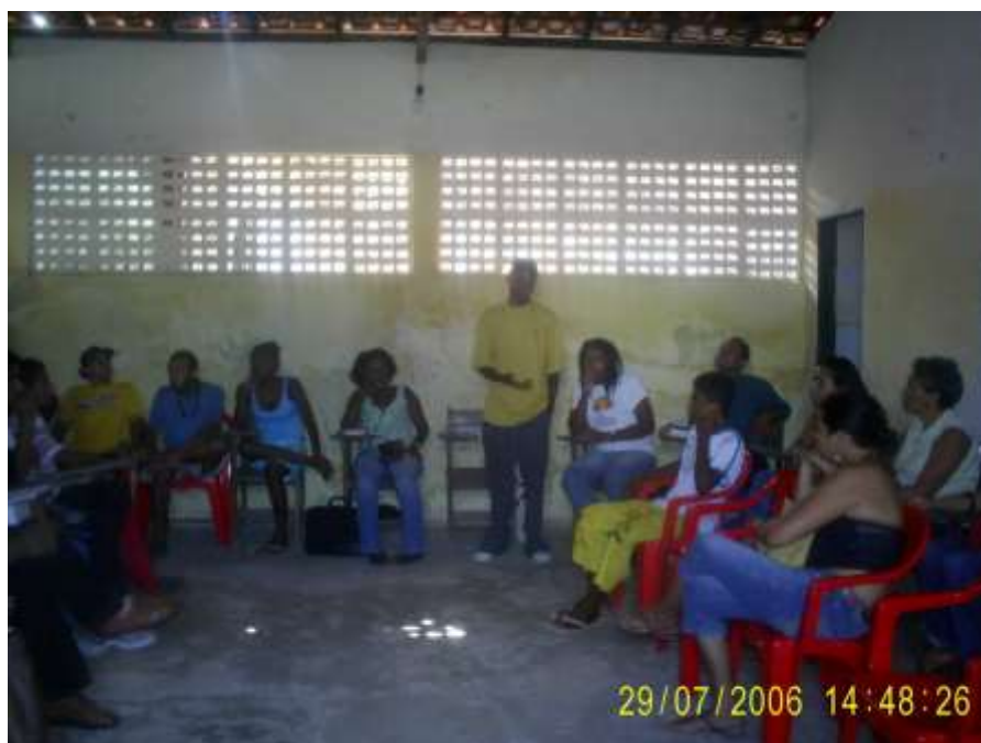
Imagen 3: Formación Política por la Posse 'Liberdade Sem Fronteiras' y la radio comunitaria Liberdade FM (Archivo Personal de Rosenverck E. Santos)

Por medio de sus prácticas organizativas y político-culturales, este movimiento articula formas de resistencia e intervención en la realidad que chocan con las élites dominantes, así como con los valores y patrones producidos históricamente por esa clase y sus medios de comunicación. Siendo así, a través de una producción alternativa de comunicación, contribuye en la información, aprendizaje y conocimiento acerca de temas antes negados o incluso tergiversados por los medios dominantes, referentes a la población negra, lo que posibilita la constitución de una identidad étnico-racial y de una conciencia crítica por parte de la juventud negra y pobre de São Luís de Maranhão y proporciona formas de movilización y resistencia contra-hegemónica.