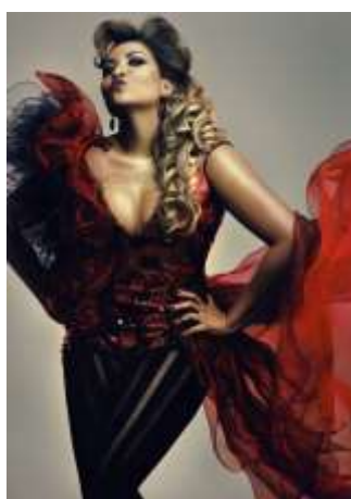
Fig. 1: La cantante Gaby Amarantos (Foto cortesía de Junior Franch (Scarlae)/Assessoria de Prensa Gaby Amarantos).

También hay que destacar que esta pluralidad de estilos evidencia procesos de apropiación de los patrones de la música pop mundial, periféricos - en el sentido popular - o no, que embrollan, aunque sea momentáneamente, la noción de 'lugar de origen' y cristalizan la coexistencia de mercancías musicales que, aunque formalmente distintas, utilizan códigos (referentes) comunes. Es curioso observar como los hits internacionales, los éxitos de Madonna o Beyoncé, por ejemplo, generan recreaciones fácilmente reconocibles en el Tecnobrega, pero con todos los signos de su localismo. Esta tensión también se materializa en los elementos visuales de esta escena musical, incluyendo los trajes, posturas y performance (desempeño) de los artistas.