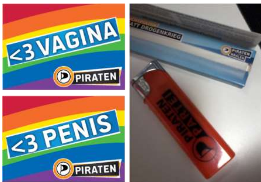
Imagen 4. Material de campaña del Piratenpartei . Archivo personal (imagen Rodrigo Saturnino, 2013).

Otra forma utilizada por los piratas de Alemania para establecer la interacción simbólica con los peatones es crear un diálogo imaginario con la oposición. Los mensajes de los afiches de los partidos rivales son replicados por medio de un pequeño letrero, fijado abajo del afiche del oponente. La política del adversario es contestada a través de sentencias irónicas con el objetivo de ridiculizar las promesas de los partidos tradicionales. Frases del tipo Hahahaba...Nien o Echt Jetzt?! 112 , aparentemente inofensivas, sirven como agente de escarnio e instrumento para liberar la risa desdeñosa (Domenach, 1963). También fue ridiculizada la imagen de Angela Merkel. Para criticar las políticas de vigilancia del gobierno de la canciller, su cabeza fue desmontada para ser reemplazada por una cámara de filmar 113 .