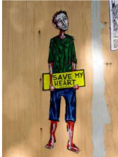
Imagen 3: sin identificación/autoría de Tinta Crua (Fotografía de la autora, Abril 2013)

Conseguí encontrar en vitrinas, paredes de las principales vías «collages» alusivos a la misma firma. Al regresar a Lisboa, en 2013, ya iniciando la investigación del posdoctorado, me encontré con ya otras imágenes producidas por Tinta Crua.