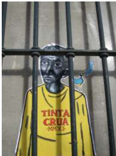
Imagen 4: sin identificación/autoría de Tinta Crua