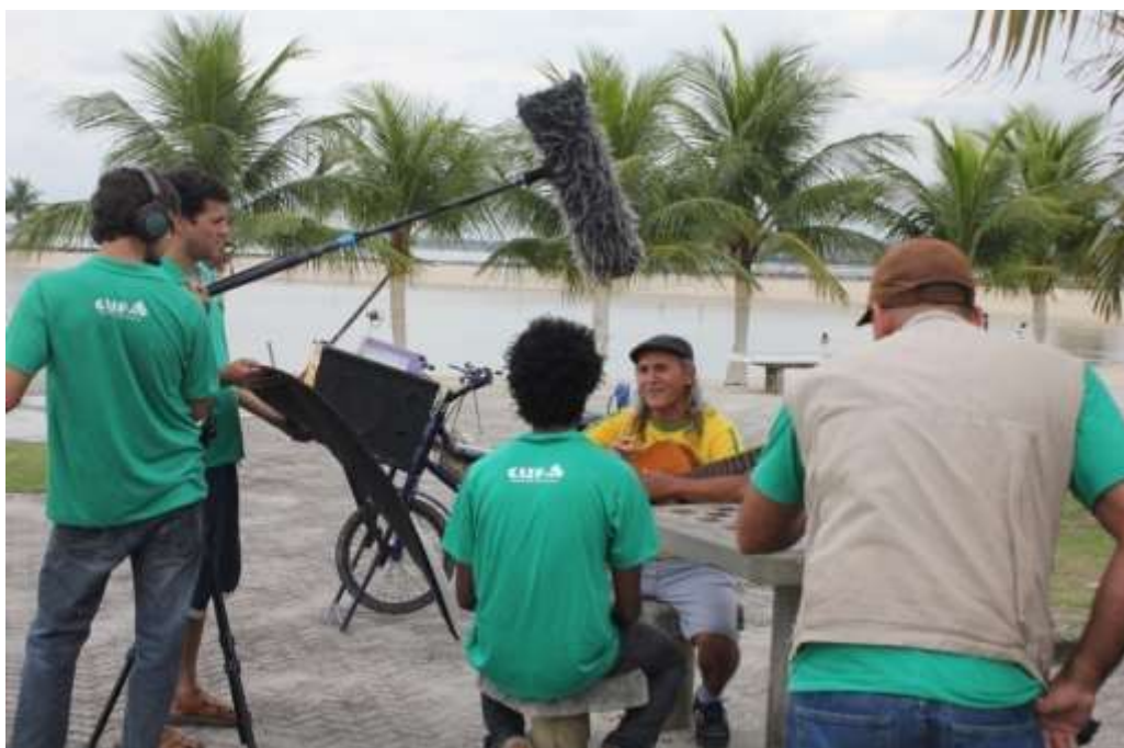
Fig. 6: Grupo CUFA de Audiovisual, 2013

Otra experiencia que surgió de este proceso de diálogo del CUFA con el audiovisual es la productora CUFA Filmes, que consta en su cuadro de profesionales ex alumnos formados por la CUFA audiovisual, y que visa un público más grande además de la comunidad