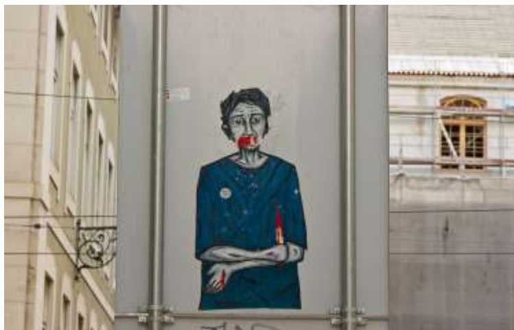
Imagen 5: sin identificación/autoría de Tinta Crua (Fotografía de la autora, Marzo 2013)

Había entre ellas expresiones de apelación, pedidos de socorro, alusión al dolor, sangre y silencio. Las primeras anotaciones de campo, 232 efectuadas en el mes de marzo de 2013, señalizan a mi percepción acerca de la intensidad de un arte que ocupa, en rebeldía, el «corazón» de Lisboa.