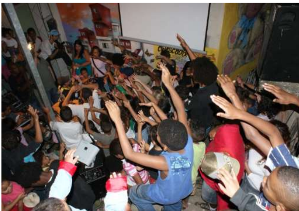
Fig. 1, 2 y 3: Cinescadão 2009- año en que en una misma noche fue exhibido videos hechos por la Fabicine – La Fantástica Fabrica de Cine, y también fue grabado material para el documental Imágenes PERI-féricas y para videoclips del proyecto (Fotos de Alexandre De Maio, imagen cortesía de Fabicine)

Cinescadão sirve como frente de comunicación y difusión de videos en la capital paulista, siendo vinculado a Fabicine, La Fantástica Fabrica de Cinema (fundada en 2005 a partir del Fórum de Cinema Comunitário de São Paulo), grupo independiente de personas que establece interlocución entre el cine y la comunidad, tiendo el cine como una herramienta política y instrumentalizadora para una discusión local.