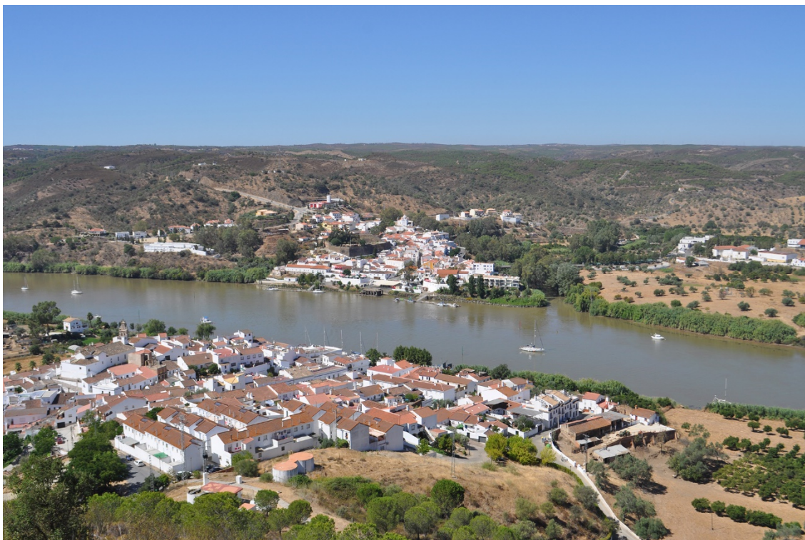
Fig. 3: Vista de las localidades de Sanlúcar de Gadiana y Alcoutim (al fondo), separadas por el curso del Guadiana, desde el castillo de San Marcos (F.J. García Fernández)

frontera a partir de la desembocadura del río Chanza, en Pomarão (Fig. 2). El trayecto en barco se ve complementado por un nuevo atractivo turístico que materializa de la forma más directa posible la conexión física y perceptiva entre los dos núcleos de población mediante la instalación de una tirolina en las inmediaciones del castillo de Sanlúcar de Gadiana, cuyo trayecto finaliza cerca de un embarcadero de Alcoutim desde el que los turistas son devueltos a su punto de origen en una pequeña embarcación (Fig. 3).