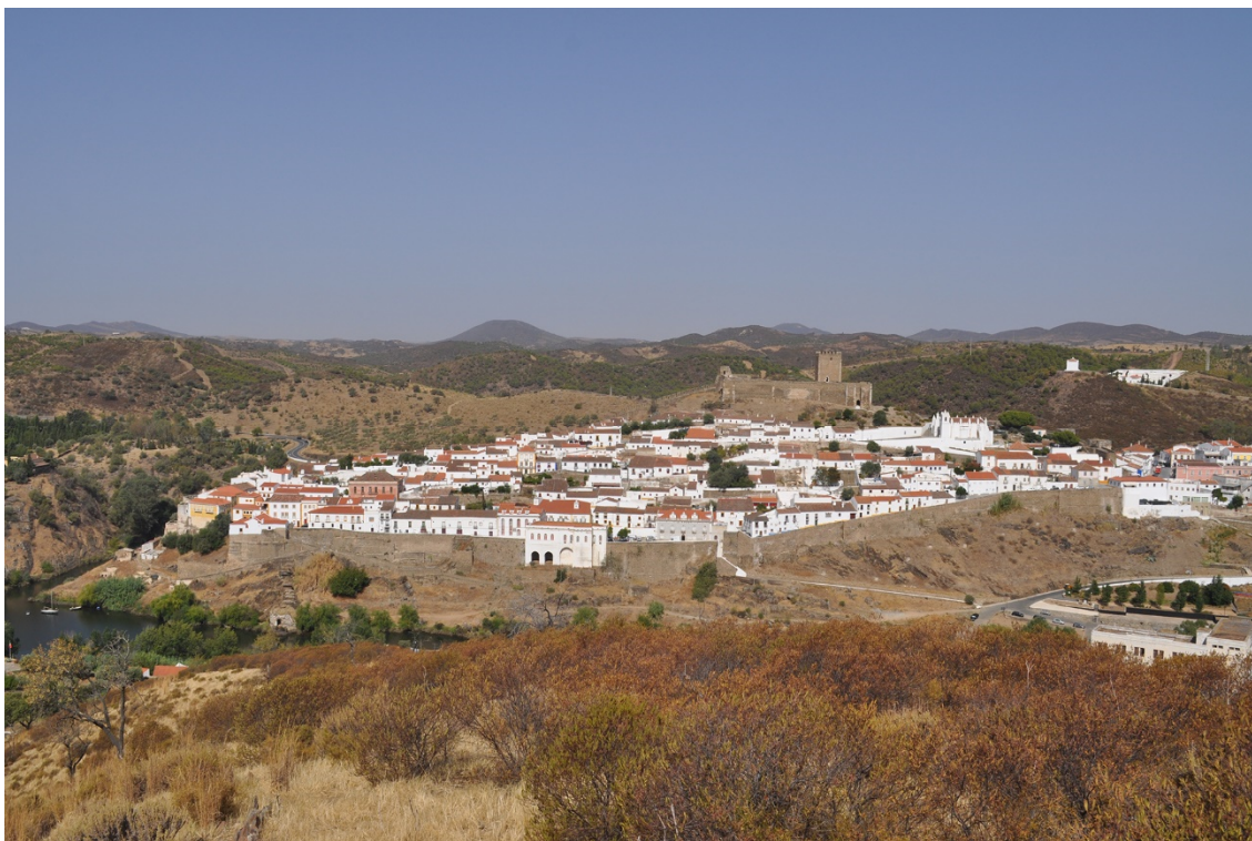
Fig. 2: Vista de la localidad de Mértola, uno de los principales recursos patrimoniales de la región, desde el Cerro da Antena

patrimonial transfronterizo en todas sus dimensiones. Por otro lado, desde la Arqueología, se ha emprendido el proyecto ANA-lise, financiado por la Fundação para a Ciência e Tecnologia (FCT) y realizado bajo la colaboración de miembros del Centro da Arqueologia da Universidade de Lisboa (UNIARQ) y de la Universidad de Sevilla. Este proyecto pretende desarrollar estudios sobre el poblamiento en ambas orillas del Guadiana durante el primer milenio a.C. y al mismo tiempo proponer estrategias de difusión y puesta en valor del patrimonio arqueológico identificado en áreas fronterizas.