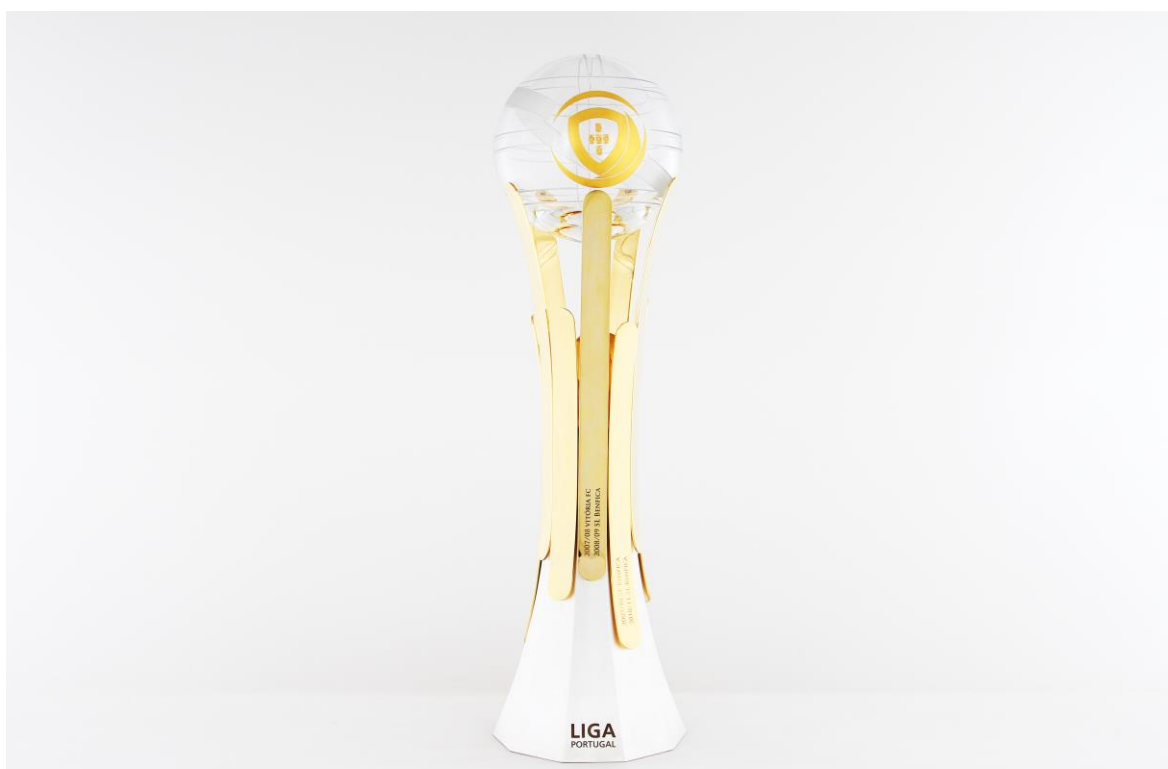
Imagem nº16: Terceiro modelo deste troféu.