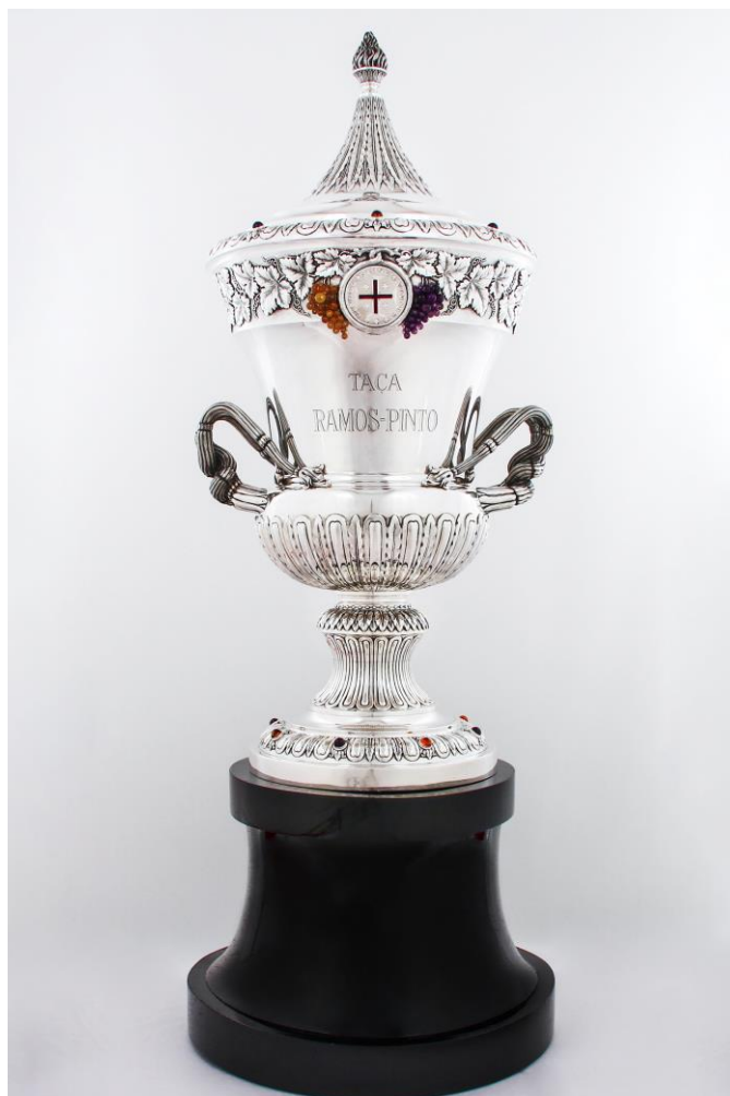
Imagem n°26: