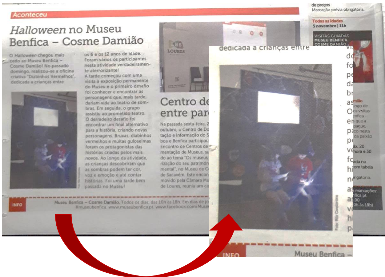
Imagens nº1 e 2: artigo retirado do jornal O Benfica , 3 de novembro de 2017, nº3836, p.30.

educativo, puderam inventar e desenhar novas personagens ao gosto de cada um, através de materiais que tínhamos disponíveis no auditório. No decorrer da atividade, a minha principal função foi: acompanhar e tirar vários registos fotográficos aos participantes. Uma das fotografias que tirei saiu no jornal O Benfica na semana seguinte da atividade ter acontecido: