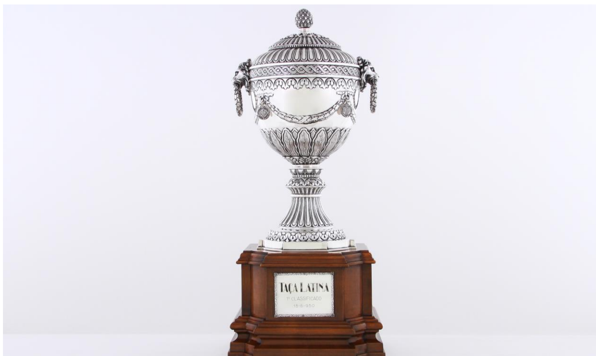
Imagem nº21: Fotografia de João Freitas (fotógrafo do departamento de reserva, conservação e restauro do Sport Lisboa e Benfica).