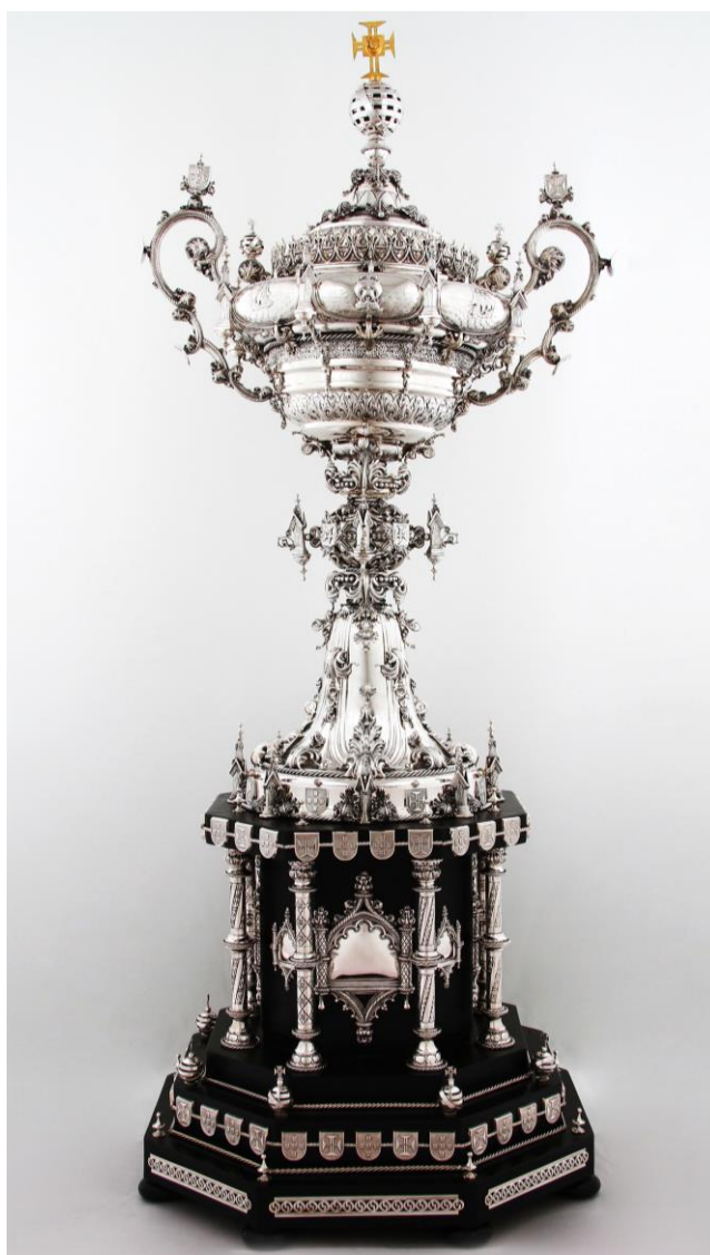
Imagem nº25: