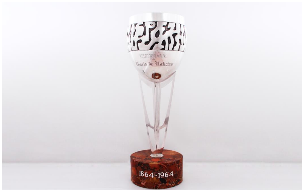
Imagem nº10: