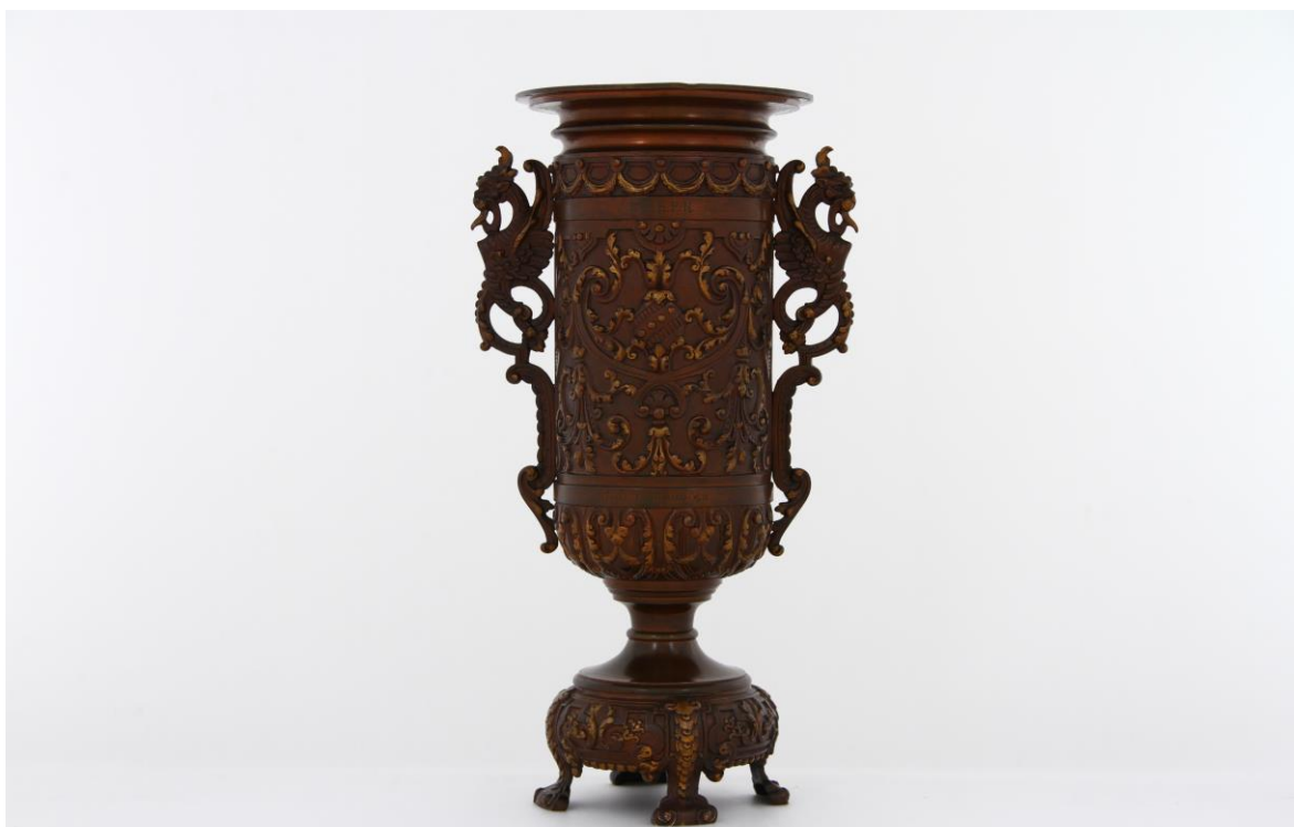
Imagem nº 3: Fotografia de João Freitas (fotógrafo do departamento de reserva, conservação e restauro do Sport Lisboa e Benfica).