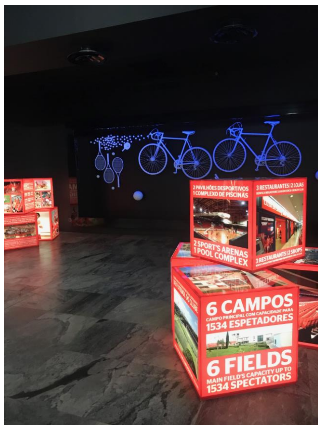
Imagens nº35 e 36: Fotografias da minha autoria, tiradas na exposição do Museu Benfica- Cosme Damião.