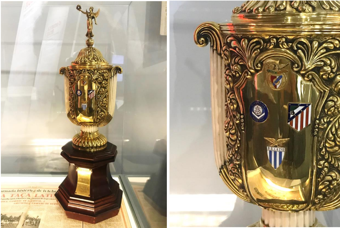
Imagens nº47 e 48: Fotografias da minha autoria, tiradas na exposição temporária do Piso 2, do Museu Benfica- Cosme Damião.