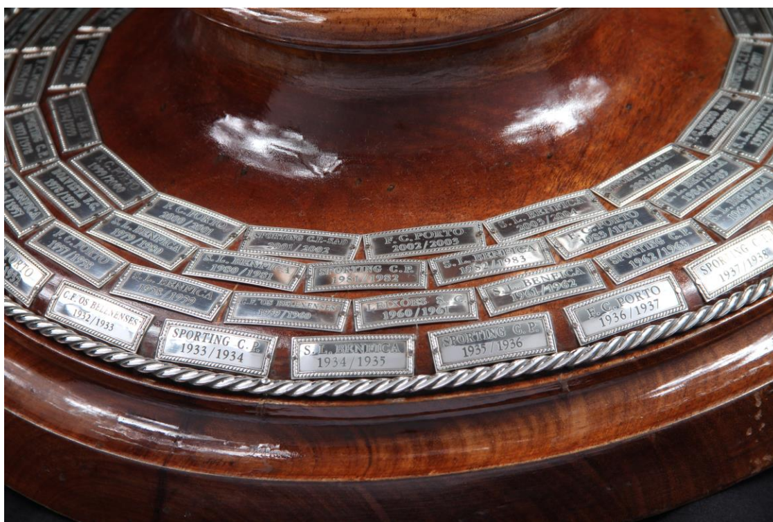
Imagens nº40, 41, 42 e 43: