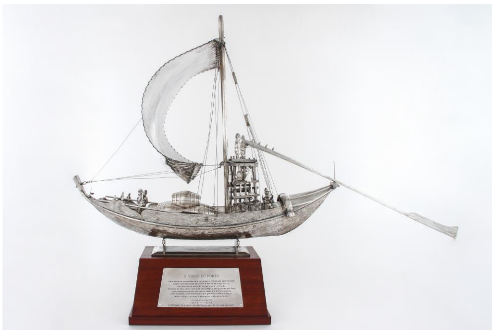
Imagem nº23: Fotografia de João Freitas (fotógrafo do departamento de reserva, conservação e restauro do Sport Lisboa e Benfica).