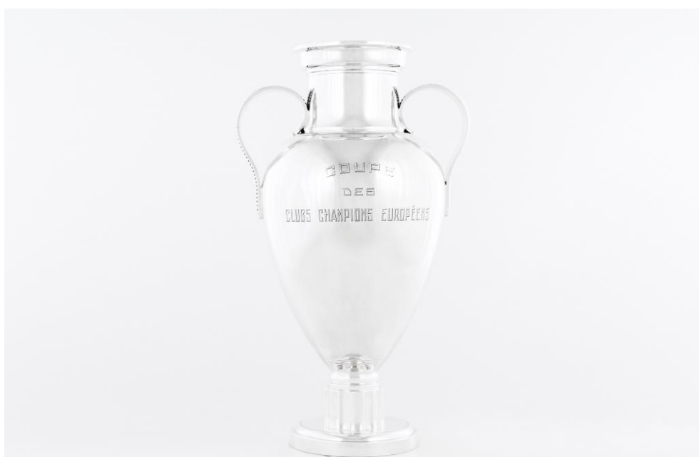
Imagem nº18: Fotografia de João Freitas (fotógrafo do departamento de reserva, conservação e restauro do Sport Lisboa e Benfica).