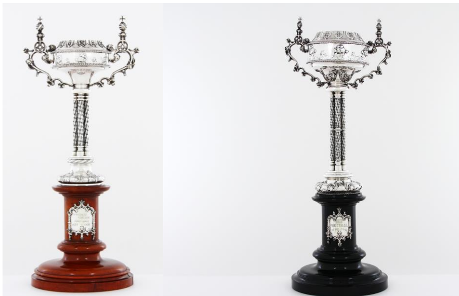
Imagens nº5 e 6: Fotografias de João Freitas (fotógrafo do departamento de reserva, conservação e restauro do Sport Lisboa e Benfica).