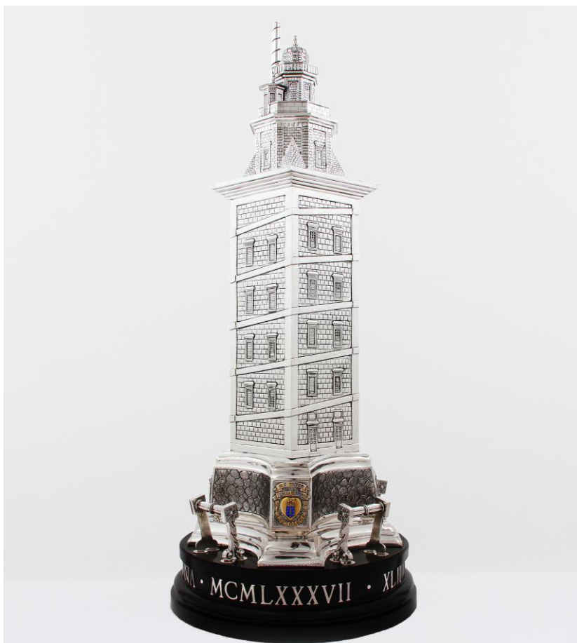
Imagem n°22: