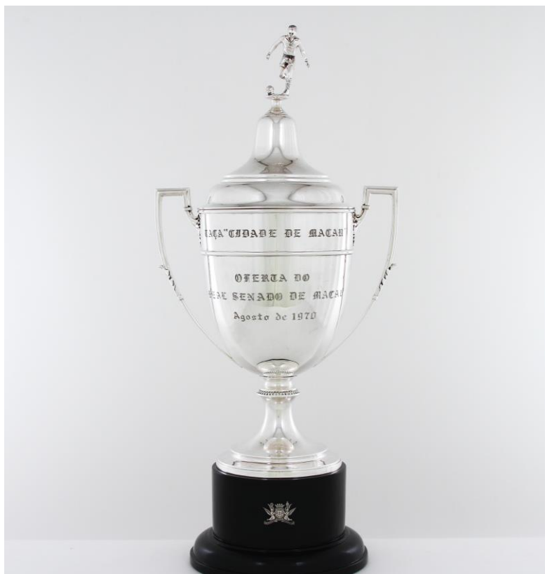
Imagem nº28: Fotografia de João Freitas (fotógrafo do departamento de reserva, conservação e restauro do Sport Lisboa e Benfica).