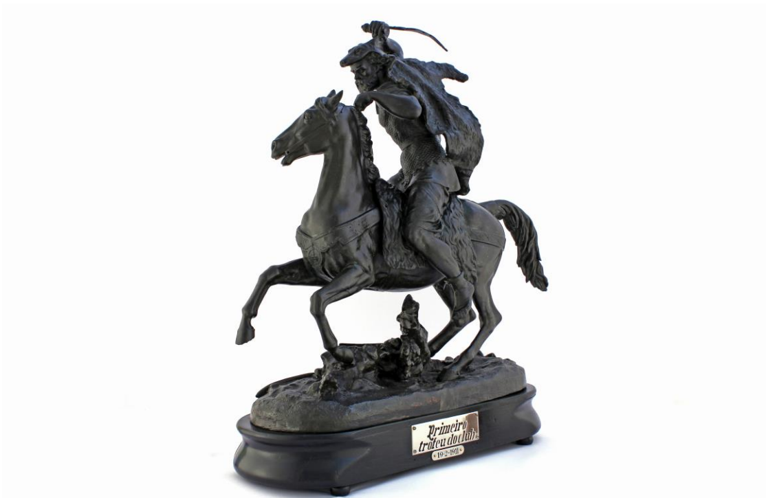
Imagem nº 4: