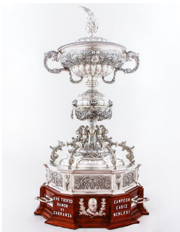
Imagem n°19: