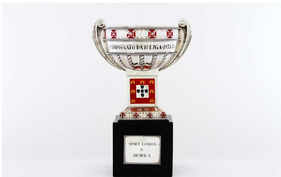
Imagem nº7: Fotografia de João Freitas (fotógrafo do departamento de reserva, conservação e restauro do Sport Lisboa e Benfica).