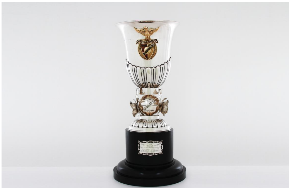
Imagem nº29: