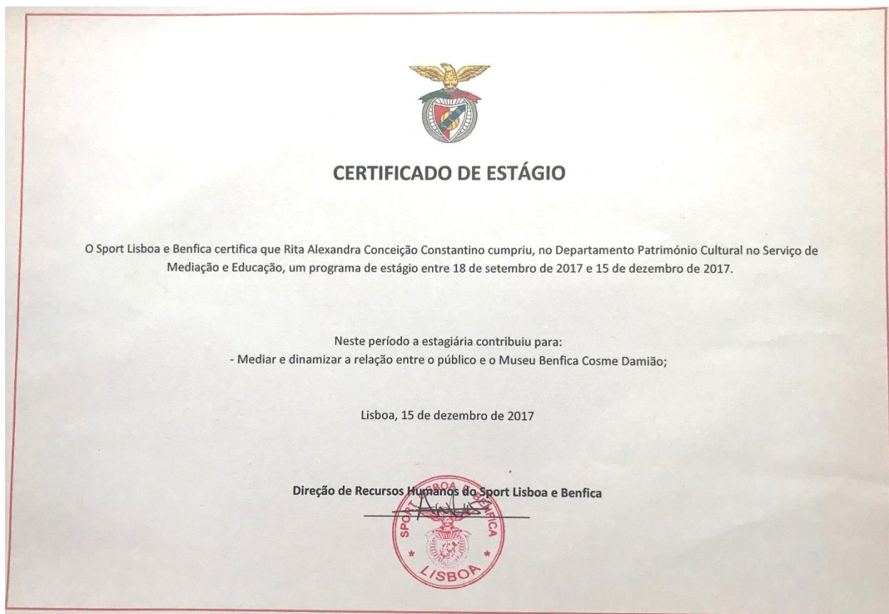
Imagem nº39: Digitalização do meu certificado de estágio realizado no Museu Benfica- Cosme Damião.