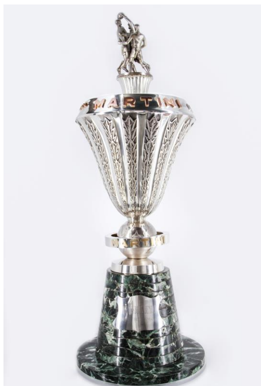
Imagem nº11: Fotografia de João Freitas (fotógrafo do departamento de reserva, conservação e restauro do Sport Lisboa e Benfica).