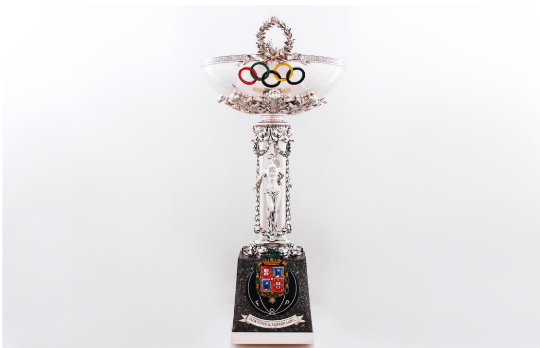
Imagem n°8: