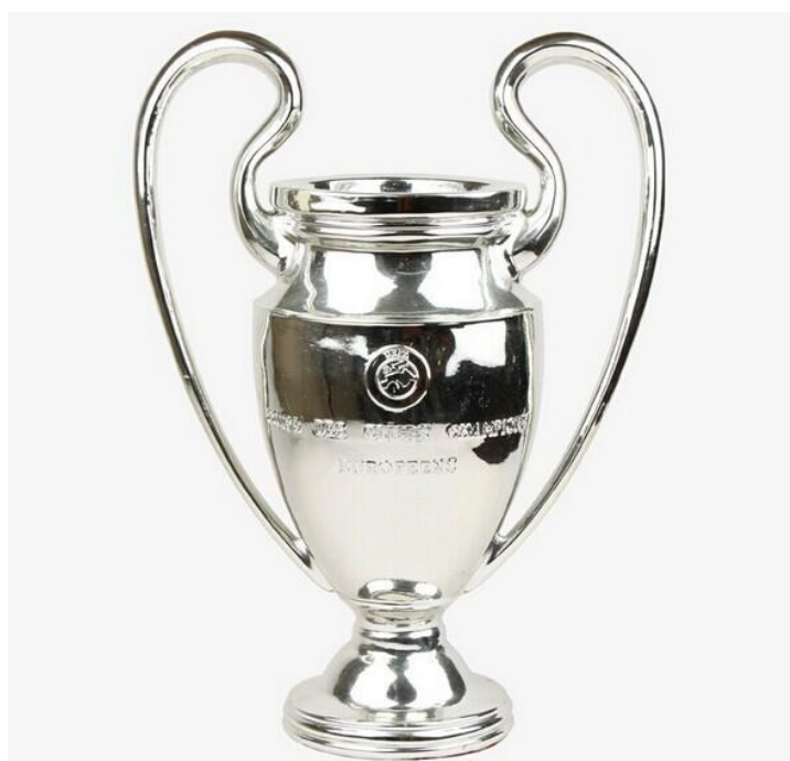
Imagem nº46: Fotografia retirada do site: https://www.uefa.com .