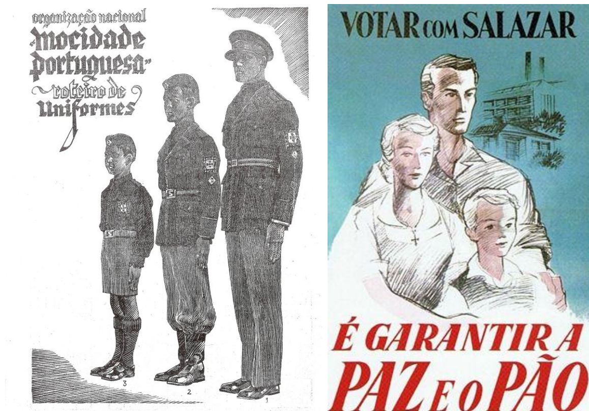
Imagens nº44 e 45: ilustrações do autor Júlio Gil para as publicações do jornal da organização juvenil Mocidade Portuguesa, instituída pelo Estado Novo.