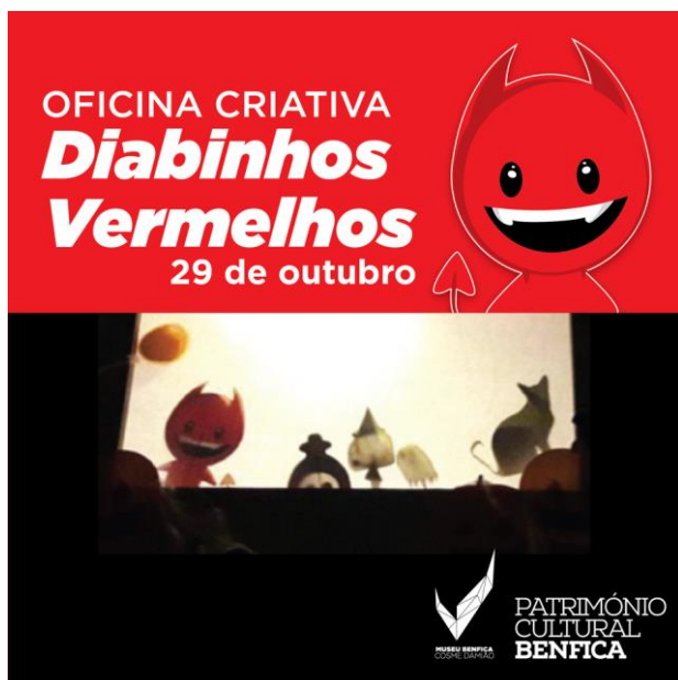
Imagem nº37: Cartaz concebido para a divulgação da oficina criativa de Halloween: Diabinhos Vermelhos.