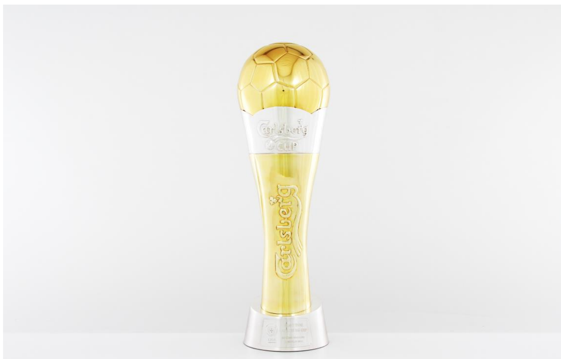
Imagem n°14: Primeiro modelo deste troféu.

Futebol: troféu taça da liga, troféu da liga principal, troféu melhor jogador do mês, supertaça de futsal feminino e masculino, entre outros... 101