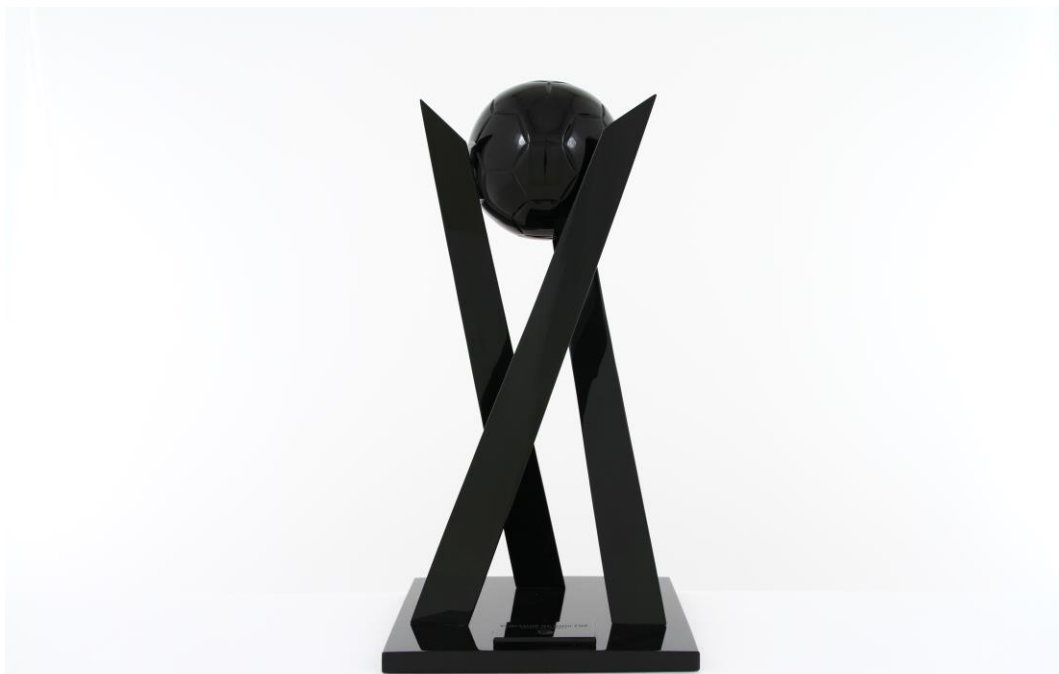
Imagem n°15: Segundo modelo deste troféu.