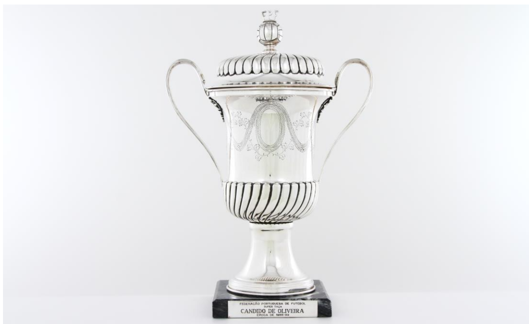
Imagem nº12: Modelo antigo do troféu.