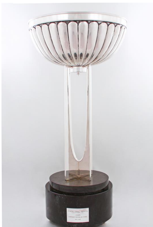
Imagem n°27: