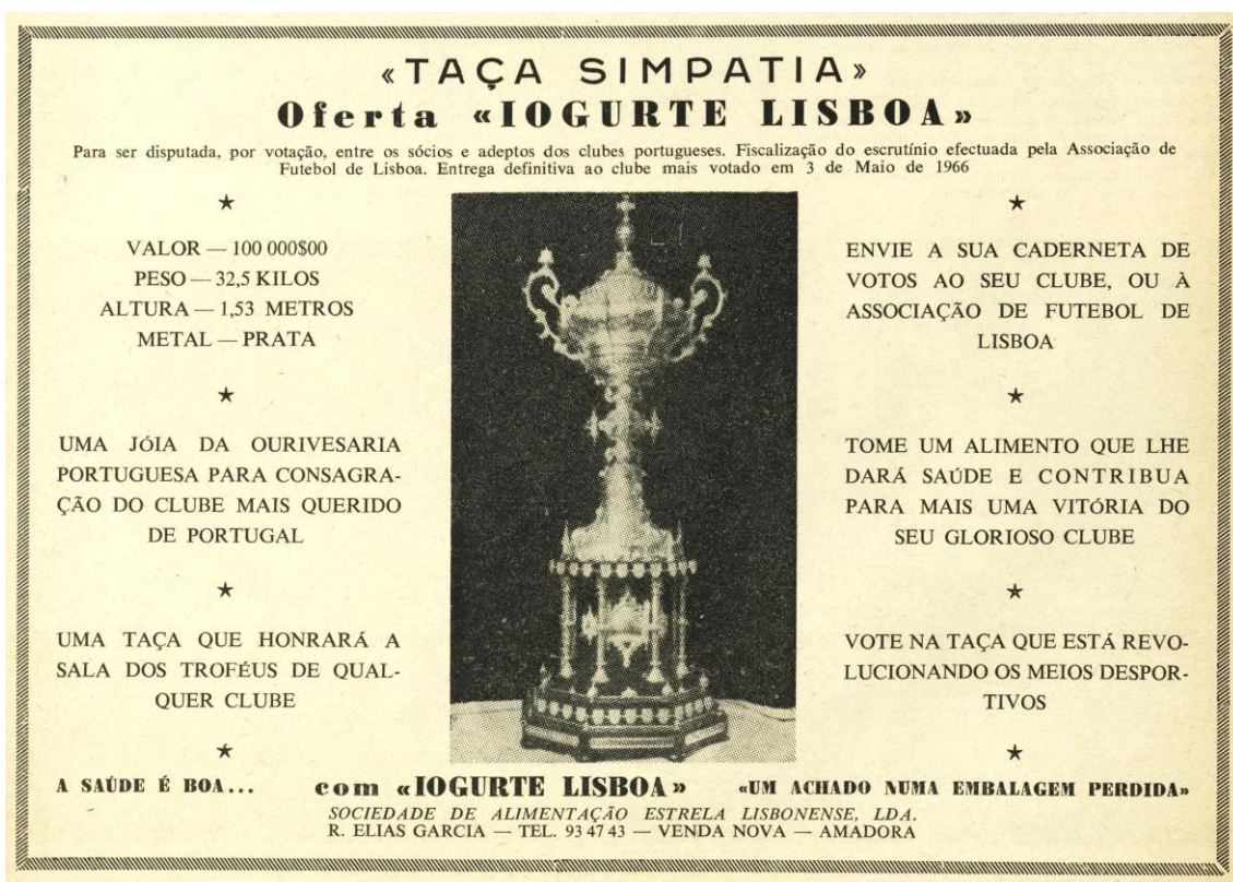
Imagem nº50: Imagem retirada do jornal: O Benfica Ilustrado , 1 de julho de 1965, nº94, p.8.