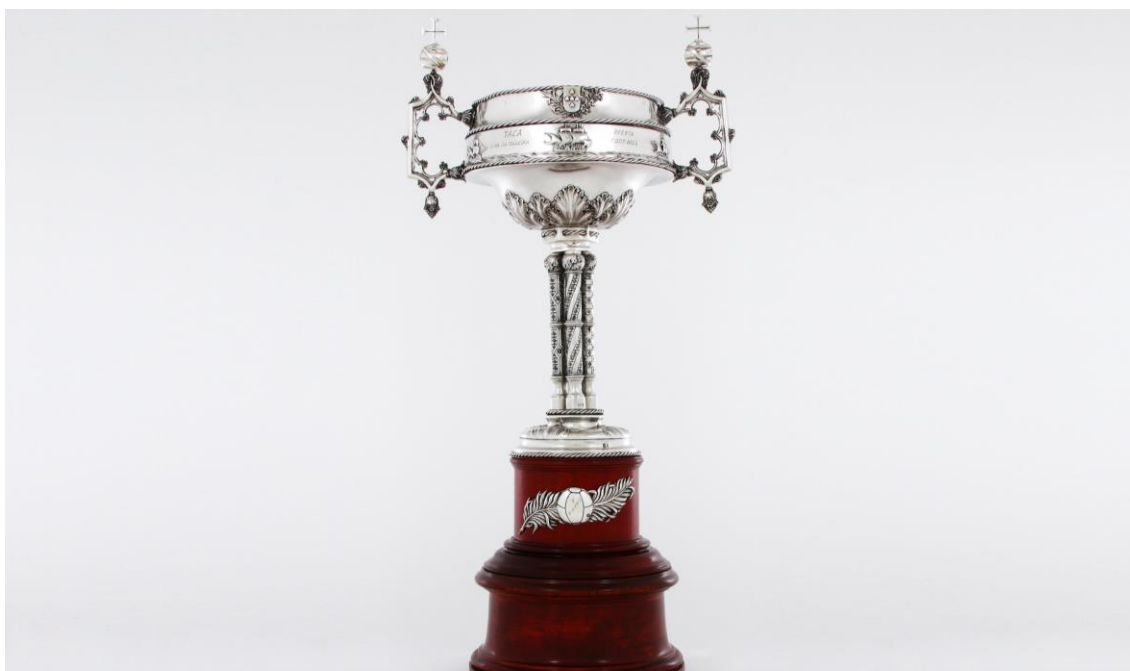
Imagem n°30: