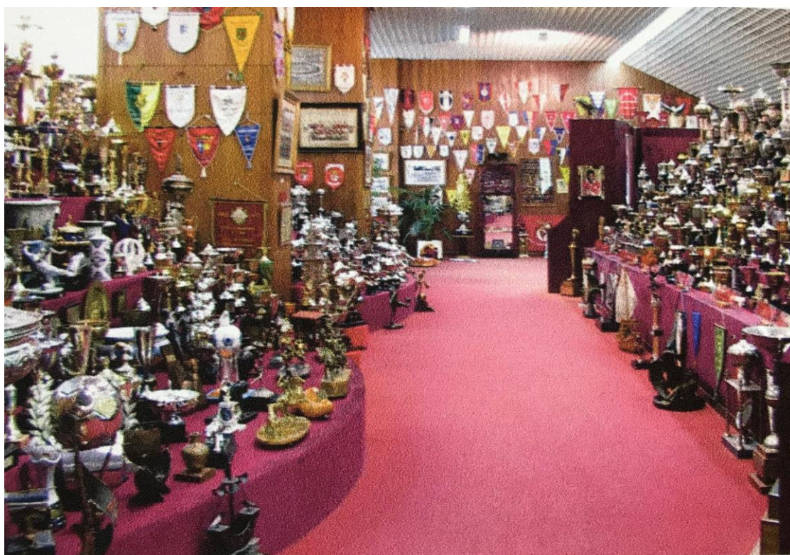
Imagens nº31 e 32: Sala de troféus