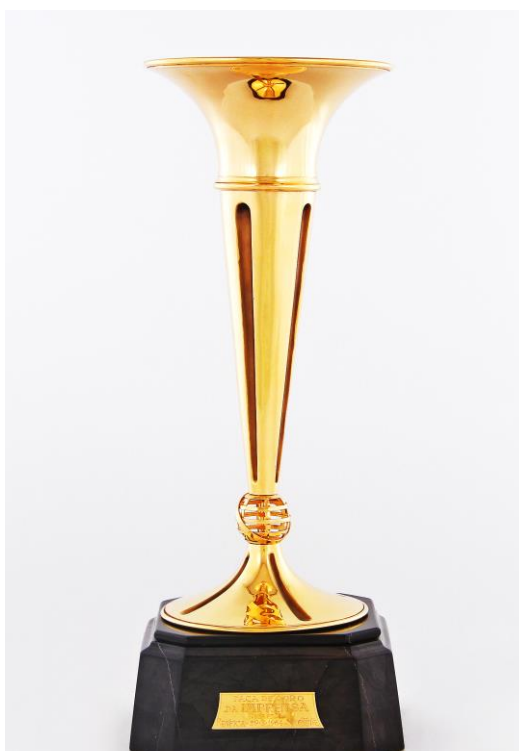
Imagem n°9: