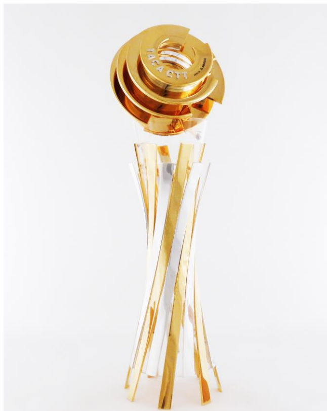
Imagem nº17: Modelo atual deste troféu.