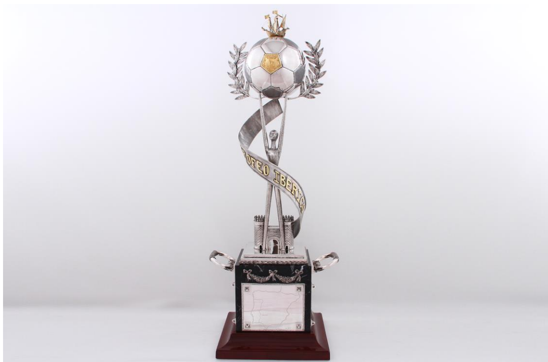
Imagem nº20: