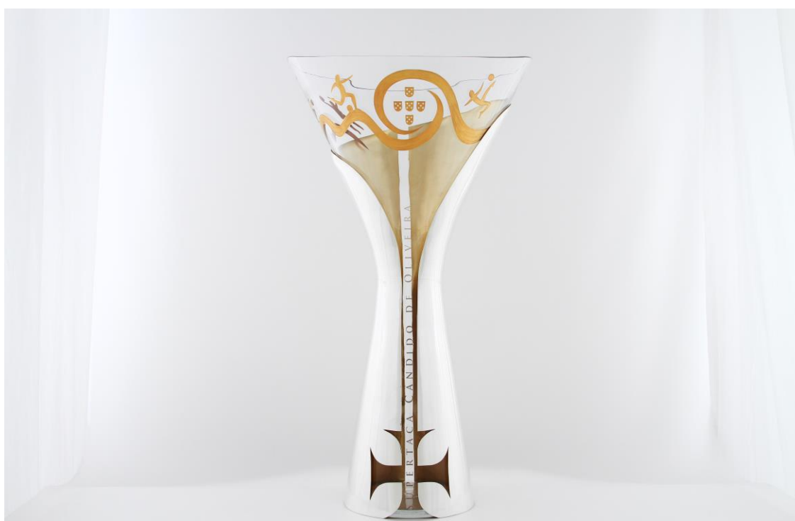
Imagem nº13: Modelo recente do troféu.