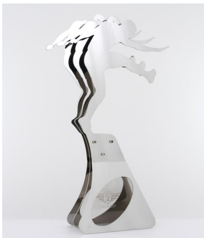
Imagem nº24: