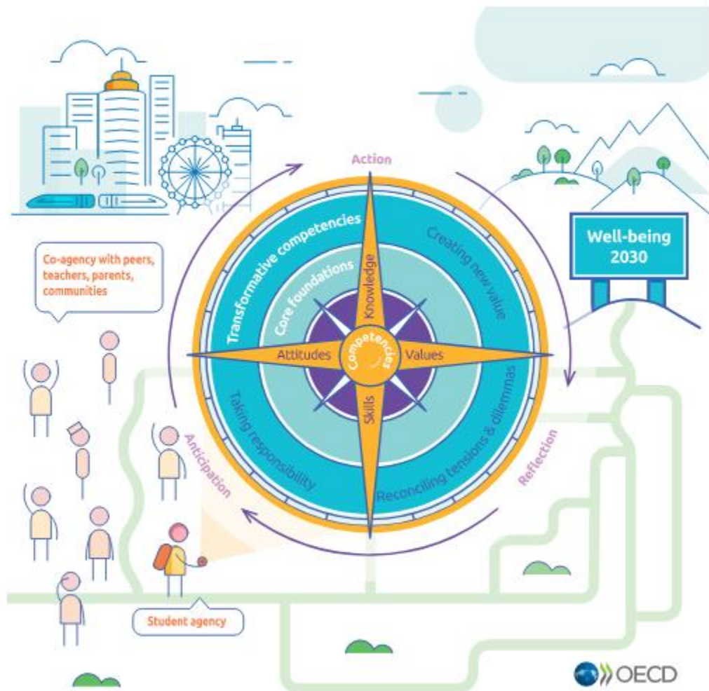
Figura 1 – The OECD Learning Compass 2030.

A OECD criou a bússola de aprendizagem para expressar as megatendências para 2030 como uma metáfora para “the need for students to learn to navigate by themselves through unfamiliar contexts” que tem como direção as competências, atitudes, conhecimentos e valores.