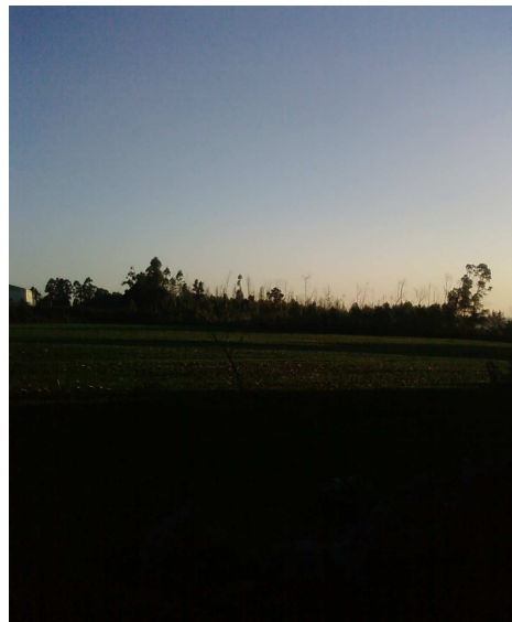
Foto 2 - Vista para Sul, onde se destacam os bons campos de cultivo.