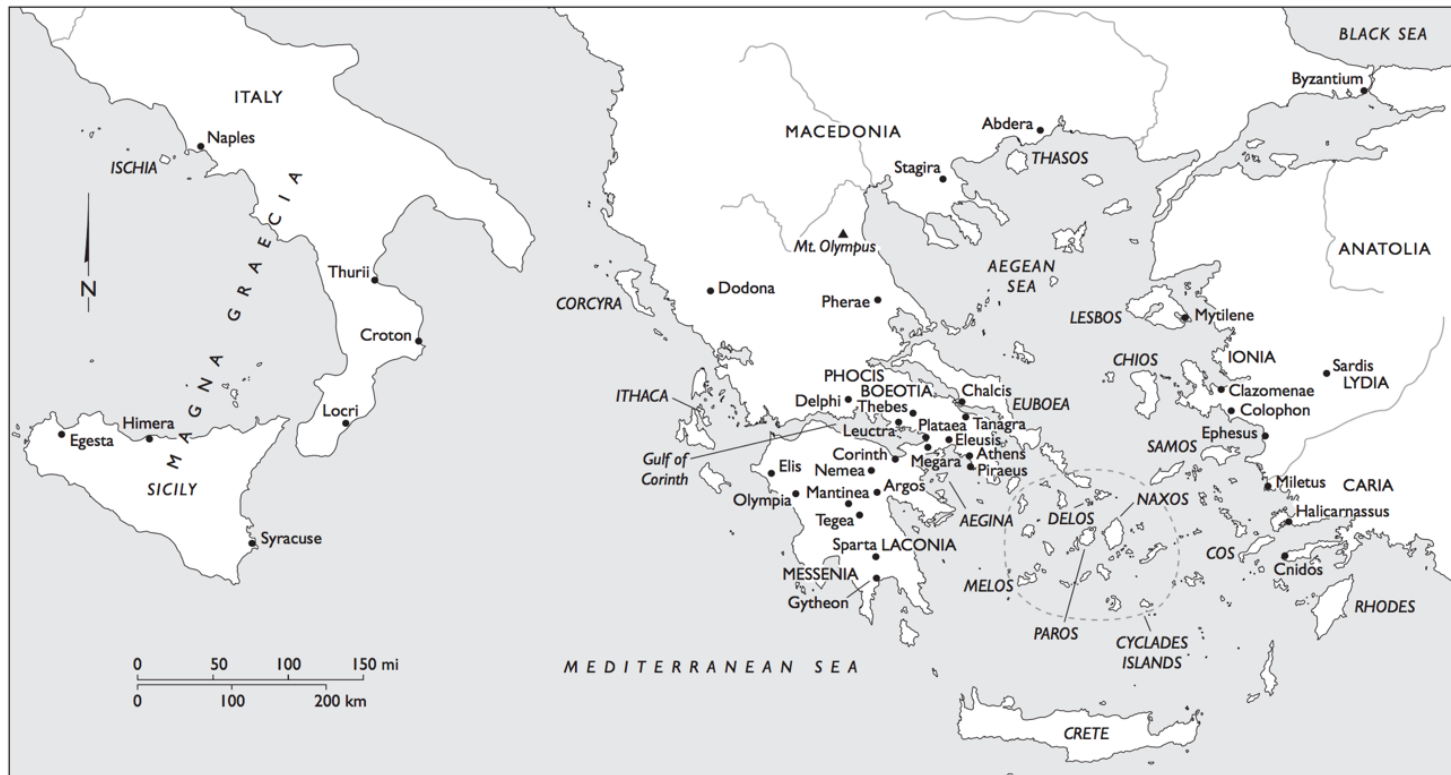
Mapa 2. Magna Grécia, Grécia e Anatólia 1459