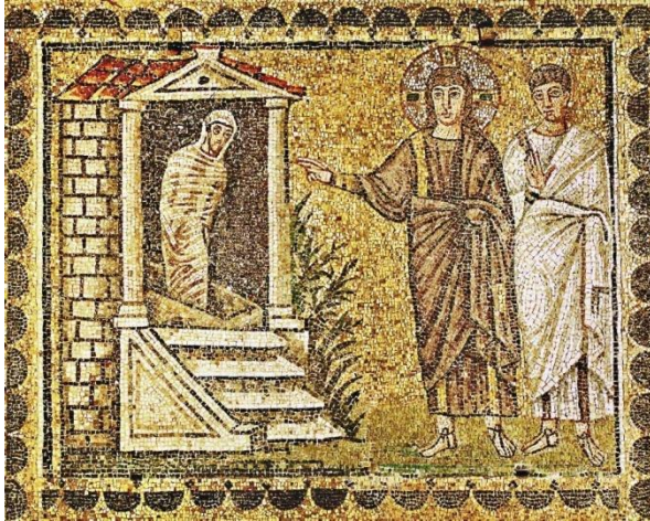
Ilustração I- The Raising of Lazarus