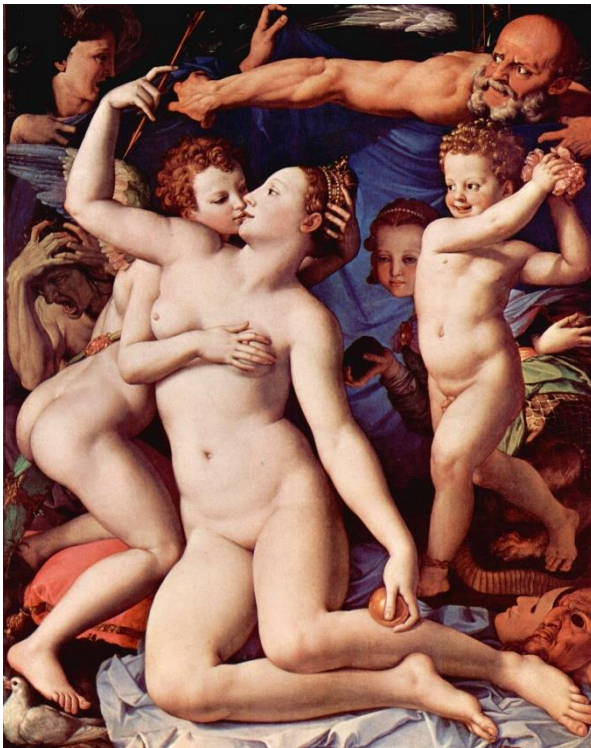
Ilustração II- Venus, Cupid, Folly and Time

Basílica de Santo Apollinare Nuovo, Ravenna, Itália