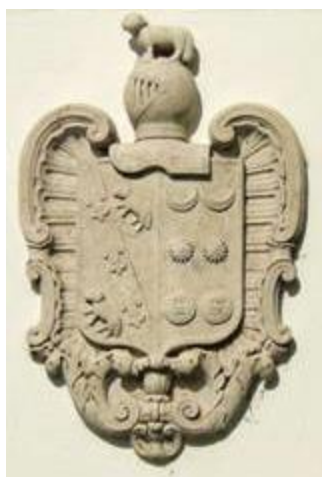
Ilustração 5- Brasão dos Carneiros e Zagallos

Foi sede de Morgadio fundado em 1745 por Rodrigo de Oliveira Zagalo, vínculo que só permaneceu até ao século XIX com a extinção dos morgados. O edifício é um solar brasonado com as armas dos Carneiros e Zagallos (fig. 2), união de Paulo Carneiro Araújo com D. a Josefa Teresa Zagalo, filha de Rodrigo de Oliveira Zagalo. A construção do Solar remonta ao século XVII, tendo sido progressivamente acrescentada até ao ano início do