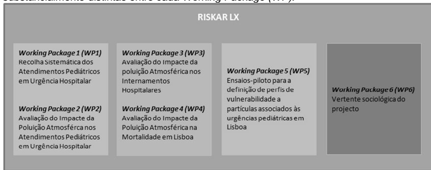
Figura 16: Estrutura do projecto RISKAR LX

O projecto utilizou um vasto conjunto de ferramentas metodológicas, as quais foram separadas em diferentes unidades de trabalho / Working Packages , ligadas entre si por um fio condutor: a avaliação do risco associado à exposição à poluição atmosférica na cidade de Lisboa (Figura 1). Esta abordagem traduziu-se em objectos de trabalho e metodologias substancialmente distintas entre cada Working Package (WP) .