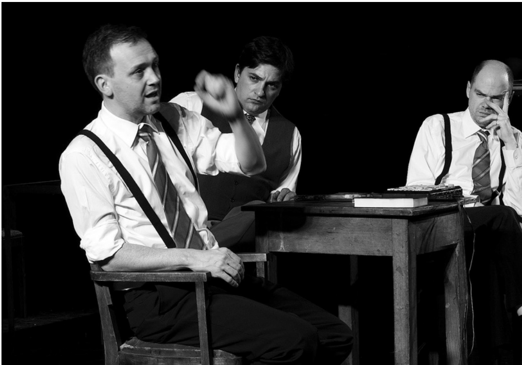
< The monkey trial , texto adaptado da transcrição do "The Scopes Trial ", tg STAN, 2007 (Robby Cleiren, Tiago Rodrigues e Frank Vercruyssen) [Arquivo Mundo Perfeito].