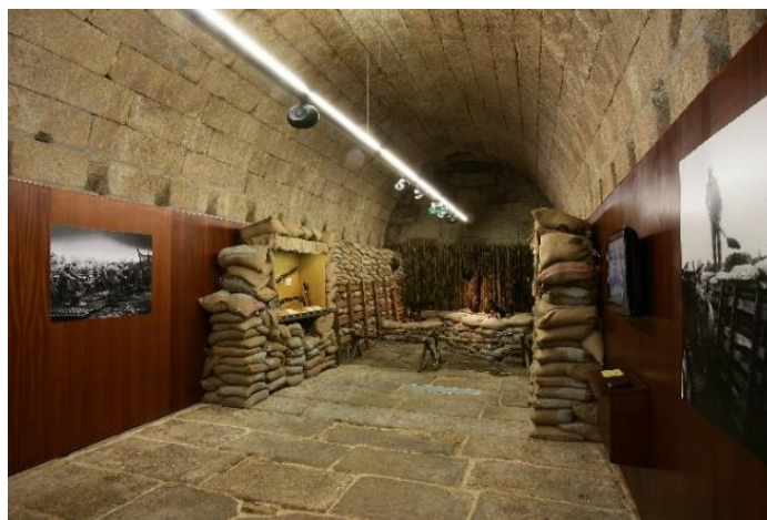
Fotografia nº 13 – Sala da Grande Guerra

Nesta temática, obrigatoriamente, a fim de compreender os sentimentos dos combatentes envolvidos no conflito em questão, “somos transportados para o interior de uma trincheira que recria o cenário em que os soldados portugueses viveram, durante um dos mais trágicos períodos da história mundial.” (Revista Viagem na História, 2021, p.41), cuja memória serve-nos para valorização do sacrifício e reflexão para se evitar novos embates nacionais.