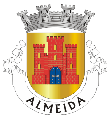
Figura n.º 01 – Logotipo do Município de Almeida.

Neste tópico, identificamos a necessidade de tratarmos sobre o município de Almeida, que é considerado uma Vila Histórica de Portugal, cuja riquezas culturais e acolhimento impressionam qualquer visitante, seja ele nacional ou estrangeiro, estudioso ou iletrado, o que permite uma excelente interação visitante-visitado. Desta forma, caminhemos para conhecer Almeida, a Estrela do Interior.