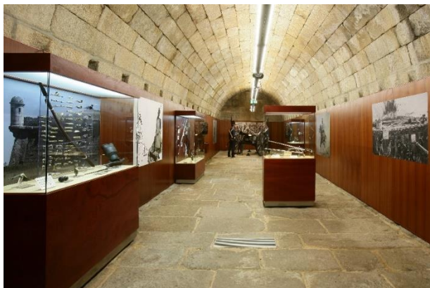
Fotografia nº 11 – Sala da Guerra Peninsular

A prosseguir na caminhada histórica pelo MHMA, evidencia-se a Sala da Guerra Peninsular, particularmente no contexto da Terceira Invasão Napoleónica, em 1810, onde as tropas francesas invadiram o território português pela cidade de Almeida, a qual foi muito bem preparada em pessoal, material, equipamentos, armamentos, munições e suprimentos para resistir à investida inimiga com a adoção de cerco continuado e prolongado. Neste domínio, “no desenrolar das Guerras Peninsulares, nos episódios de 1810, Almeida aparece-nos como ponto crucial de entrada das hostes inimigas em solo português.” (Monteiro, 2010).