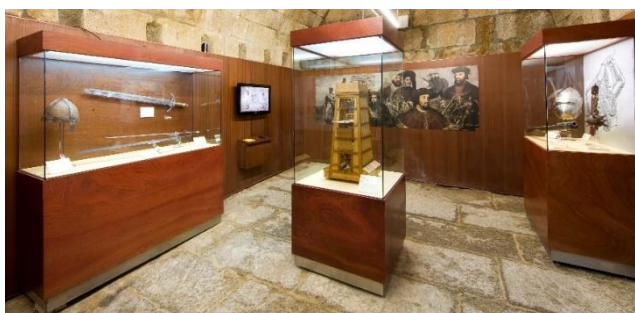
Fotografia n° 08 – Sala da Idade Média

De seguida, surge-nos a Sala da Idade Média, onde os moradores e turistas encontram o retrato descritivo dos utensílios bélicos usados no período medieval e, também, no início da era moderna, especialmente aqueles relacionados ao tema da neurobalística. Em uma ambientação, identificamos, essencialmente, a trajetória de Almeida como recurso de defesa territorial por ocasião das diversas investidas de forças estrangeiras, que invadiram ou ameaçaram invadir o território português, por vários motivos e circunstâncias, cujo resultado foi a ocorrência de “combates e cercos, entre portugueses, mouros, leoneses e castelhanos” pela luta, conquista, posse e exploração da região de Almeida. Por fim, ainda, destaca-se que Almeida tornou-se, definitivamente, portuguesa por intermédio da ação de Dom Diniz com a celebração do Tratado de Alcanices. (Catálogo do Museu Histórico-Militar de Almeida, 2009, p.10). Além do que, nesta sala de exposição, o conteúdo recriado “mostra-nos as táticas de assédio às fortificações e os tipos de combate.” (Revista Viagem na História, 2021, p.40).