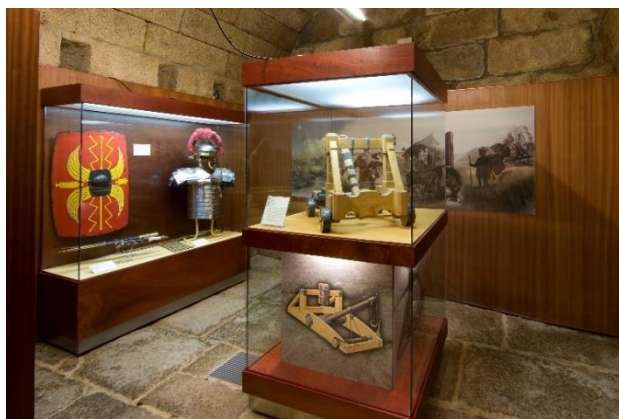
Fotografia n° 07 – Sala da Origem

De seguida, surge-nos a Sala da Idade Média, onde os moradores e turistas encontram o retrato descritivo dos utensílios bélicos usados no período medieval e, também, no início da era moderna, especialmente aqueles relacionados ao tema da neurobalística. Em uma ambientação, identificamos, essencialmente, a trajetória de Almeida como recurso de defesa territorial por ocasião das diversas investidas de forças estrangeiras, que invadiram ou ameaçaram invadir o território português, por vários motivos e circunstâncias, cujo resultado foi a ocorrência de “combates e cercos, entre portugueses, mouros, leoneses e castelhanos” pela luta, conquista, posse e exploração da região de Almeida. Por fim, ainda, destaca-se que Almeida tornou-se, definitivamente, portuguesa por intermédio da ação de Dom Diniz com a celebração do Tratado de Alcanices. (Catálogo do Museu Histórico-Militar de Almeida, 2009, p.10). Além do que, nesta sala de exposição, o conteúdo recriado “mostra-nos as táticas de assédio às fortificações e os tipos de combate.” (Revista Viagem na História, 2021, p.40).