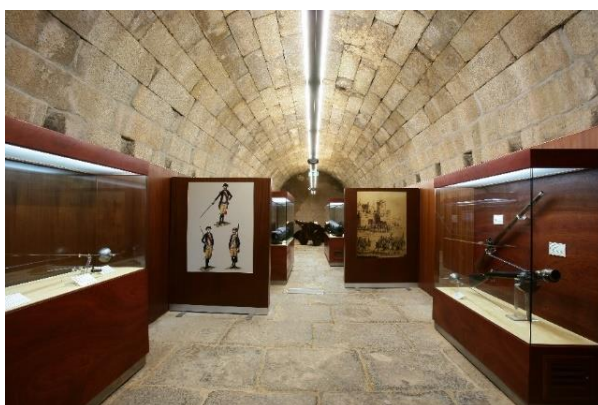
Fotografia nº 10 – Sala dos Sete Anos

A prosseguir na caminhada histórica pelo MHMA, evidencia-se a Sala da Guerra Peninsular, particularmente no contexto da Terceira Invasão Napoleónica, em 1810, onde as tropas francesas invadiram o território português pela cidade de Almeida, a qual foi muito bem preparada em pessoal, material, equipamentos, armamentos, munições e suprimentos para resistir à investida inimiga com a adoção de cerco continuado e prolongado. Neste domínio, “no desenrolar das Guerras Peninsulares, nos episódios de 1810, Almeida aparece-nos como ponto crucial de entrada das hostes inimigas em solo português.” (Monteiro, 2010).