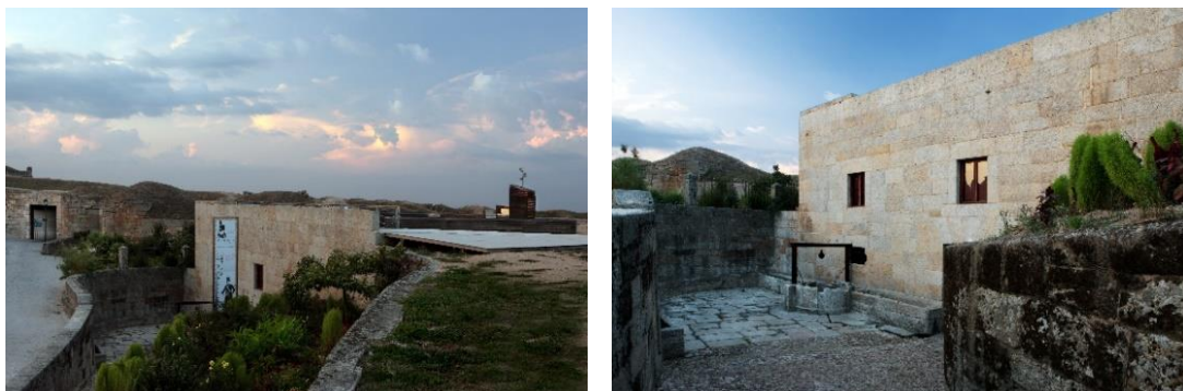
Fotografias nº 01 e 02 – Vista da entrada do MHMA.

Existe, também, o Centro de Estudos de Arquitectura Militar de Almeida, que será chamado de CEAMA.