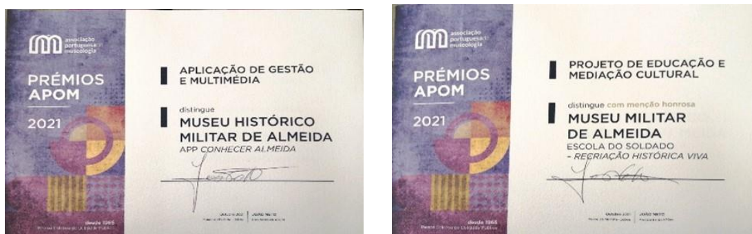
Figuras nº 02 e 03 – Prémio e Menção Honrosa da APOM ao MHMA.

Nesta perspetiva, apresentamos o prémio e a menção honrosa da APOM em reconhecimento às candidaturas dos projetos do MHMA no tocante às atividades culturais e museológicas desenvolvidas no decorrer do ano de 2021.