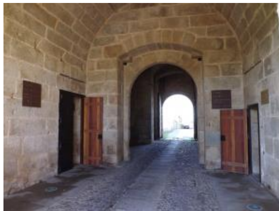
Fotografia nº 03 – Centro de Estudos de Arquitectura Militar de Almeida.

Existe, também, o Centro de Estudos de Arquitectura Militar de Almeida, que será chamado de CEAMA.