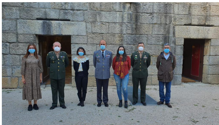
Fotografia nº 17 - Visita Institucional da Comitiva do Gabinete do Comandante do EB.

De seguida, apresentamos um registo histórico da primeira ida de uma Comitiva do Exército Brasileiro ao município de Almeida, em especial ao MHMA com uma visita guiada, conduzida pela Coordenadora e equipa, por todas as dependências temáticas e assimilando todas as explicações ministradas sobre os temas a envolver os acontecimentos da História de Portugal, cujas anotações pessoais formaram um importante conhecimento para o pesquisador e comitiva.