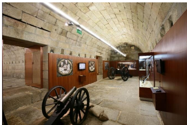
Fotografia nº 12 – Sala das Lutas Liberais

Na divisão espacial do MHMA, passa-se pela Sala das Lutas Liberais, cujo ambiente histórico, também, foi experienciado e vivido fortemente pela Praça-forte de Almeida, distintamente pelos moradores da localidade, que escolheram a defesa da causa liberal, em função do que estava a acontecer em todo Portugal. Em virtude desta decisão local, verificamos que, no desenvolvimento das contendas liberais, refere-se que Almeida capitulou a 25 de abril de 1844. Como consequência, neste período, as casamatas do MHMA foram utilizadas como “prisão política dos adeptos da causa liberal”. (Catálogo do Museu Histórico-Militar de Almeida, 2009, p.29). Aqui, presencialmente, ao contemplar o acervo existente, “viajamos pelo conturbado período liberal, de grande intensidade, vivido em Almeida.” (Revista Viagem na História, 2021, p.41).