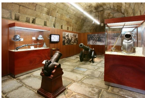
Fotografia nº 09 – Sala da Restauração

Independência Portuguesa, ocorrida entre 1640 e 1688, após a dissolução da União Ibérica (1580 – 1640). Em especial, regista-se, historicamente, que a cidade de Almeida, especificamente no dia 2 de julho de 1663, rechaçou, brava e impetuosamente, o ataque das tropas espanholas, que eram superiores, numericamente, em efetivos, equipamentos e armamentos às forças civis e militares portuguesas existentes na resistência em ação. Assim, ressaltamos, reconhecidamente, que “a guarnição da fortaleza resistiu e rechaçou o ataque forçando o inimigo a retirar.”. (Catálogo do Museu Histórico-Militar de Almeida, 2009, p.15). Com isto, nesta exposição, há um “destaque para o episódio histórico de 1663, do ataque à Praça-forte pelo Duque de Osuna, onde Almeida saiu vitoriosa.”. (Revista Viagem na História, 2021, p.40).