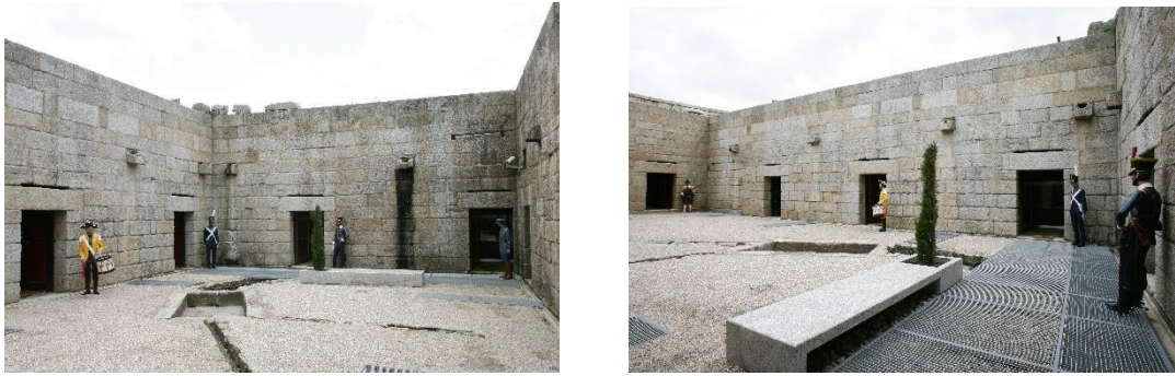
Fotografias nº 05 e 06 – Pátio do MHMA

Em termos de construção do edifício do MHMA, inicialmente, destacamos a complexidade do Baluarte de São João de Deus, conjunto de aproximadamente 20 (vinte) casamatas, que foi projetado pelo Engenheiro-Mor do Reino, Manuel de Azevedo Fortes, cuja planta arquitetónica é datada, aproximadamente, de 1736.