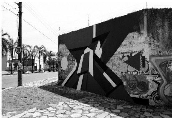
Figura 1 - Santiago Selon, 2006, Goiânia, Brasil.