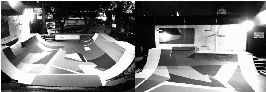
Figura 6 · Desenho vetorizado e pintado em programa gráfico.