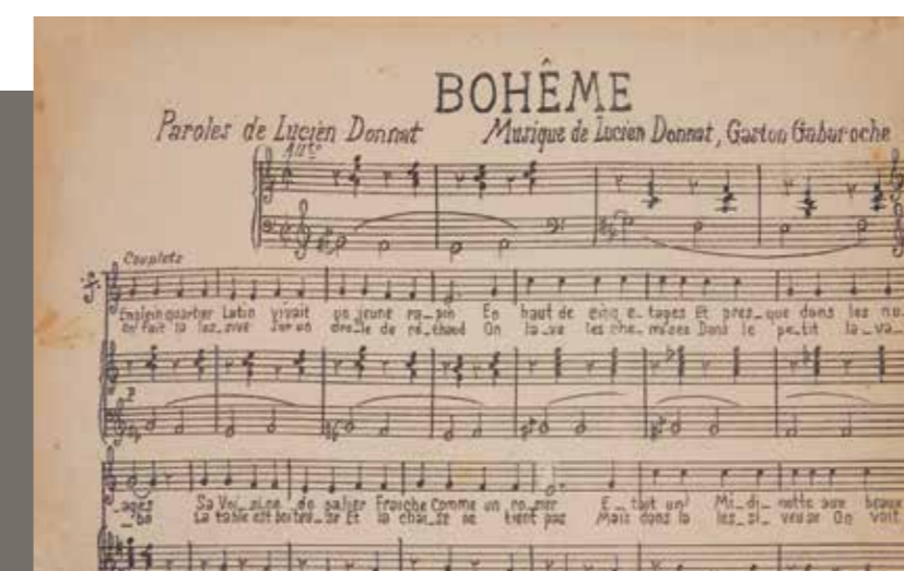
Partitura de uma canção original de Lucien Donnat (década de 1930)