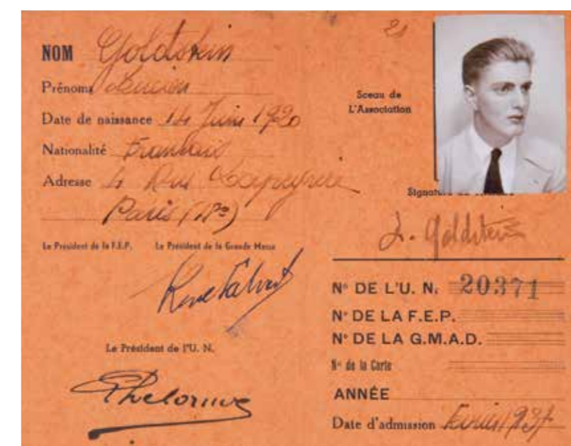
Cartão da Associação de Estudantes da École Nationale Supérieure des Arts Décoratifs (1938)