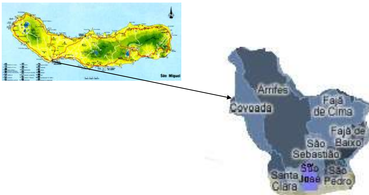
Figura 1. Mapa de São Miguel com identificação das freguesias de Arrifes, Covoada, Fajã de Cima, Fajã de Baixo, Santa Clara, São José, São Sebastião e São Pedro.