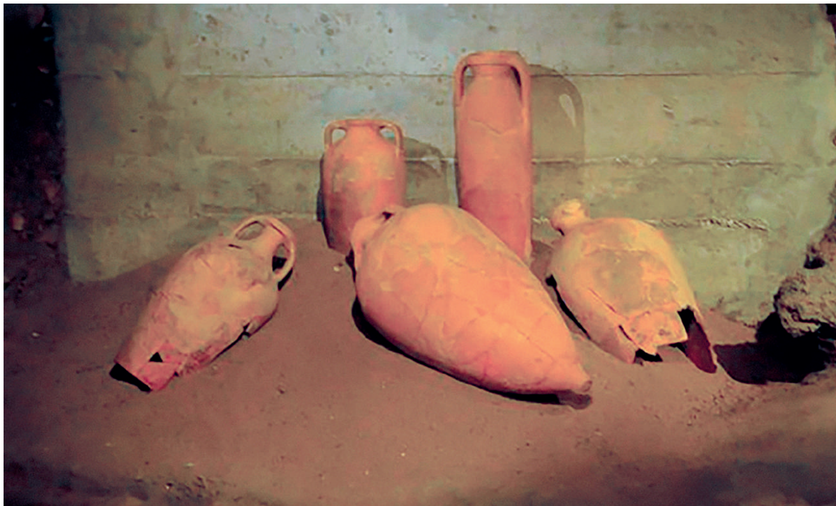
FIG. 4 Formas de ânforas tardias (Séculos III a VI/VI) fabricadas nas olarias do estuário do Tejo e encontradas no interior dos tanques das unidades de produção de preparados de peixe na Rua dos Correiros (NARC).

Usualmente, supunha-se que o colapso da produção dos preparados de peixe lusitanos e a sua exportação teria ocorrido nos inícios do século V. Hoje sabemos que assim não foi e que algumas unidades de produção continuaram a laborar durante toda esta centúria, embora outras tenham sido abandonadas. Também aqui encontramos indicadores de que alguma transformação estava em curso na economia do estuário, embora não correspondendo ao colapso final que se chegou a supor. De há vários anos a esta parte tem-se multiplicado o registo de ânforas lusitanas