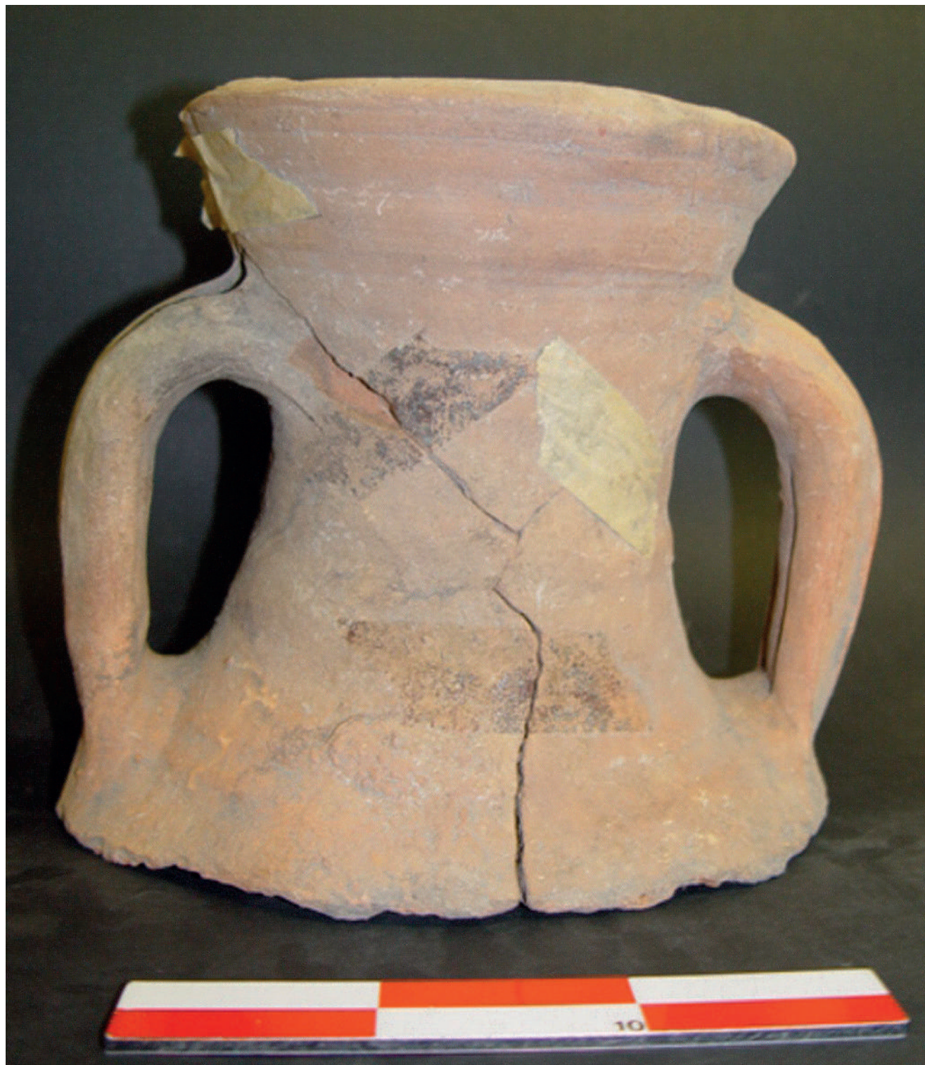
FIG. 2 Bocal, colo e asas de uma das mais antigas formas de ânforas de tipologia romana produzida nas olarias do estuário do Tejo (em olaria ainda desconhecida), encontrada aquando da construção do coletor da Baixa, na zona da Rua Augusta. Provavelmente, corresponde ao primeiro modelo dos contentores de transporte de preparados de peixe.