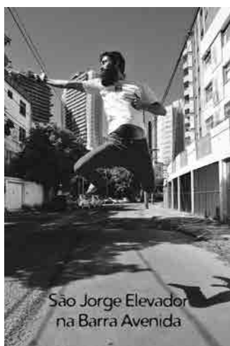
Figura 7 · Arthur Scovino, Oráculo Caboclo 19 — Oráculo Caboclo , 2015. Performance. Borboletário do SESC Pantanal, MT.