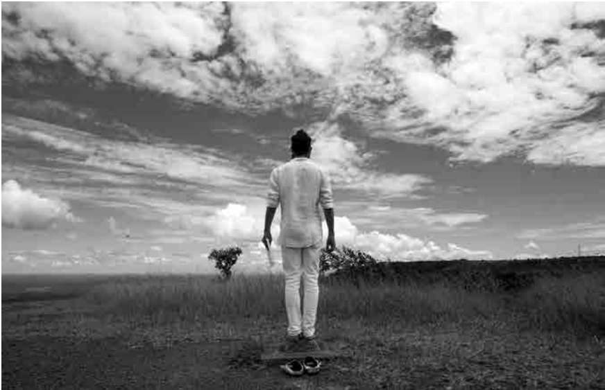
Figura 4 · Arthur Scovino, Casa de Caboclo , 2015. Instalação. Acervo do autor.