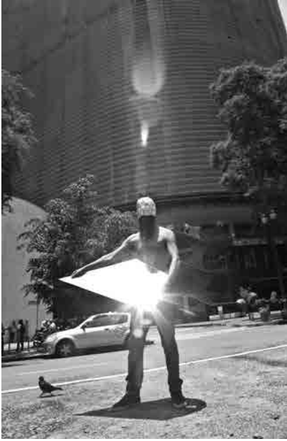
Figura 10 · Arthur Scovino, Caboclo Meio-Dia , 2015. Fotoperformance para Bazaar Art . Foto: Fabio Motta. Acervo do Artista.