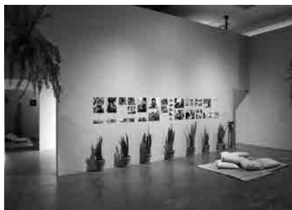
Figura 1 · Arthur Scovino, Levando os Elepês de Gal para passear... , 2011. Performance.