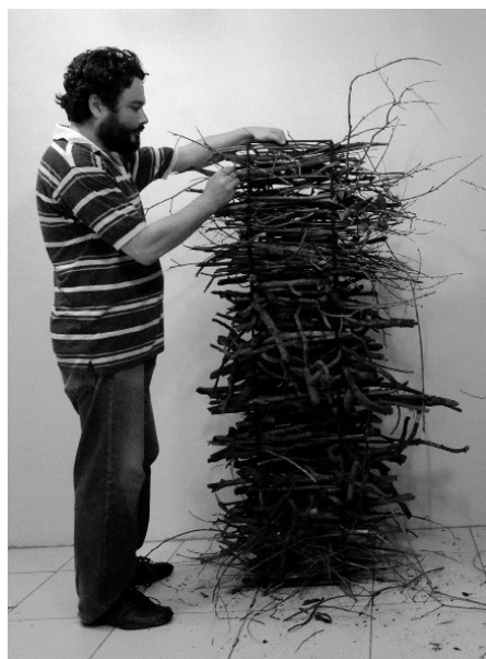
Figura 4 · Registro de Ateliê, 2011. Figura 5 · Registro de Ateliê, 2011.