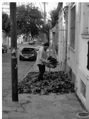
Figura 6 · "Gravetos armados" de Antônio Augusto Bueno. Intervenção na fachada do Jabutipê, 2011.