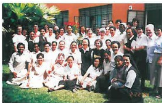
Grupo de irmãs em formação (1)

O Carmelo missionário define-se como congregação religiosa laical. As Carmelitas Missionárias partilham o seu trabalho pastoral, paroquial e social com os leigos, numa missão conjunta de formar e de educar em valores humanos e cristãos e de reforçar a espiritualidade.