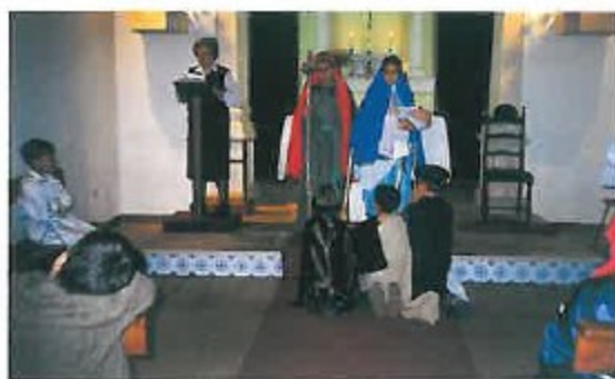
Encenação da adoração dos pastores, com as crianças da catequese (I)