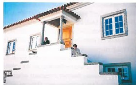
Comunidade de Currelos, Carrega do Sal, fundada a 29 de Dezembro de 2007 (I)