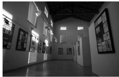
Figura 5. Reconstrucción utópica del espacio, proponiendo una alternativa más acorde con la identidad del joven autor. Fuente propia.

Figura 6. Una obra que se identifica de manera positiva con el entorno y refuerza su valor estético e identitario, con la propia presencia de la autora. Fuente propia.