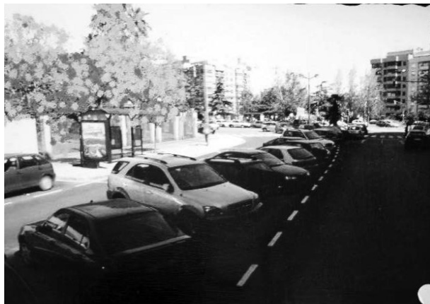
Figura 1. Se vislumbra la percepción de los elementos de la ciudad asociados a sus experiencias positivas, a través del color, los árboles del parque; y las experiencias negativas y que no sienten propias, visualizadas en los grises, del tráfico y los vehículos.

que residen, el barrio de Patraix en la ciudad de Valencia, ciudad mediterránea, situada al este de la península ibérica.