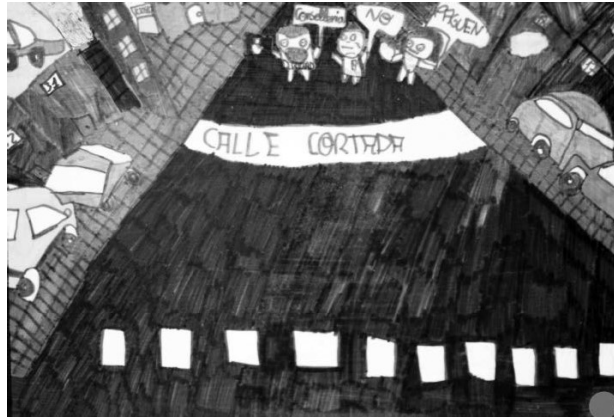
Figura 4. Los profesores del centro y las protestas sociales en defensa de la educación, se convierten en los protagonistas de la visión del espacio urbano de este alumno.

de secundaria-, no olvidaran algunas problemáticas sociales y de la actualidad del momento, que ellos y ellas vincularán con su propia experiencia de la ciudad y del entorno. En algunos casos encontramos una asociación de ideas muy interesante, entre el espacio público urbano y la protesta social. Una identificación del espacio colectivo y público de las calles, como lugar natural para expresar las desavenencias hacia determinadas decisiones del poder establecido.