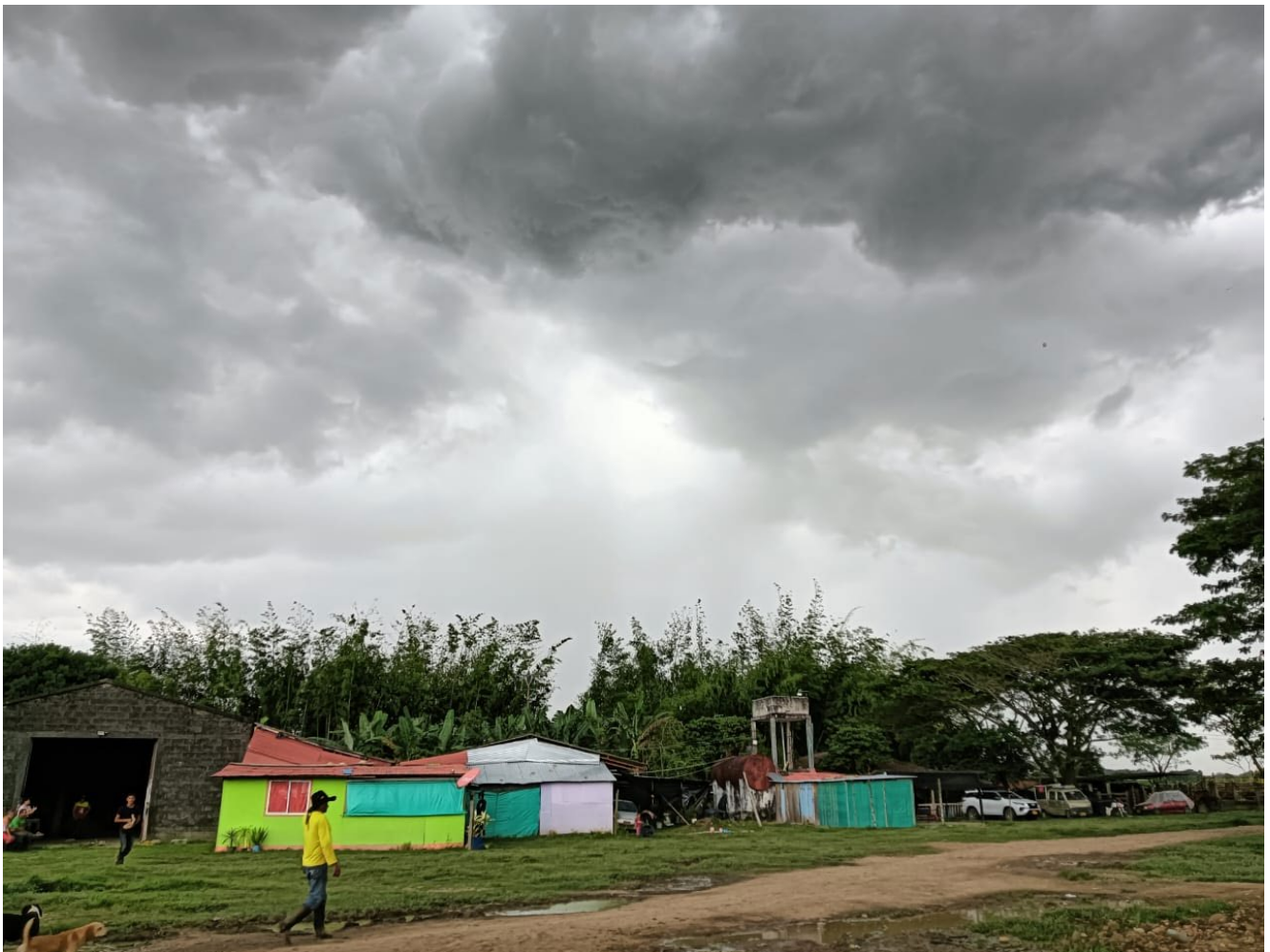
Figura 3: ETCR Nova Vida fonte do autor.

que fazem com que meninos e meninas de 7 a 12 anos fujam de casa e venham para a guerrilha em busca de uma nova realidade.