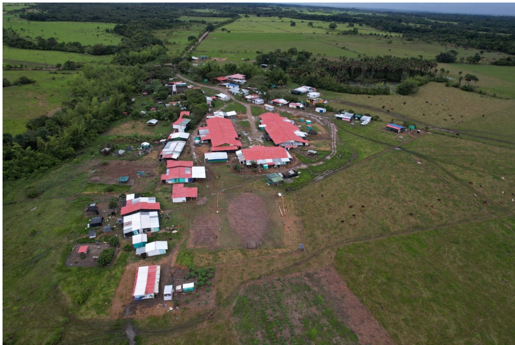
Figura 2: ETCR Nova Vida.

Os resultados desta investigação são contributos indispensáveis, na medida em que permitem uma visão alargada dos actores e do território em termos da implementação do programa DDR, da política de reincorporação e da dimensão de bem-estar que é construída neste contexto.