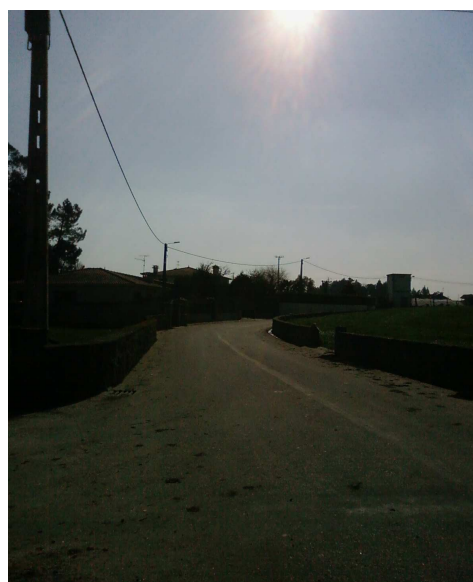
Foto 2 - Vista para Sudoeste, sendo visível a antropização do espaço a Norte do Rio Este.