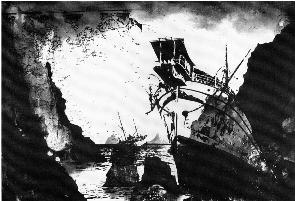
Bartolomeu dos Santos, After the Storm , Fotogravação e água tinta, 1983

Tentemos desvendar cada um dos três níveis – o real, o semi-fantasmático e o fantasmático; porém, primeiro temos de entrar no labirinto que cada um deles forma, para podermos depois penetrar no grande labirinto que abrange os três, o romance e a nossa vida.